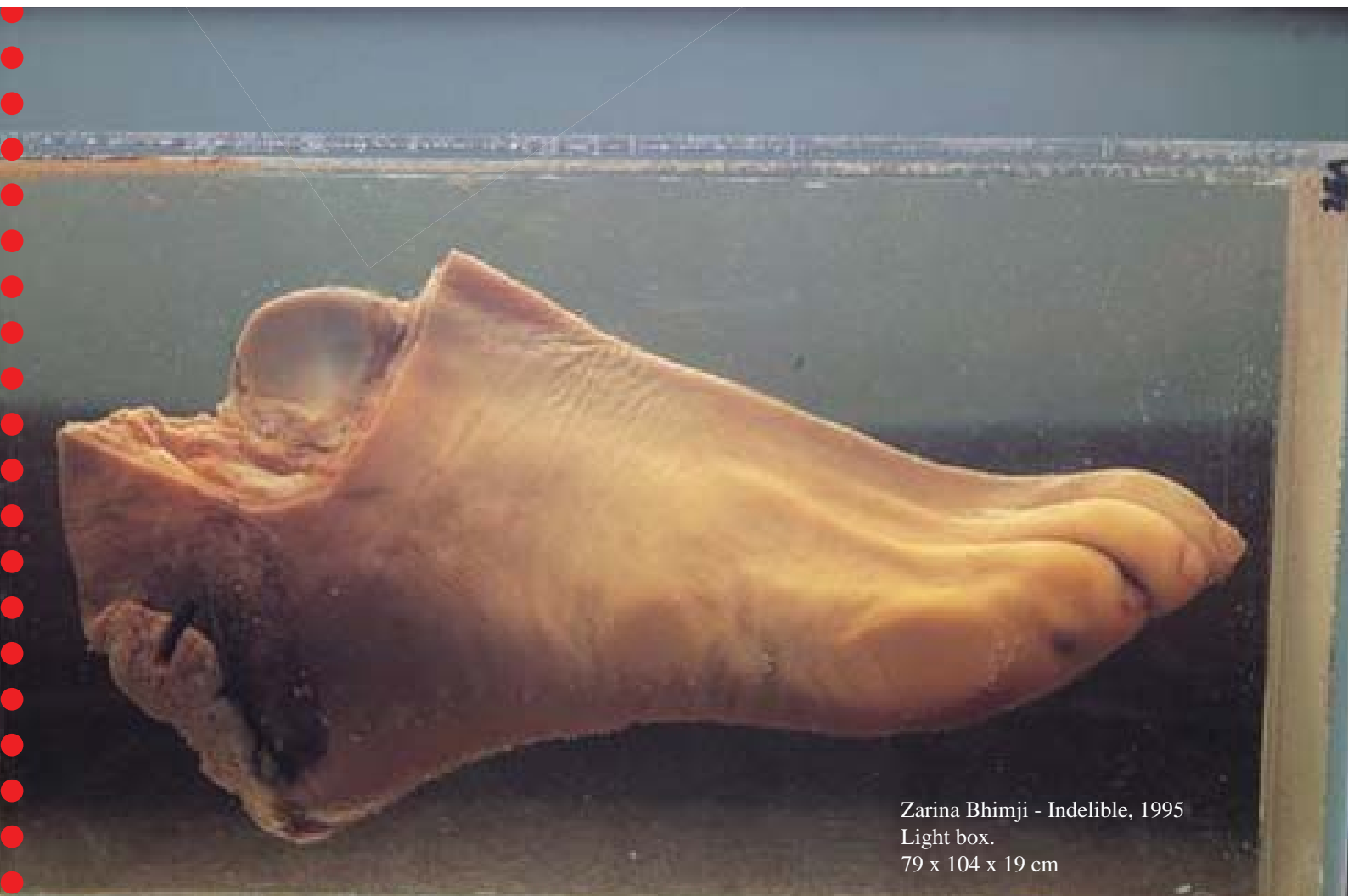
Zarina Bhimji - Indelible, 1995 Light box. 79 x 104 x 19 cm