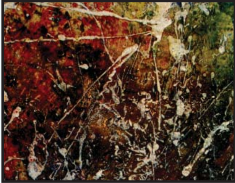
Hluti úr verkinu óður til Reykjanes eftir GRL