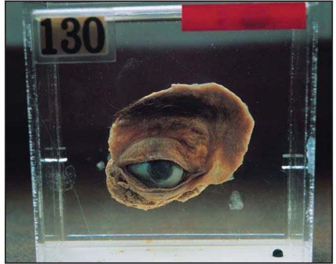
Ljósmyndir fengnar af netinu.