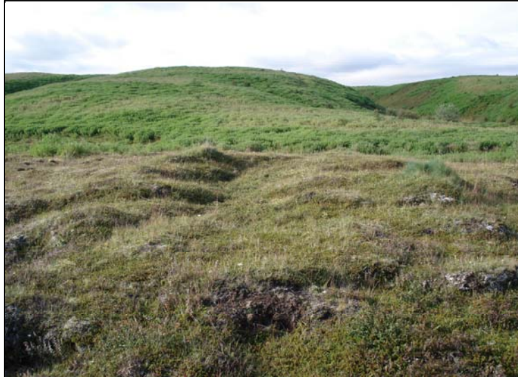
TÓFT, HORFT TIL S

Nokkrum metrum norðan við fyrirhugað vegarstæði er fornleg tóft.