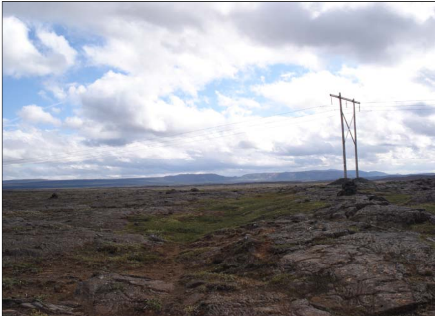
TVÆR VÖRDUR, HORFT TIL S

Fast sunnan við núverandi veg og um 370 austan við fyrirhugað vegarstæði er varða. Helluhraunsholt.