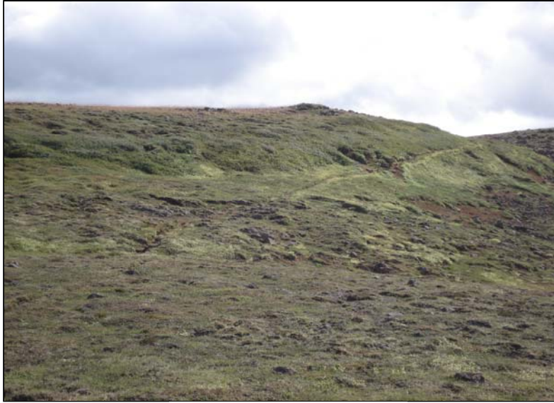
FJÁRGATA Í SNEIDINGI, HORFT TIL S

Í móanum sem er vestan og sunnan við Höskuldsvatn er fjárgata sem liggur nokk samhliða núvetrandi vegi um Reykjaheiði. Þýfður lyngmói.