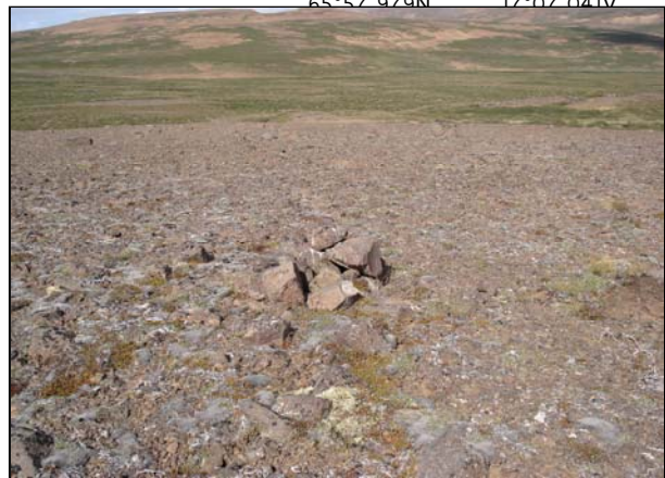
VARÐA, HORFT TIL N