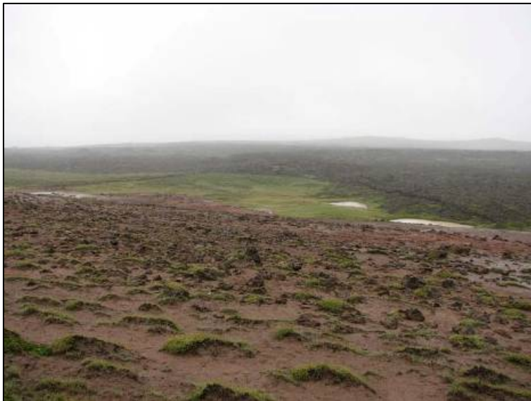
ÞEISTAREYKJAAÐHALD, HORFT TIL VSV

"Í klettaborgum vestur af Kvíhólafljóllum var hlaðið Kvíhólaaðhald fyrir fé, og Þeistareykjaaðhald er norðar hjá Þeistareykjum." segir í örnefnalýsingu. Um 1,35 km NNV við Þeistareyki (001), nyrst í krika sem myndast af Þeistareykjahrauni að vestan og hverabrekku að austan er Þeistareykjaaðhald. Það er um 800 m norðan við norðausturhornið á landgræðslugirðingunni. Nyrst í lyngmóa, í dæld milli hrauns og hveraleirsbrekku, en engir virkir hverir eru þar nú. Ofan (austan) við brekkuna eru Þeistareykjagrundir en næst aðhaldinu er brekkan nær avleg gróðurlaus. Innan í gerðinu er grasnói og litlar tjarnir nyrst