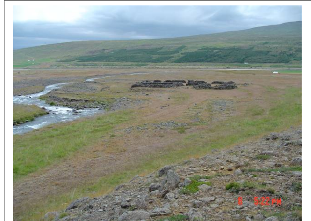
Þorvaldsdalsrétt (190:010), horft til austurs