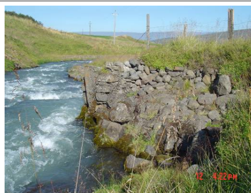
Brúarstöpull (191:013), horft til SA

Túnstærð 1917:4,9 ha. Sléttað tún 2/5, sáðreitir 200. 1712: "Grasatekja er hjer, sem ábúendum kann að þjena. Selstaða er hjer á áðurnefndum dal [Afdalur í heimalandinu] og brúkast þó ei árlega. [...] Torfrista er hjer so lakleg að naumast má viðbjargast." JÁM X, 136-137. "Dagverðartunga var talin óhæg jörð og fólksfæk ef notast skyldi til fulls, en allgóðu búí mátti framfleyta þar ef dugnaður og atfylgi var nóg." Búskaparsaga í Skriðuhreppi forna IV, 13.