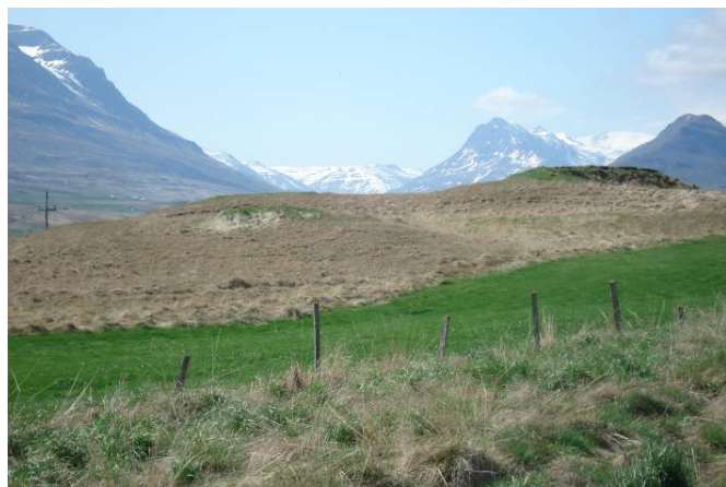
Glúmshóll (190:019a) til hægri og þústir (190:019b) fyrir miðri mynd

Hættumat: hætta, vegna vegagerðar Heimildir: KK III, 80; Árbók hins íslenska fornleifafélags 1924, 20 og Ö-Skrið, 81