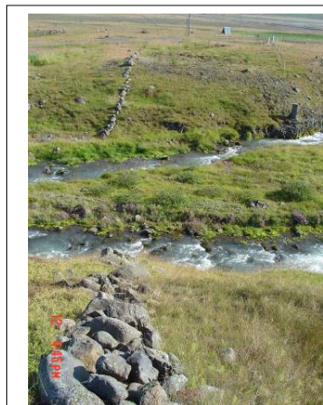
Garðlag (191:014), horft til suðurs