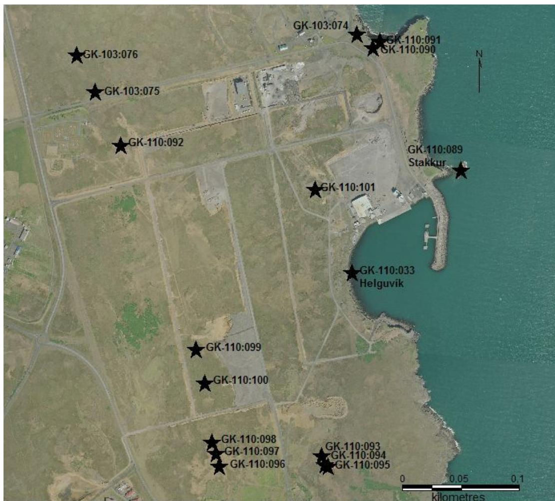
Kort af syðri hluta svæðisins.

GK-110:101 varða 64°01.431N 22°33.868V Varðan er um 530 m vestan við Stakksnef. Varðan er lítil, og að mestu hrúnin. Hún stendur á klettahól, þar sem talsvert rask hefur átt sér stað.