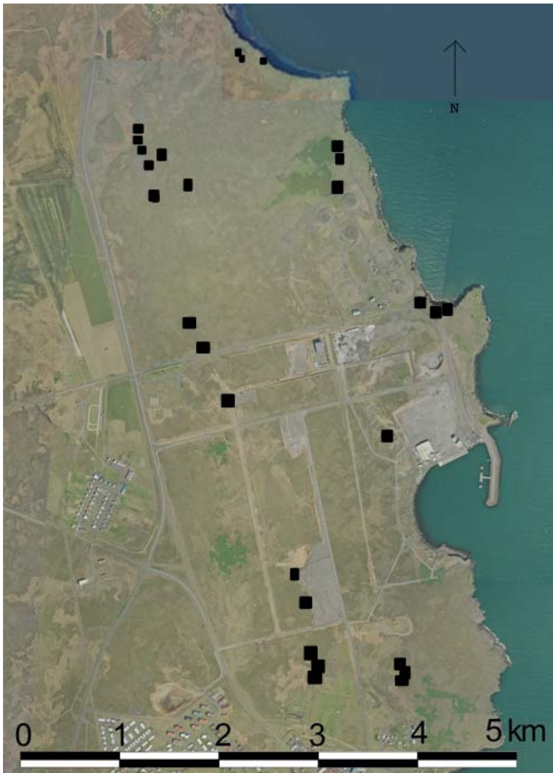
Kort yfir minjar hjá Helguvík.