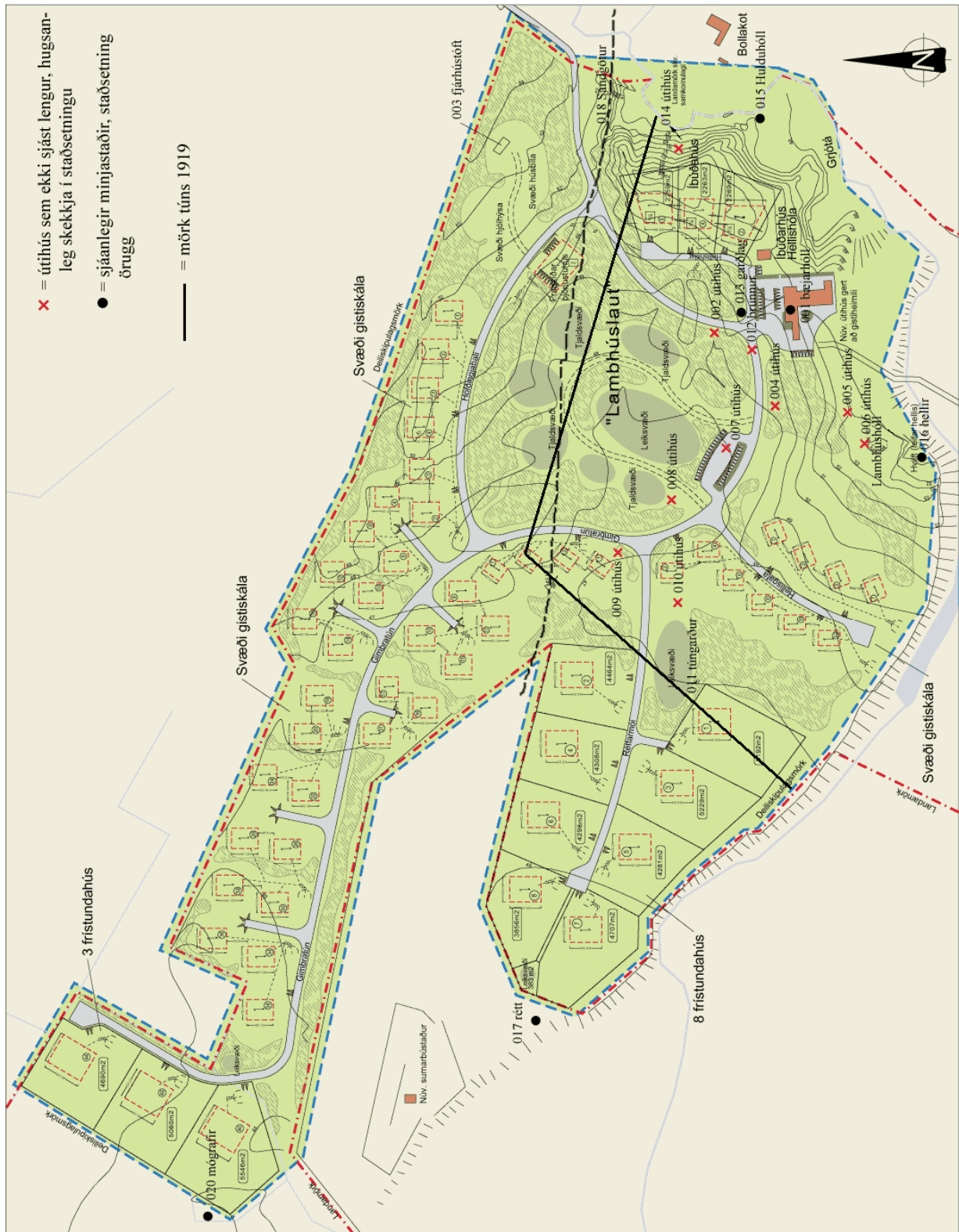
Deiliskipulagssvæði. Minjastaðir merktir inn á kort frá Landform.