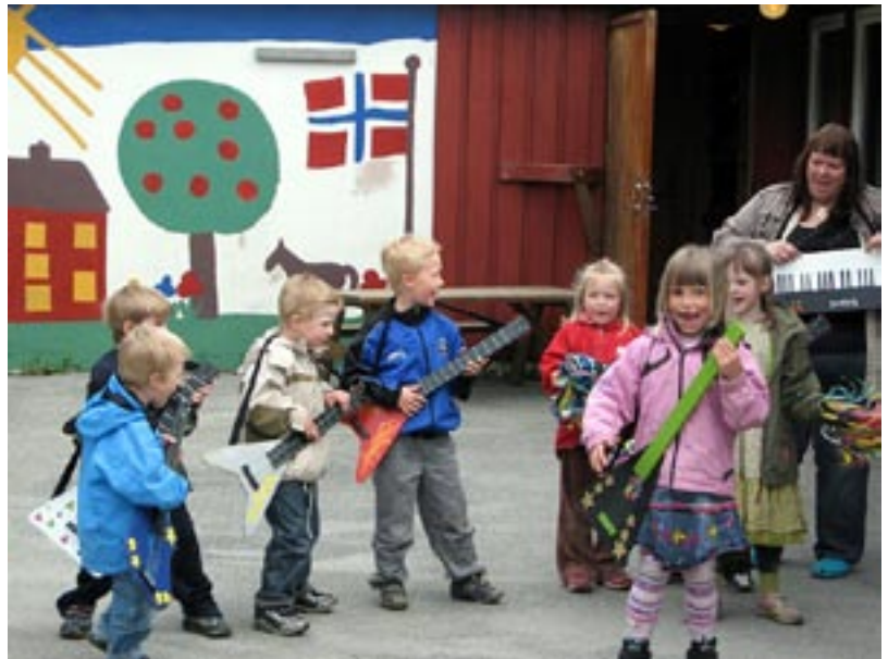
Verðlaunamyndin. Sameinaðir sem einn strengur – leikskólinn Njálshögur

Hér er hægt að skoða allar ljósmyndirnar sem bárust: www.ask.hi.is/page/ljosmyndasamkeppni