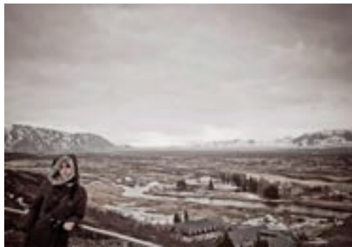
Framhaldsskólinn í Vestmannaeyjum