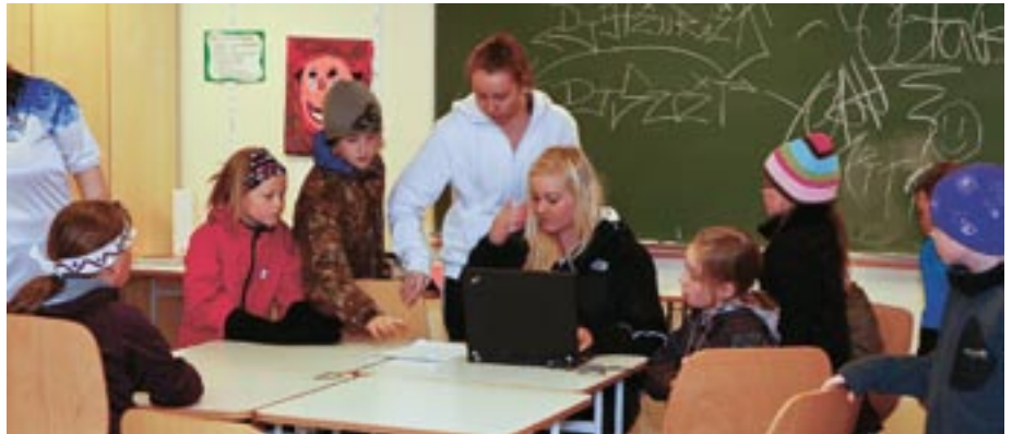
Menntun er æviverk og glötuð tækifæri verða ekki bætt upp síðar.

Ríki og sveitarfélög þurfa að vinna saman að heildaráætlun um skólastarf og menntun