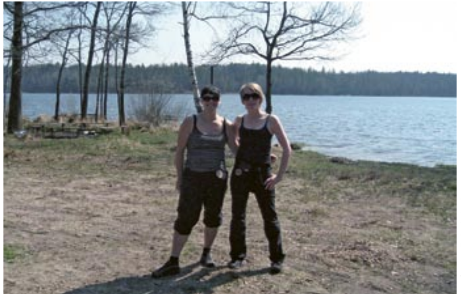
Ljósmyndir frá höfundum

Dagarnir okkar í Tékklandi skilja eftir ógleymanlegar minningar og aukna faglega og persónulega þekkingu og í ljósi þess hvetjum við alla kennara til að kynna sér Comenius 2 – endurmenntunarnámskeið fyrir kennara. Allar frekari upplýsingar má finna á comenius.is