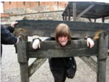
Góð leið til að aga nemendur! - Flensborg