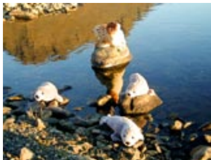
Selir - Lýsuhólsskóli