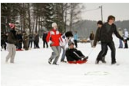
Survivor - Barnaskóli Vestmannaeyja