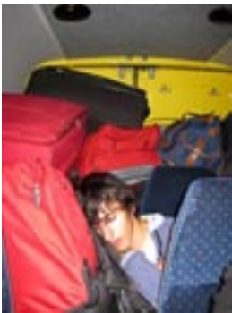
Á leið heim - Flensborg