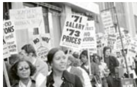
Kennarar í Detroit fóru í langt og biturt verkfall árið 1973 en ekkert slíkt er í auglýsingu hjá íslenskum kennurum um þessar mundir. Kennarar virðast frekar einfaldlega hætta og fara að gera eitthvað annað, með skelfilegum afleiðingum fyrir nemendur og menntakerfið í heild.

Í Félagi tónlistarskólakennara verður gengið frá kjöri í stjórn félagsins og til annarra trúnaðarstarfa á aðalfundi. Aðalfundurinn verður haldinn á Lækjarbrekku í Reykjavík 29. febrúar frá klukkan 9:30-12:30 en að honum loknum, eða klukkustund síðar, hefst trúnaðarmannafundur hjá félaginu. Í fundarboði til trúnaðarmanna segir meðal annars: „Fundurinn mun skarast við aðalfund FT, sem verður haldinn sama dag á sama stað, á þann veg að málstofa um faglegt efni stendur einnig aðalfundargestum opin. Að sjálfsögðu vonumst við einnig til að sem flestir trúnaðarmenn sjái sér fært að sitja aðalfund félagsins þar sem m.a. verður kosið í stjórn og nefndir til næstu þriggja ára.“ Málstofan sem um er rætt ber yfirskriftina Polifonia og fjallar um samefnt viðamikilið rannsóknarverkefni sem unnið er í samstarfi Samtaka evrópskra tónlistarháskóla og Tónlistarháskólans í Malmö. Markmið verkefnisins var meðal annars að kortleggja tónlistarskóla í Evrópu með tilliti til mismunandi kerfa og nálgana