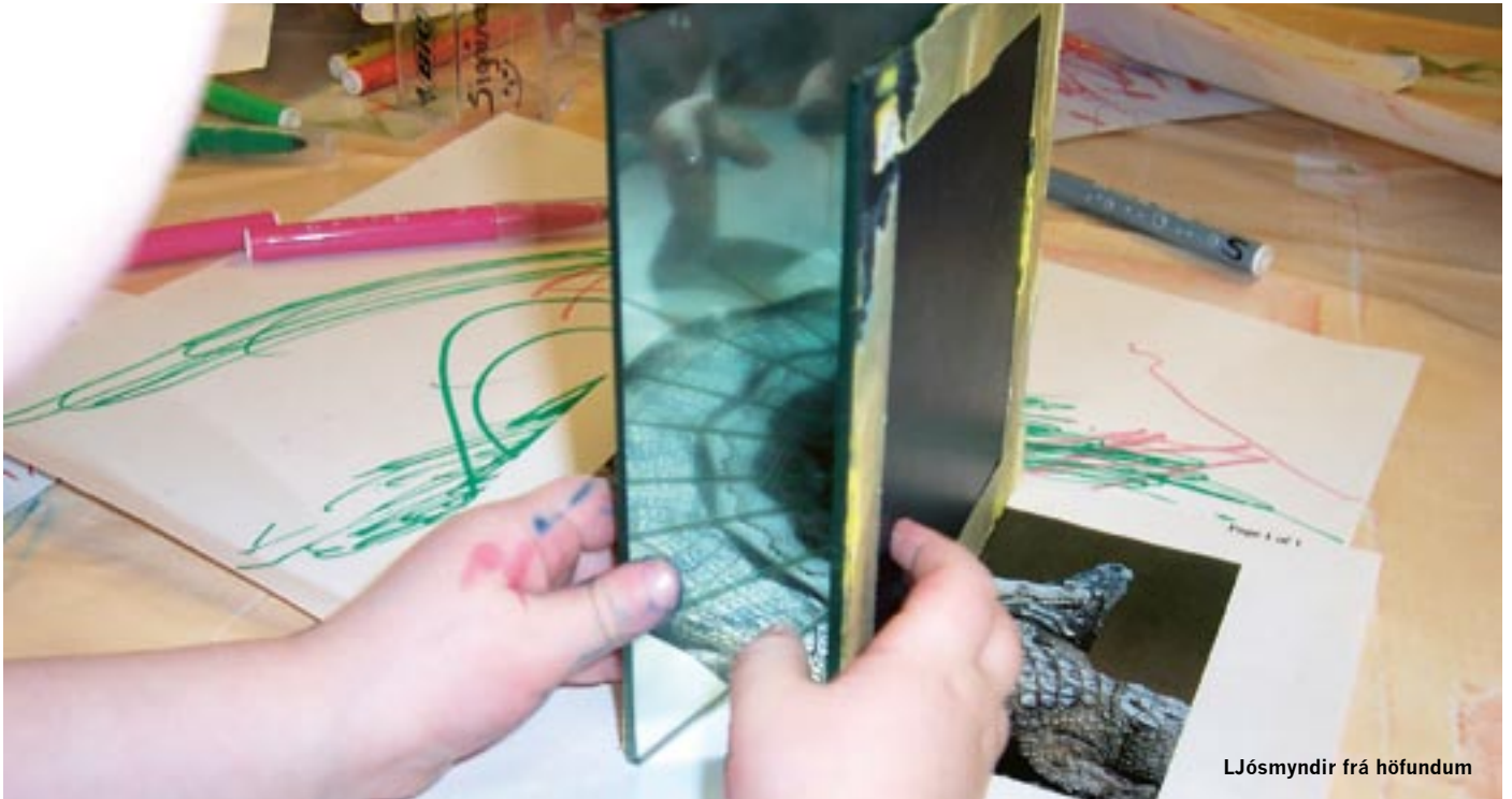
LJósmyndir frá höfundum