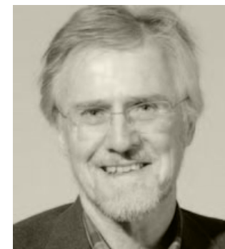
Gudmund Hernes er norsk sosiolog, forfatter og politiker (Arbeiderpartiet). Han er bl a tidligere kirke- uddanings-, forsknings-, og helseminister, tidligere direktør ved UNESCO International Institute for Educational Planning og gjesteprofessor ved Harvard University.

"We may still have time to reconsider our courses and to view the world with new eyes. For the immediate future events are taking charge, and the near destiny of Europe is no longer in the hands of any man. The events of the coming year will not be shaped by the deliberate acts of statesmen, but by the hidden currents, flowing continually beneath the surface of political history, of which no one can predict the outcome. In one way only can we influence these hidden currents, – by setting in motion those forces of instruction and imagination which change opinion. The assertion of truth, the unveiling of illusion, the dissipation of hate, the enlargement and instruction of men's hearts and minds, must be the means."