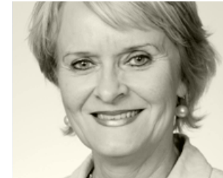
Valgerður Sverrisdóttir from Iceland is a member of the Allthing (Icelandic Parliament) for the Progressive Party and a former Minister of Foreign Affairs, Minister of Nordic Cooperation and of Trade and Industry.