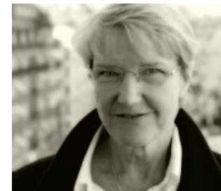
Kristina Person är grundare och arbetande ordf. för tankesmedjan Global Utmaning samt senior advisor till European Policy Center i Bryssel. Hon har varit ledamot av den svenska Riksdagen och Europaparlamentet samt landshövding i Jämtland. 2001-07 var hon vice riksbankschef.

Med denna skrift vill vi bidra till att diskussionen om behovet av samarbete över landsgränserna, demokrati och ledarskap kommer igång. Den kommer att behövas under många år framöver.