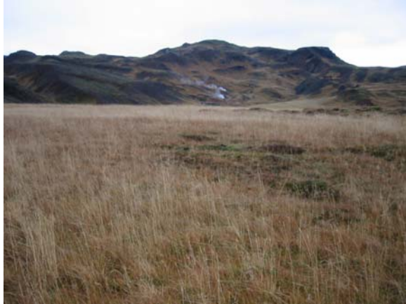
myndi 1.2 Horft norður að Rjúpnabrekku

Vatnsverndarsvæði . Vestan við skipulagssvæðið er grannsvæði vatnsverndar og skal uppbygging á svæðinu taka mið af því.