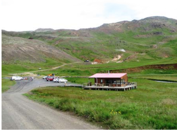
mynd 1.4 – núv. þjónustuhús, Dalakaffi.

Búið er að kanna byggingarhæfi m.t.t. jarðvegs og skuggavarps fyrir svæðið. Á staðnum verður kannað hvar hentug svæði eru fyrir tjaldsvæði, m.t.t. hversu slétt undirlagið er, skjóls ofl. Staðsetning bílastæða, þjónustuhúss, stíga ofl. verður einnig metin á staðnum út frá landslagi.