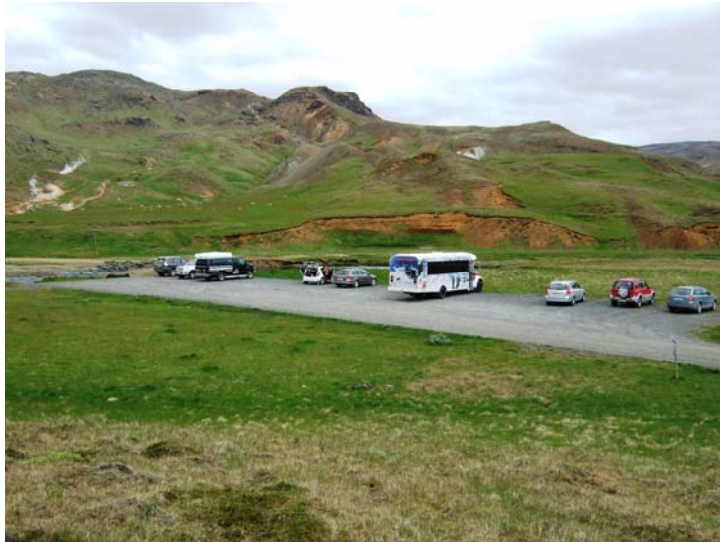
mynd 1.3 - núverandi bílastæði við Varmá sem verður fjarlægt en göngustígur þar sem vegur er.

Mörkuð verður lóð fyrir þjónustumiðstöð og innan hennar verður leyfilegt að byggja hús sem rúmar upplýsingamiðstöð, veitingaaðstöðu og salerni. Þjónustumiðstöðinni er m.a. ætlað að þjóna göngufólki og öðrum gestum sem leið eiga í Dalinn eða dalina innan við hann.