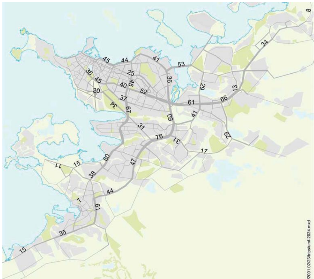
Mynd 4-1 Umferð árið 2024 miðað við 228 þúsund íbúa á höfuðborgarsvæðinu. Heimild: nesPlanners, 2002.

Eftirfylgni: Í heild er mikilvægt að gera reglulega umferðarpár sem byggja m.a. á uppfærðum tölum um ferðavenjur höfuðborgarbúa og þróun byggðar. Með því móti er hægt að meta hver þessi áhrif kunna að verða og umfang þeirra og hvernig mögulegt er að bregðast við.