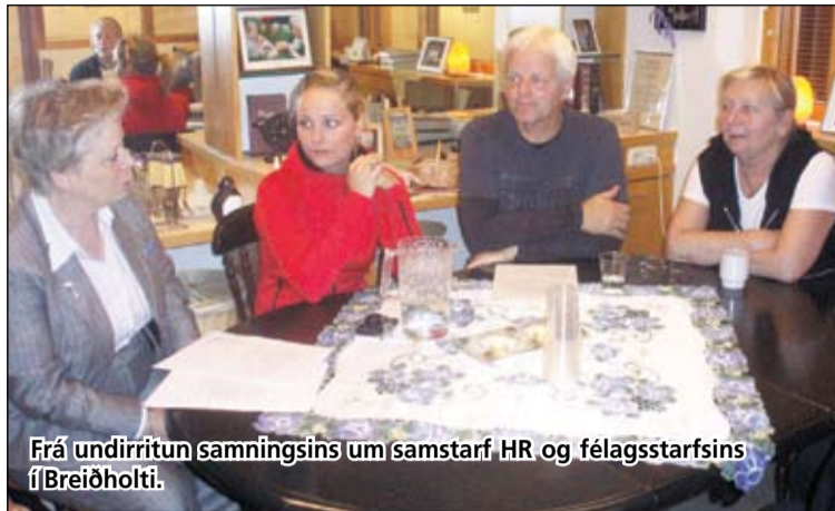
Frá undirritun samningsins um samstarf HR og félagsstarfsins í Breiðholti.

Íþróttafræðinemarnir munu kynna sér íþrótta- og félagsstarf í hverfinu ásamt því að sjá um kenningu í fjölbreyttri hreyfingu sem boðið er upp á. Þá munu nemarnir vinna með starfsfólki félagsstarfsins í Gerðubergi og Árskógum 4 að ýmsum verkefnum sem ætlað er að efla það íþrótta- og félagsstarf sem í boði er í hverfinu. Með slíku samstarfi öðlast nemarnir dýrmæta reynslu af starfi á vettvangi og hverfið nýtur um leið krafta þeirra til heilla fyrir þátttakendur í félagsstarfinu og hverfið í heild. Fyrr á árinu var undirritaður samstarfssamningur á milli íþróttafræðinema Háskólans í Reykjavík og Þjónustumiðstöðvar Breiðholts og er þessi samvinna afrakstur af þeim samningi.