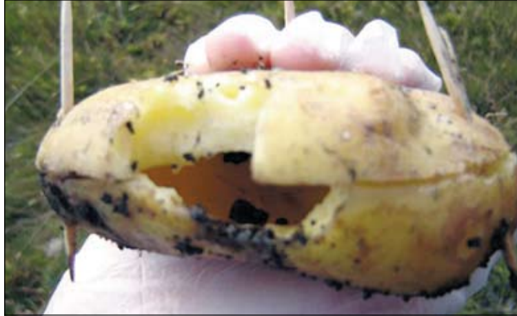
Kartöflugildra sem notuð var við að veiða smádýrin.

Einnig tókst að fanga geitunga og skoða þá í víðsjá til frekari greiningar. Nemendur vinna að greiningu með aðstoð tækja og greiningarlykla og skila greiningargerð. Líf og fjör var við öflun og greiningu, sér í lagi vóktu geitungarnir athygli en þess má geta að tveir nemendur urðu fyrir lítils-háttar stungu.