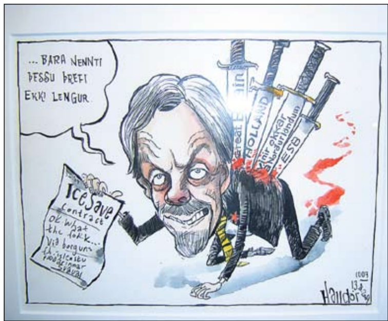
Svavar Gestsson, fyrrverandi ráðherra og sendiherra koma heim með Icsave samninginn umdeilda

með jákvæða hegðunarmótun og muni það fyrirkomulag nú ná til alls skólans. Sérstakar kynningar verða fyrir foreldra í tengslum við þá foreldrafundi sem hefðbundið er að boða á haustdögum. Breytingar hafa verið gerðar á stundatöflu og tekin upp morgunstund fyrir þá nemendur í 1. til 4. bekk sem þurfa vegna vinnu foreldra sinna að mæta um átta leitið en kennsla hefst hjá nemendum í þessum árgöngum kl. 9:00 en hjá öðrum kl. 8:10. Gefinn hefur verið út sérstakur afmælisbæklingur þar sem stiklað er á stóru í sögu skólans. Það er ósk skólans að sem flestir sjái sér fært að koma í skólann þennan dag, ekki síst foreldrar og fyrrverandi nemendur og starfsfólk ásamt öðrum velunnurum skólans.