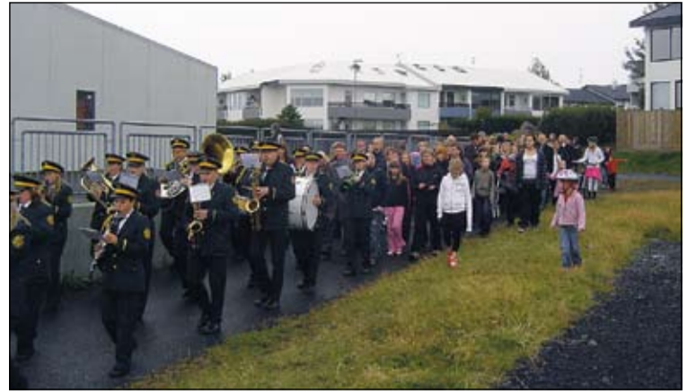
Skrudgangan á leið í gegnum Seljahverfið. Forvitinn vegfarandi með reiðhjólahljalm fylgist með.