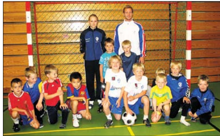
Yngir krakkar í handboltaskólanum ásamt skólalæranum.