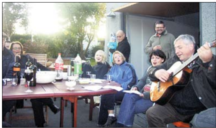
Árni Johnsen með gítarinn að vanda og brekkulögin hljómuðu um Rithólana í haustblíðunni.