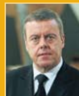
Þorsteinn Elísson útfararþjónusta