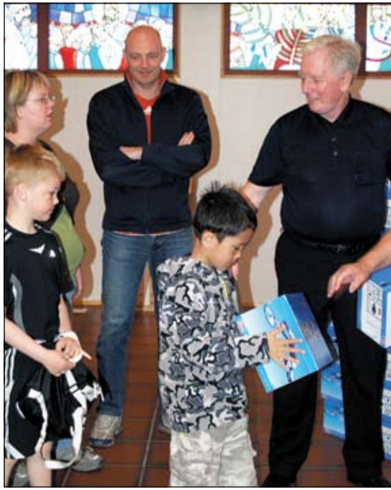
Vissara að skoða vel.