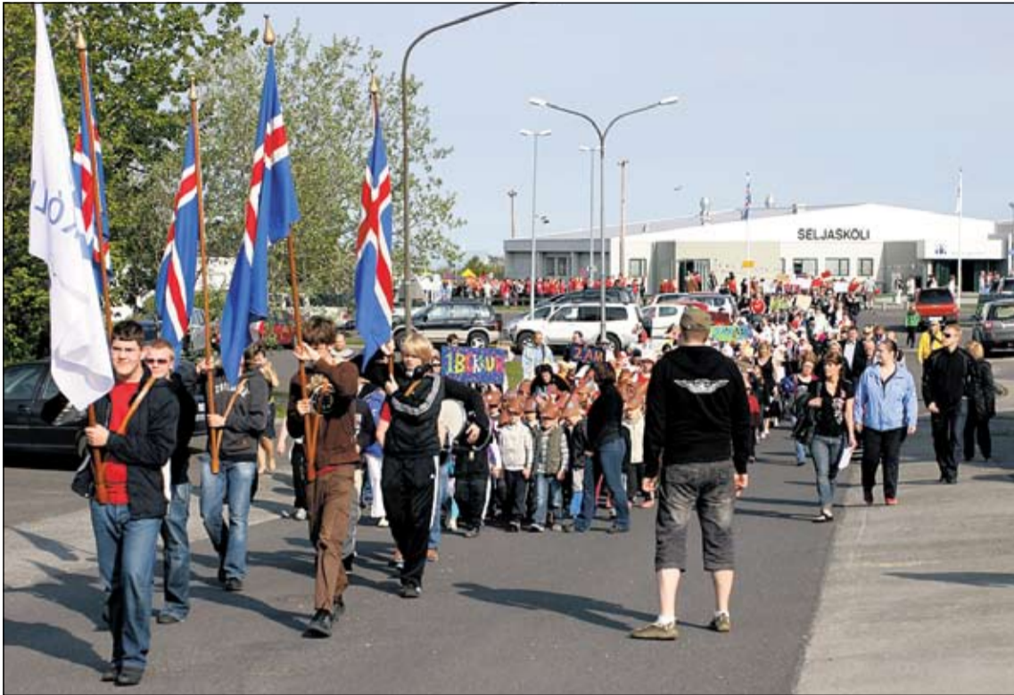
Nemendur og kennarar hófu daginn með skrudgöngu um hverfið.

Mikið var um að vera þegar Seljaskóli hélt uppá 30 ára afmæli sitt 4. júní. Dagskráin hófst kl. 9.15 með skrudgöngu um hverfið þar sem hver árgangur var með sitt sér-einkenni í göngunni, grímur, sóglæraugu, derhúfur, litað hársprey og boli ásamt fleiru.