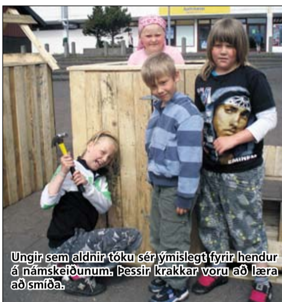
Ungir sem aldnir tóku sér ýmislegt fyrir hendur á námskeiðunum. Þessir krakkar voru að læra að smíða.

Það sem athyglisvert er við þetta námskeiðshald er að leiðbeinendur á námskeiðunum voru að mestu eldri borgarar. Um er að ræða tilraunaverkefni til að tengja saman eldri og yngri kynslóðir þar sem markmiðið er að miðla gömlum gildum og þekkingu frá hinum eldri til hinna yngri. Á undanförunum árum hefur verkefnið kynslóðirnar saman verið til staðar í Breiðholtinu þar sem börn og eldri borgarar hafa átt sameiginlegar stundir. Nú er farið skrefinu lengra í þessu starfi og efnt til námskeiðshalds þar sem hinir eldri miðla þeim yngri af þekkingu sinni og reynslu. Námskeið voru haldin í félagsstarfinu í Gerðubergi dagana 8. til 12. júní og 15. - 19. júní. Segja má að hugtakið "ungur nemur gamall temur" hafi verið í hávegum í Gerðubergi þessa júnídaga.