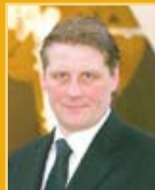
Svafar Magnússon útfararþjónusta