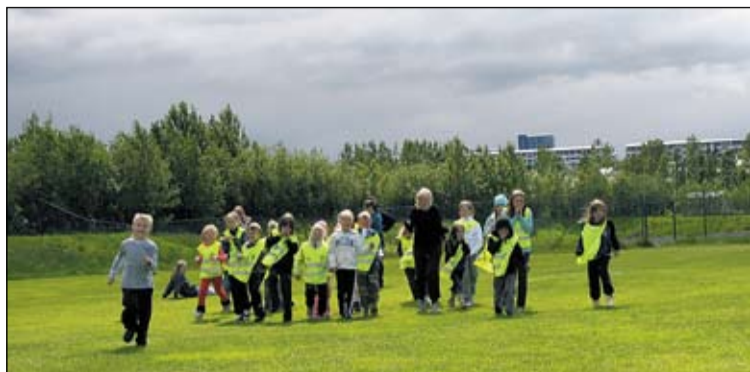
Frá leikjanámskeiði á síðasta sumri.

Veðrið hefur sómuleiðis leikið við börnin og leiðbeinendur þeirra sem njóta útiverunnar í nágrenni ÍR-heimilisins til að fara í leiki og íþróttir. Við viljum hvetja ykkur til þess að skrá börn ykkar með góðum fyrirvara svo það sé öruggt að þau komist á þessi skemmtilegu námskeið okkar.