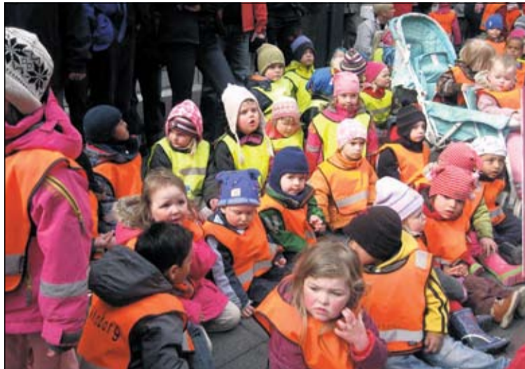
Leikskólabörn úr Bakkahverfinu í göngugötunni í Mjóddinni á opunardaginn.

Í frétt frá leikskólunum segir að á sýningum sem þessum komi glögg fram hversu hugarheimur barna er margslunginn þótt þau eigi ekki alltaf orð til að lýsa honum. Mörg börn á leikskólaaldri hafa ríka þörf fyrir að tjá sig á skapandi hátt hvort sem er í máli eða myndmáli. Fjölbreytileg myndgerð og myndsköpun skipi veglegan sess í uppeldisstarfi leikskólans og tengist öðrum þáttum þess með ýmsum hætti. Með því að gera myndlist leikskólabarna sýnilega sé verið að gefa börnunum rödd í samfélaginu. Á opunarhátíðinni lék Lúðrasveit Árbæjar og Breiðholts nokkur lög og leikskólabörnin og gestir sungu. Bakameistarinn í Mjódd bauð gestum á opunarhátíðinni upp á veglega skúffuköku og Nettó í Mjódd gaf börnunum drykk. Auk leikskólanna í Bökkunum komu hverfisráð Breiðholts, Skólahljóm-sveit Árbæjar og Breiðholts, Ráðhús Reykjavíkur, ÍTR og Þjónustumiðstöð Breiðholts að undirbúningi og framkvæmd.