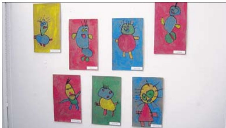
Nokkur myndverka barnanna á sýningunni.