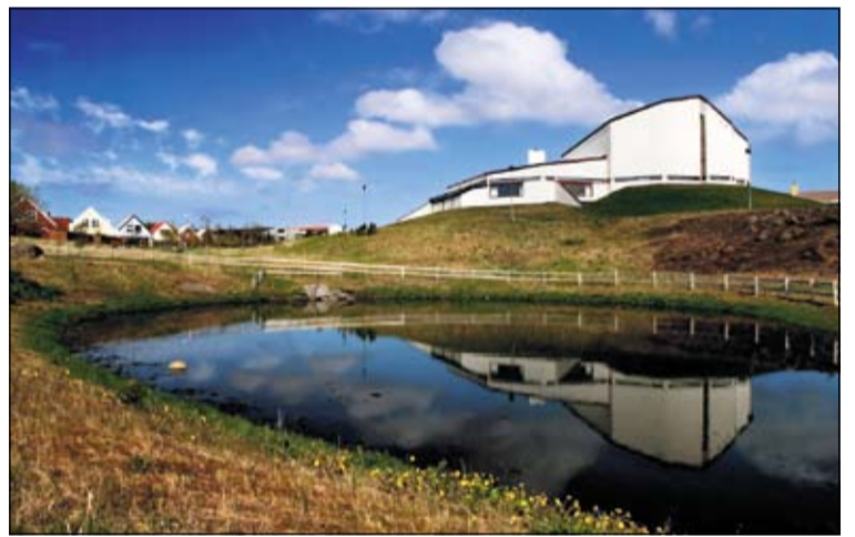
Fella- og Hólakirkja.