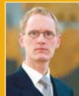
Frímann Andrésson útfararþjónusta