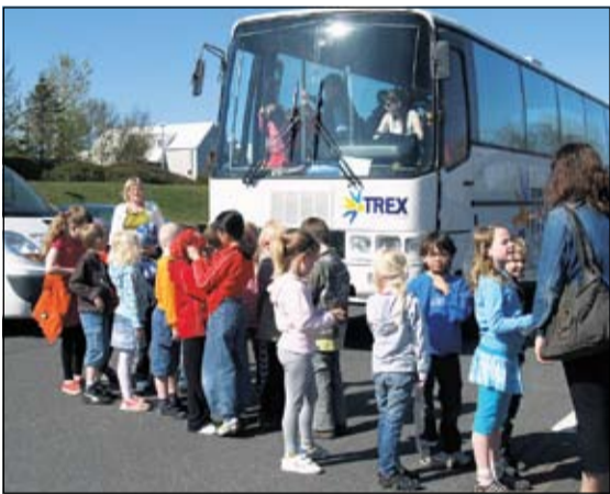
Börn koma í rútu að Seljakirkju.