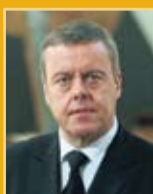
Þorsteinn Elísson útfararþjónusta