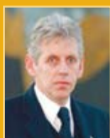
Guðmundur Baldvinsson útfararþjónusta