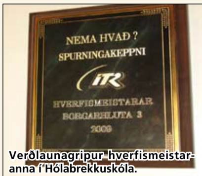
Verðlaunagripur hverfismeistaranna í Hólabrekkuskóla.