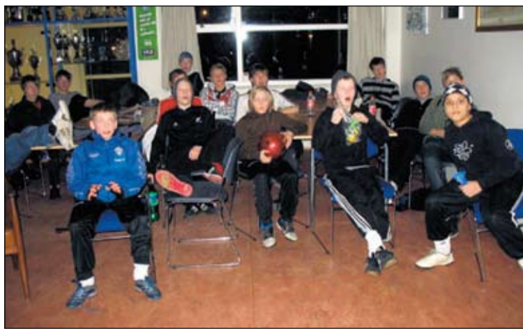
Mynd tekin þegar Real Madrid og Liverpool áttust við.

Á þriðjudögum hafa svo vaskir göngugarpar tekið göngutúr um hverfið. Knattspyrnuáhugamenn og konur og horfðu á Meistaradeildina í síðustu viku og var mikil stemming og hvöttu menn sín lið. Við bjóðum fólki til þess að koma til okkar á morgnanna og nýta sér aðstöðu okkar þ.e. íþróttasal o.þ.h. Við hvetjum alla til þess að kíkja inná heimasíðu