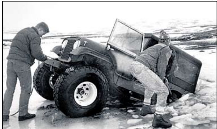
Fyrsta jeppaferðin. Vorum búnir að brjóta drifskaf og öxla og það þurfti að draga farkostinn heim. Hér er verið að undirbúa að ná Willys jeppanum upp úr ánni.