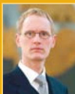
Frímenn Andrésen útfararþjónusta