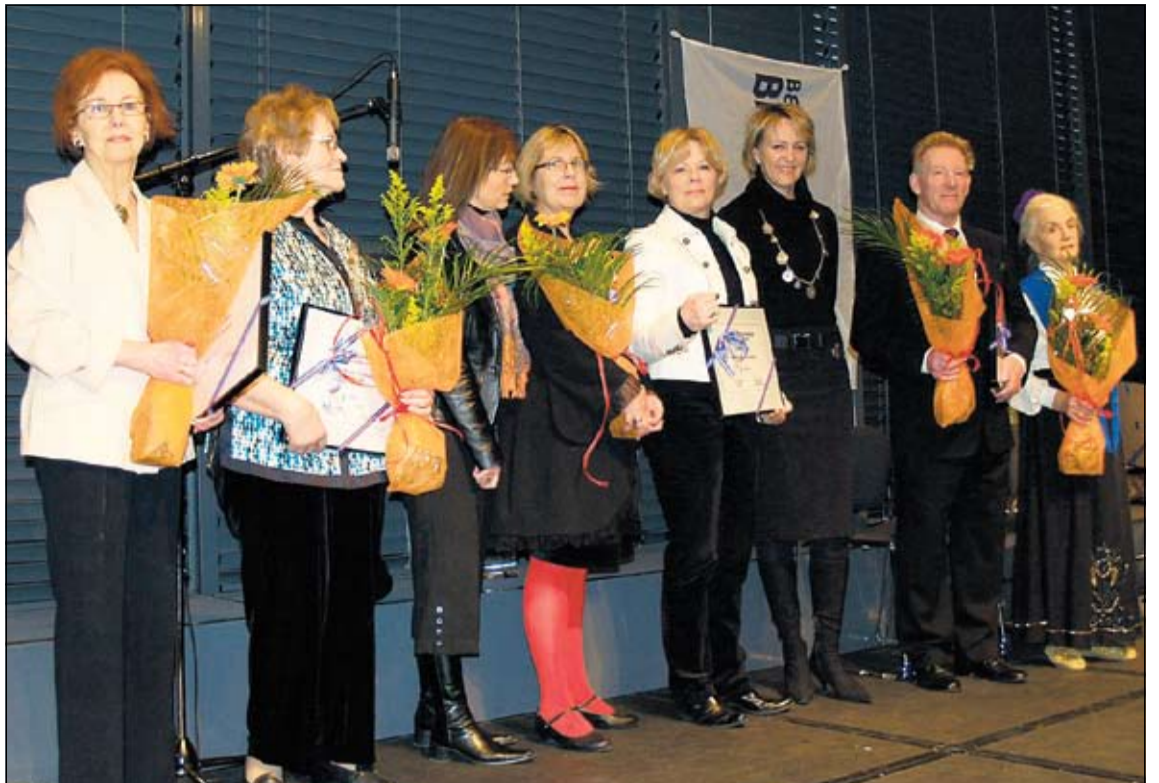
Frá afhendingu heiðursviðurkenninganna.