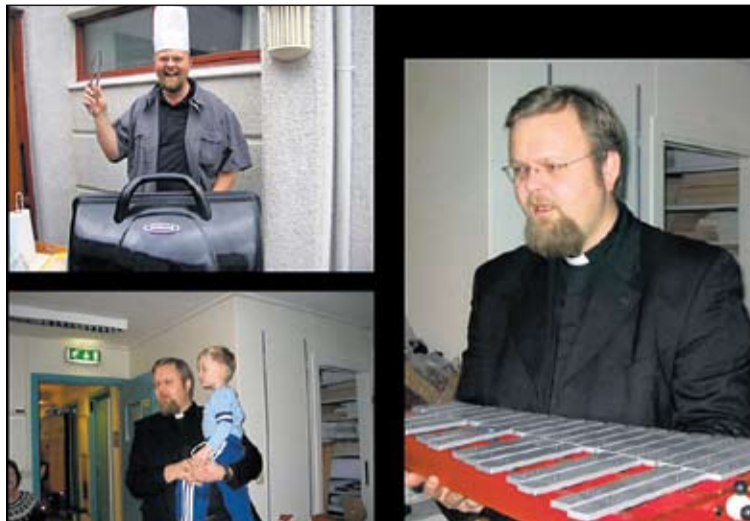
Prestsstarfið getur verið fjölbreytt.