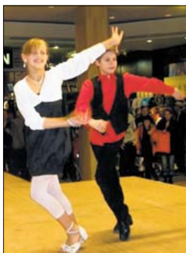
Módel frá Dansskóla Hafnarfjarðar sýna í Garðheimum.