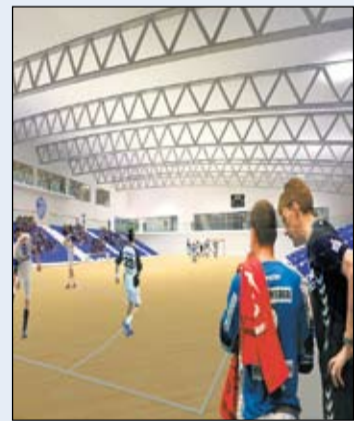
Inná heimasíðu ÍR má sjá vinn- ingstillöguna.

Mikil og góð umræða var eftir kynninguna og er greinilegt að fólk bíður spennt eftir því að fá hér íþróttahús sem sinnir þörfum okkar ÍR-inga. Ekki er komið á hreint hvenær framkvæmdir hefjast en hönnunartíminn er í fullum gangi.