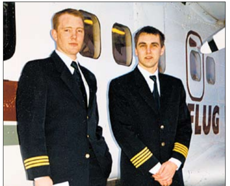
Komin með fjórar strípur. Flugstjóri á Dornier vél Íslandsflugs í innanlandsflugi ásamt aðstoðarflugmanni. Vélin var í leigu til Mýflugs og var myndin tekin í tilefni þess að tveir flugmenn frá Mýflugi flugu Íslandsflugsvél í fyrsta skipti.

Þótt ég hætti að fara í sveitina þá kynnst ég sumrunum í Seljahverfinu ekki mikið. Ég var eitt sumar heima en þá sagði mamma að ég yrði ekki meira heima á sumrin. Hún munstraði mig á skip og ég sigldi hjá Eimskipi í þrjú sumar. Á þessum árum var ég