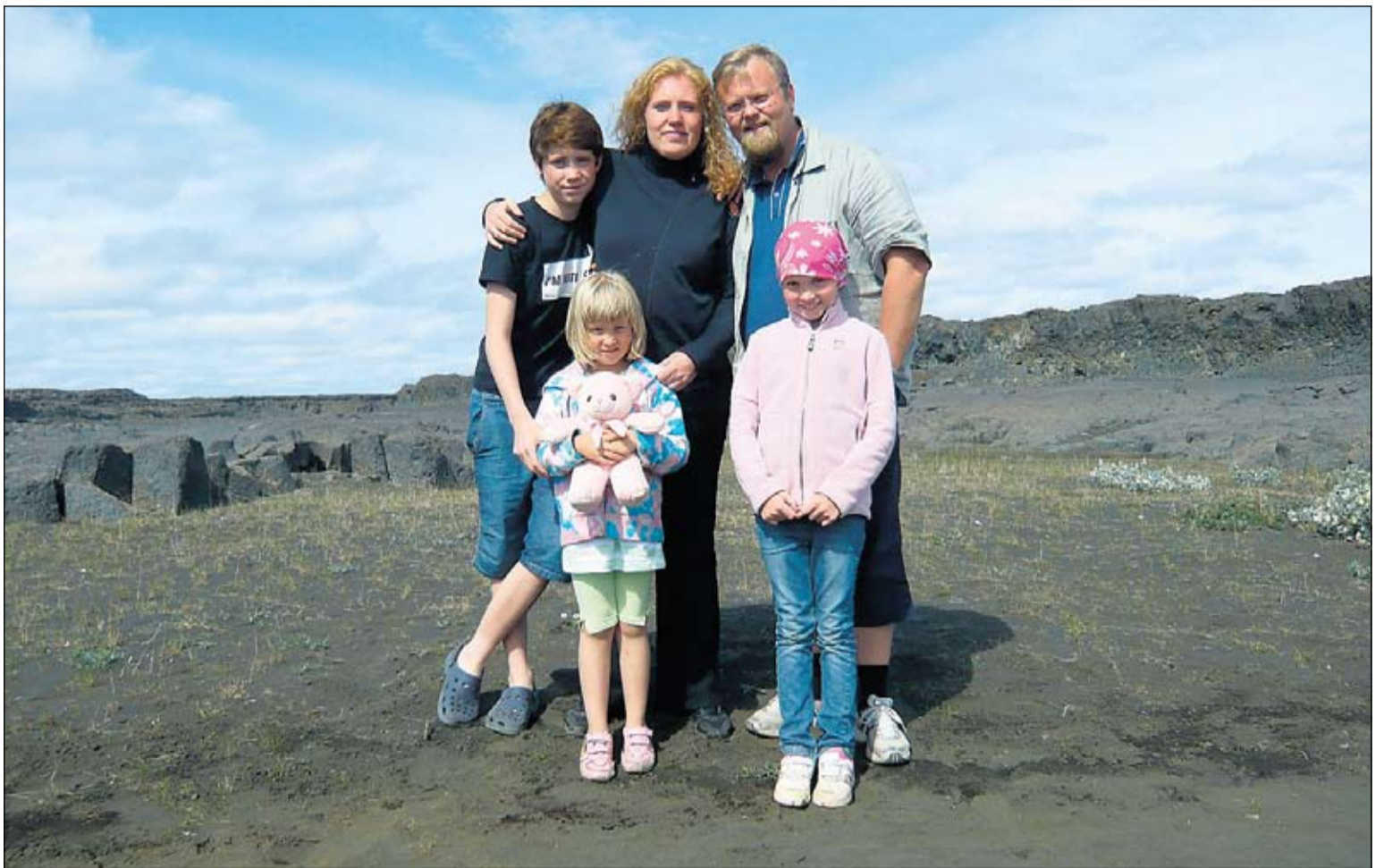
Með fjölskyldunni á ferð á Norðurlandi