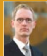
Frímánn Andrússon útfararþjónusta