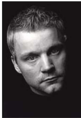
Denni í dag.

að gera þessa viðburði sem glæsilegasta og segja má að botninum í því hafi verið náð þegar við stálum jólaseríu af tréi úr einhverjum garðinum í Stekkjunum. Það var ekki fallega gert, en serían tók sig svakalega vel út á trommusettinu.