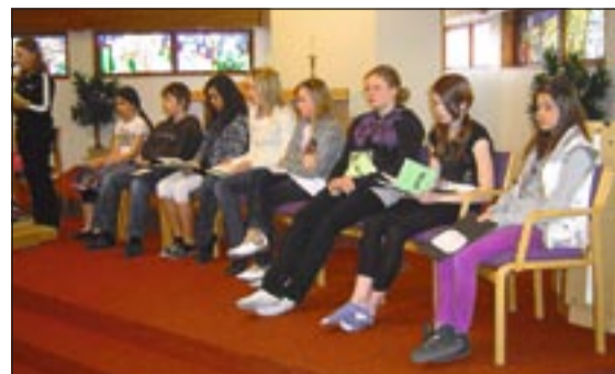
Hluti keppenda á lokahátíðinni í Seljakirkju.

Þessar myndir voru teknar í Seljakirkju á meðan upplesturinn fór fram. Það eru Raddir, samtök um vandaðan upplestur og framsögn sem standa að stóru upplestrarkeppninni og fór lokahátíðin fram á 32 stöðum að þessu sinni.