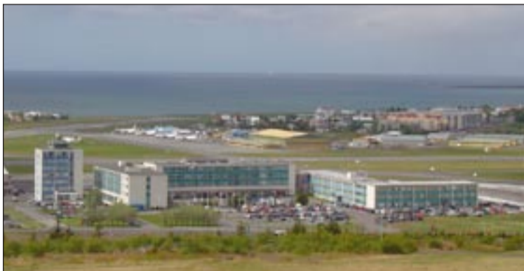
Séð yfir hluta Vatnsmýrarinnar og Reykjavíkflugvallar.