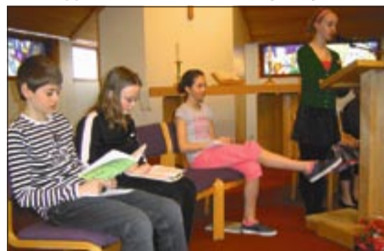
Keppendur bíða á meðan einn þeirra les úr Bardaganum við Bjarndýrið eftir Nonna.