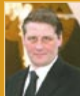
Svafar Magnússon útfararþjónusta