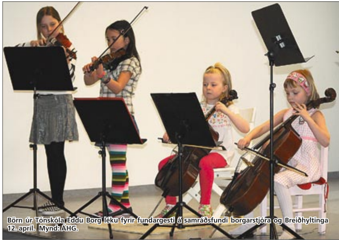
Börn úr Tónskóla Eddu Borg léku fyrir fundargesti á samráðsfundi borgarstjóra og Breiðhýltinga 12. apríl.