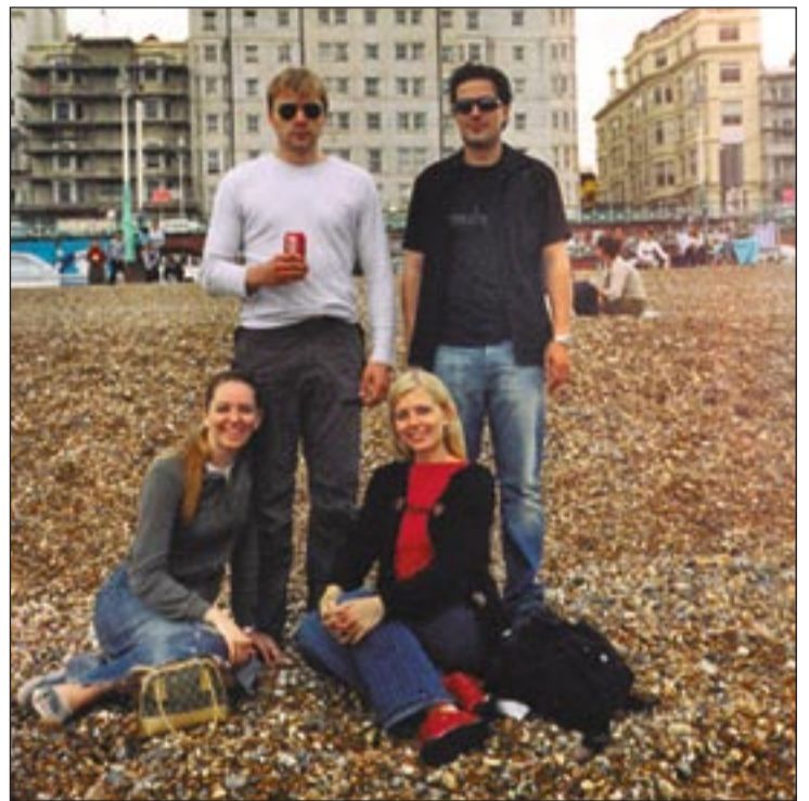
Með skólasystkinum á leiklistarnámsárum í Bretlandi.