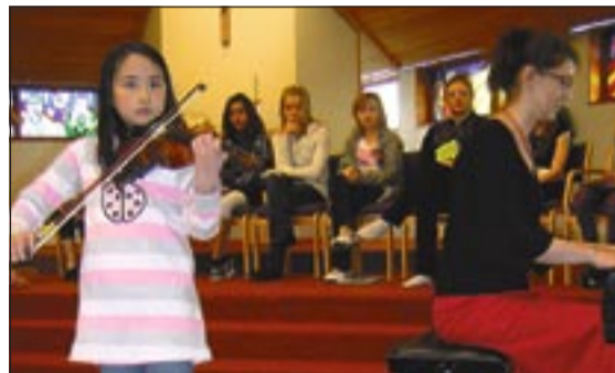
Tónlistaratriði voru á milli upplesturs og þessi unga stúlka lék á fiðlu.