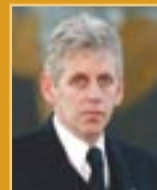
Guðmundur Baldvinsson útfararþjónusta