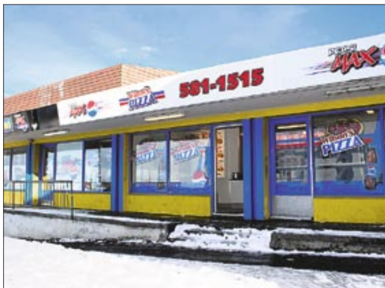
Wilsonspizza í Eddufellinu á sama stað og Bónusvídeó.