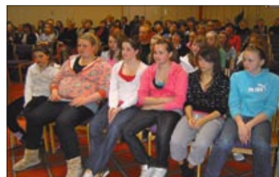
Þétt setnir áheyrendabekkir í Seljakirkju.