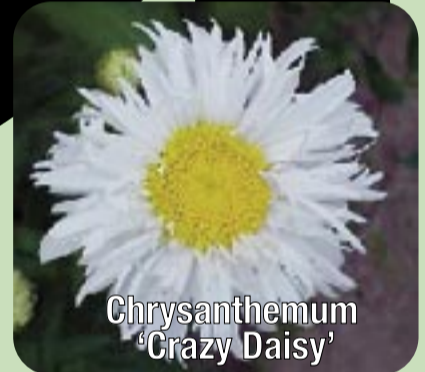
Chrysanthemum 'Crazy Daisy'