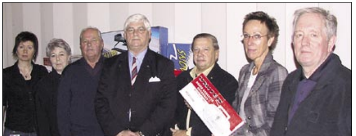
Elliðafólk sem færði Barna og unglíngageðdeildinni gjöfina.

kiwanisklúbbnum Elliða búi því miður ekki yfir töframætti Álfkonunnar góðu, en það er hugsanlegt að þeir og vonandi einhverjir fleiri geti komið í hennar stað og séð til þess að þessi nauðsynlega stofnun fái að njóta sannmælis.