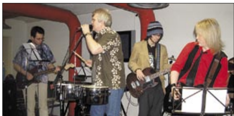
Kennara/nemendahljómsveitin Rock off lék sígild rokklög fyrir nemendur, en í hljómsveitinni eru þrír kennarar og þrír nemendur.

Nemendur skráðu sig í hóp á sælundögum alfarið í gegnum tölvukerfi sem nemendur á Upplýsinga- og tæknibraut skólans bjuggu til og ljóst að nemendur geta unnið að raunhæfum, erfiðum og áhuga-verðum verkefnum. Að loknum sælundögum tekur svo hversdagsleikinn við. Sælundagarnir eru fastur punktur í tilveru nemenda á vorin og kærkomin tilbreyting í skólalastarfinu.