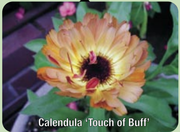
Calendula 'Touch of Buff'