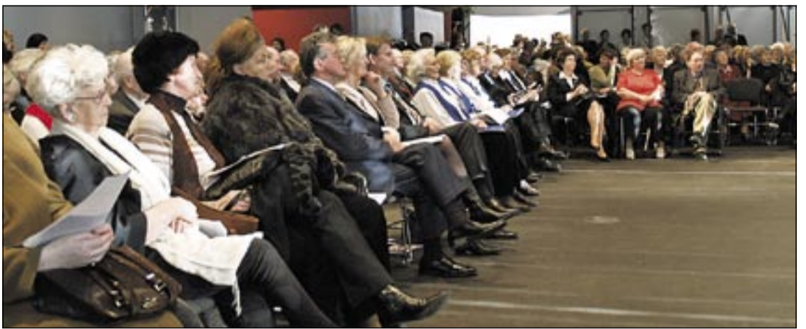
Eldri borgarar á fremsta bekk á menningarhátíð eldri borgara í Ráðhúsinu.

úr Ölduselsskóla gegn eldri borgurum í Boccia og skemmtidagskrá fór fram í Hólabrekkuskóla með þátttöku yngri sem eldri í söng, dansj og öðrum skemmtiatriðum. Á þriðja degi bar hæst hátíð með 500 leikskólabörnum og eldri borgurum í Austurbergi þar sem sungið var og dansað. Franski sendiherrann og frú Vigdís Finnbogadóttir sungu á frönsku með hópnum en hátíðin var hluti af upphafs dagskrá franskra menn-