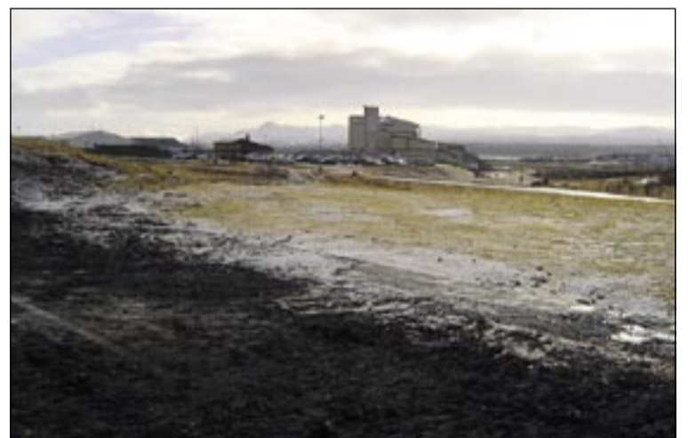
Séð frá lóðinni þar sem skátaheimilið stóð austan Gerðubergs í átt að Fella- og Hólakirkju yfir það svæði sem rætt er um til bygginga þjónustuíbúða.

verið hefur í gangi og byggist á því að ungmenni og eldri borgarar koma saman og eiga með sér góðar stundir og einnig það verkefni okkar að fá fólk sem býr við mikla félagsleg einangrun til þess að koma og deila geði með