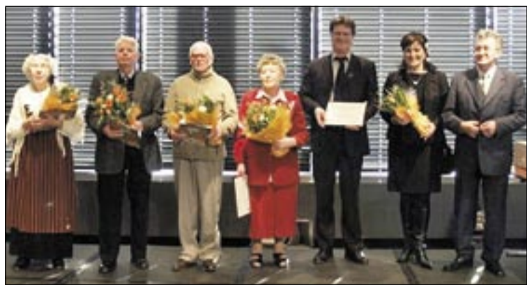
Verðlaunahafarnir á sviði í Ráðhúsi Reykjavíkur ásamt Gunnari Eyjólfssyni heiðursgesti hátíðarinnar.

Menningarhátíð eldri borgara sem haldin var í annað skipti dagana 21. til 25. febrúar s.l. þótti takast mjög vel. Fyrsti dagur hátíðarinnar var tileinkaður íþróttum og hreyfingu og var hápunktur þess dags íþróttahátíð í Austurbergi með þátttöku um 600 eldri borgara sem sýndu glæsileg tilþrif í íþróttum.