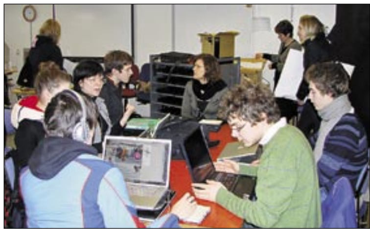
Nemendur voru mjög ánægðir á Sælundögum FB og tóku þátt í ýmsum hópastarfi.