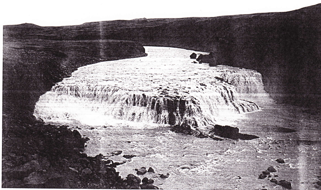
Fossinn Nefji í Köldukvísl