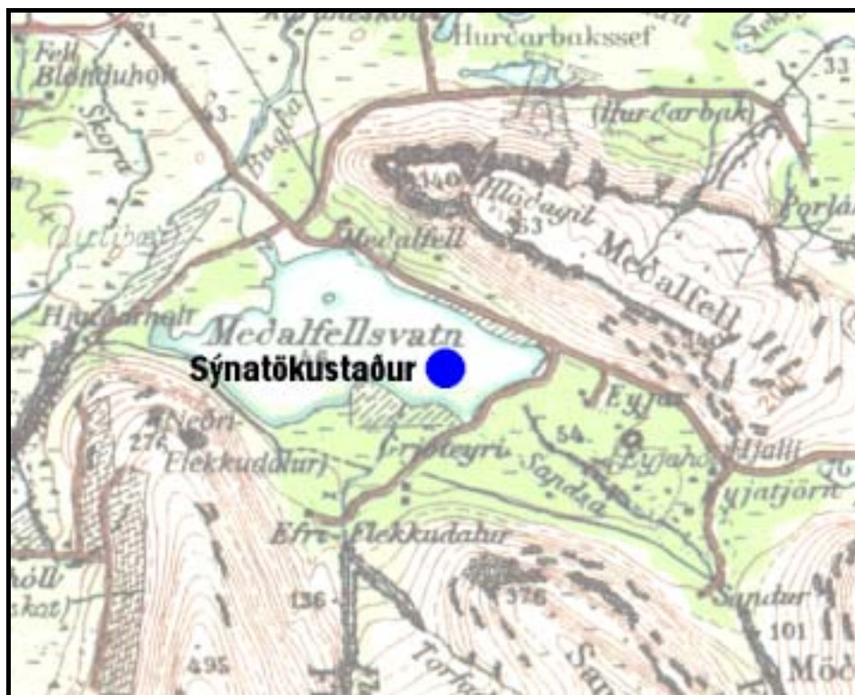
Mynd 1. Sýnatökustaðurinn í Medalfellsvatni. Staðarákvörðun hans er \text{N}64^\circ18,570' , \text{V}21^\circ35,016' .

Aðalsýnatökustaður var valinn sem næst dýpsta hluta vatnsins (mynd 1). Sýnataka utan vaxtartímans var hinsvegar gerð frá landi nálægt útrennslinu úr vatninu.