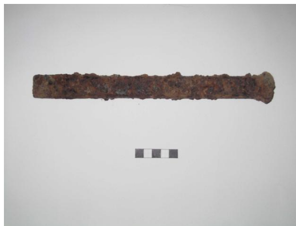
Gripur nr. 3 Meitill