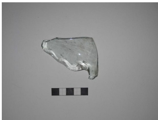
Gripur nr. 9 Flöskubrot