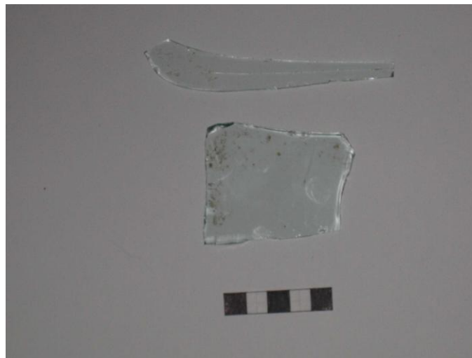
Gripur nr. 14 og 15 Rúðugler