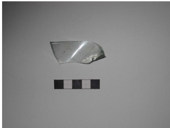
Gripur nr. 10 Flöskugler