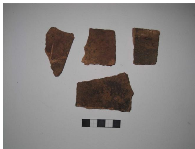
Gripur nr. 22, 23 og 24 Rauður múrsteinn