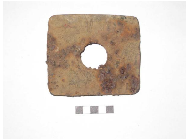
Gripur nr. 4 Járnstykki