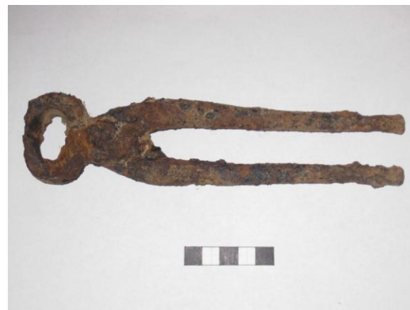
Gripur nr. 2 Naglbítur