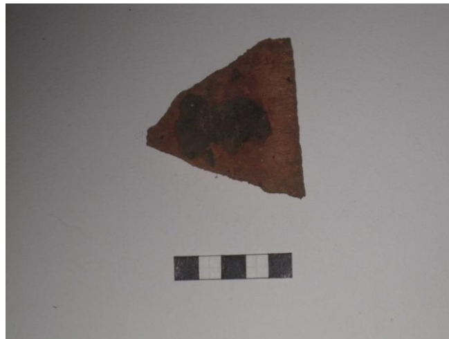
Gripur nr. 21 Rauður múrsteinn