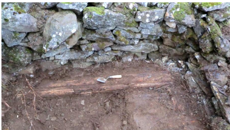
Mynd 2. Gólfbitar voru í húsinu og yfir þeim mjög morkinn linoleumdúkur. Eldavél hefur líklega staðið þarna í horninu.

Ákveðið var að grafa í gólfið til að komast að því hvaða tilgangi húsið hefur þjónað. Efst var gólfið mosavaxið og nokkurt hrun úr veggjum á gólfinu. Í ljós kom að þetta hús hafði trégólf því að stórir bjálkar voru út við alla vegg og í miðju gólfinu. Ofan á bitunum var svo mjög fúinn linoleumdúkur. Í einu