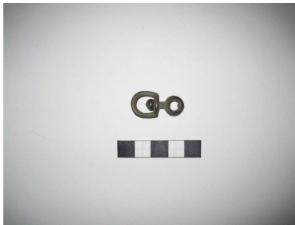
Gripur nr. 7 Segulnagli