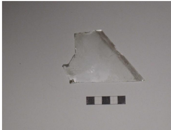
Gripur nr. 13 Rúðugler