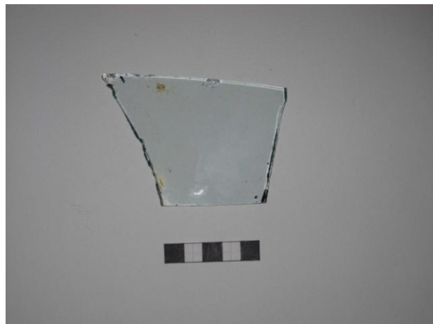
Gripur nr. 11 Rúðugler