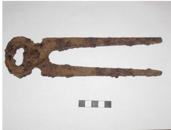
Gripur nr. 1 Naglbítur