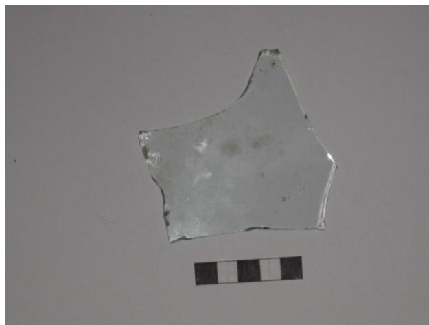
Gripur nr. 12 Rúðugler