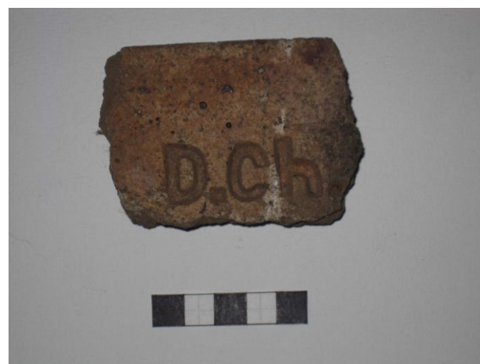
Gripur nr. 17 Múrsteinn