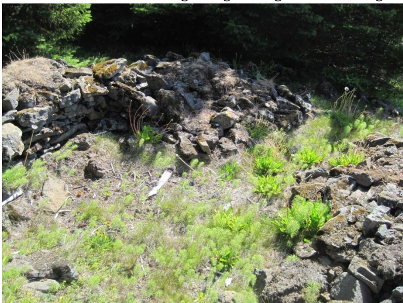
Mynd 1 Húsið áður en grafið var í það.

Byrjað var á því að teikna inn rústina og garðlagið en ekki reyndist hægt að mæla garðinn inn með Trimble-mælitækjum vegna þess hve skógurinn er þéttur. Ekki var hægt að komast inn í skóginn nema við jaðra svo hugsanlegt er að fleiri minjar séu innan garðsins, en ekki verður hægt að komast að því nema að höggva niður öll tré sem eru 5-10 metrar á hæð.