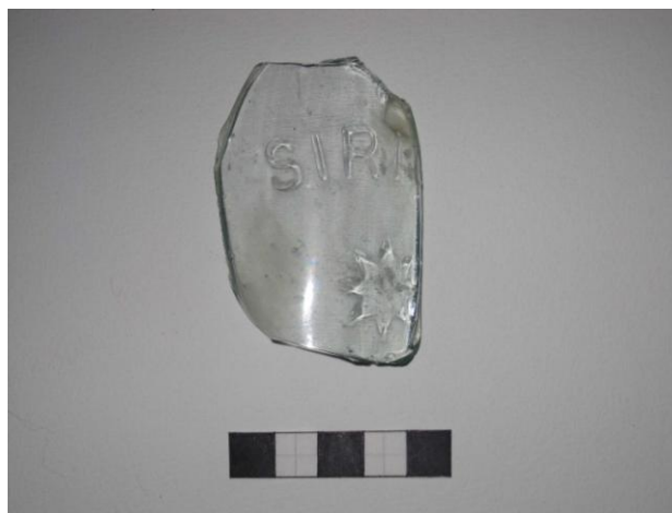
Gripur nr. 8 Flöskubrot