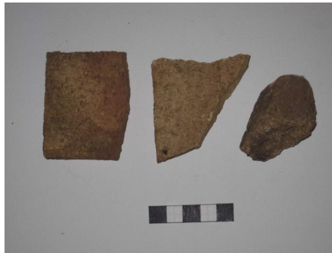
Gripur nr. 18, 19 og 20 Gulur múrsteinn