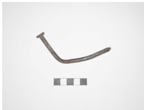
Gripur nr. 5 Nagli