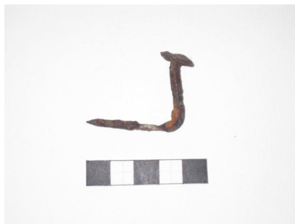
Gripur nr. 6 Þaksaumur