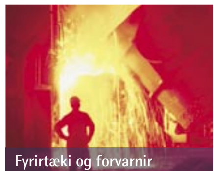
Fyrirtæki og forvarnir