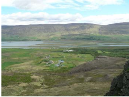
Mynd 2. Hamrar og Kjarnaskógur ( Ævar Arnfjörð Bjarmason, 2005 ).

náttúrulegar aðstæður. Mestur hluti skipulagssvæðis sem nýtist til útivistar og útiveru er á bilinu 50-115 metra hæð yfir sjó.