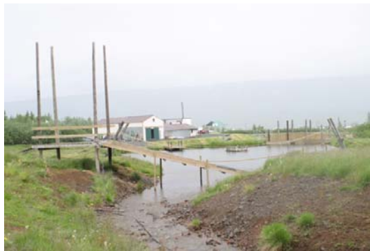
Mynd 3. Útilífsmiðstöðin og leiksvæðið ( Hermann Georg Gunnlaugsson, 2003 ).

Fjöllin, strandlengjan, eyrarnar og brekkan eru það sem að móta hið einstaka landslag og ásýnd Eyjafjarðar og Akureyrar. Sá sem að stendur á Brekkunni og horfir yfir Eyjafjörð verður vart ósnortinn. Þessi upplifun á landslagi á Akureyri er mjög sterk og síðan er það hinn einstaki fjallahringur sem undirstrikar þetta tilkomumikla landslag. Sútur og Hlíðarfjall að vestanverðu og Vaðlaheiði til austurs hafa mjög sterk áhrif á landslagið. Það er einnig þröngur Eyjafjörðurinn sem er umvafinn fjöllum sem styrkir enn frekar þessa sterku landslagsmynd Akureyrarbæjar og Eyjafjarðar.