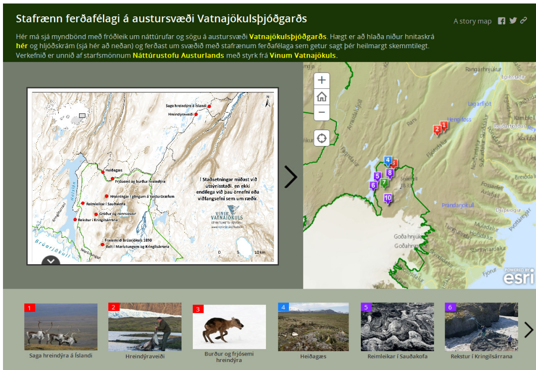
Mynd 2. Skjaskot af vefsíðu verkefnisins.