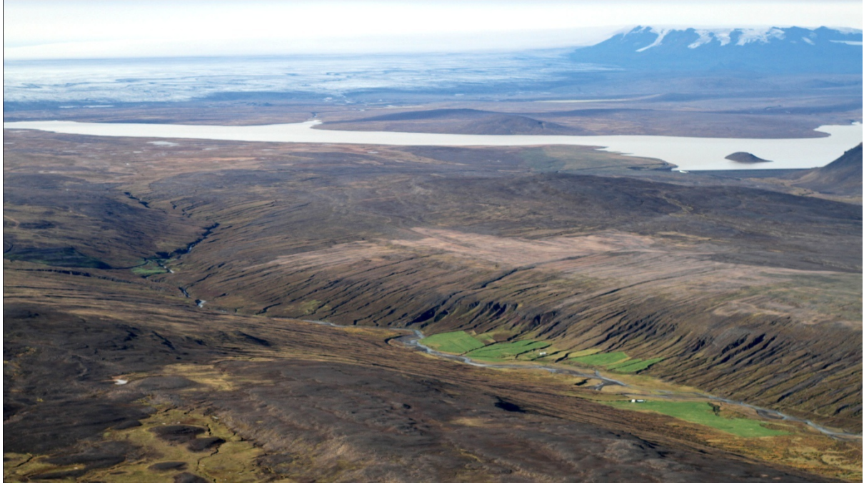
8. mynd. Innri hluti Hrafnkelsdal, Tunga, Glúmsstaðadalur, Faxahús og Laugarhús.

Heiðagæsavarp frá Faxagili inn að Tungusporði verður að víkja að hluta og líklega munu þær færa sig ofar í landið sömu megin og aðalvarpið er, ella að færa sig yfir á austurbakkann þar sem lítið varp er fyrir og mun óhentugra er að verpa. Þegar líkleg áhrif af vegi eru áætluð á heiðagæsavarp þarf að líta til nokkurra þátta. Í því sambandi má reikna með að áhrifin verði neikvæð og varanleg á varptíma en lítil utan hans. Þau verða staðbundin mikil fyrir varpið í dalnum en óveruleg ef lítið er til heildarstofnsins sem taldi 365.000 fugla árið 2009 (The Wildfowl & Wetlands Trust (WWT) 2009).