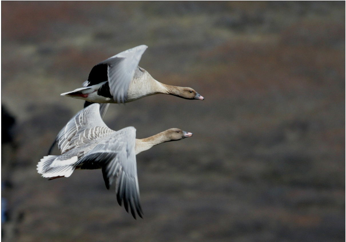
10. mynd. Heiðagæs er mest úberandi varpfuglinn í Hrafnkelsdal innan Faxahúsa (ljósm. S.G.P.).

Ef hreinkýr fara að bera í Hrafnkelsdal, í Kálfafelli, í Þuríðar- og Glúmsstaðadal og/eða Tungunni í framtíðinni væri rétt að takmarka umferð innan Aðalbóls í apríl og fram í júníbyrjun.