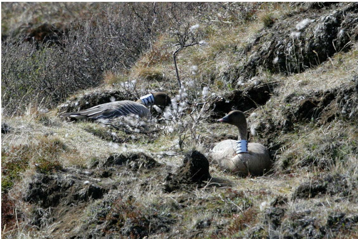
7. mynd. Hálsmerkt heiðagæsapar með hreiður í Hrafnkelsdal 2010 (ljósm. S.G.P.).