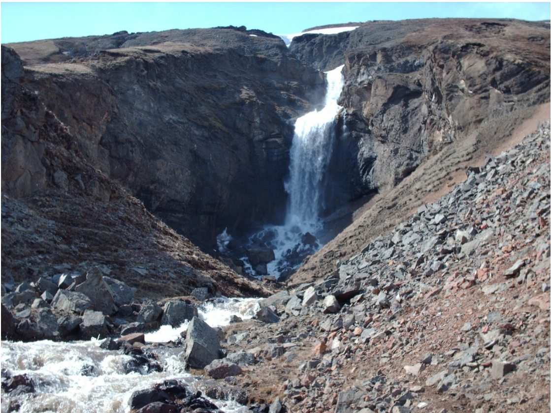
5. mynd. Faxagil í Hrafnkelsdal 2010.