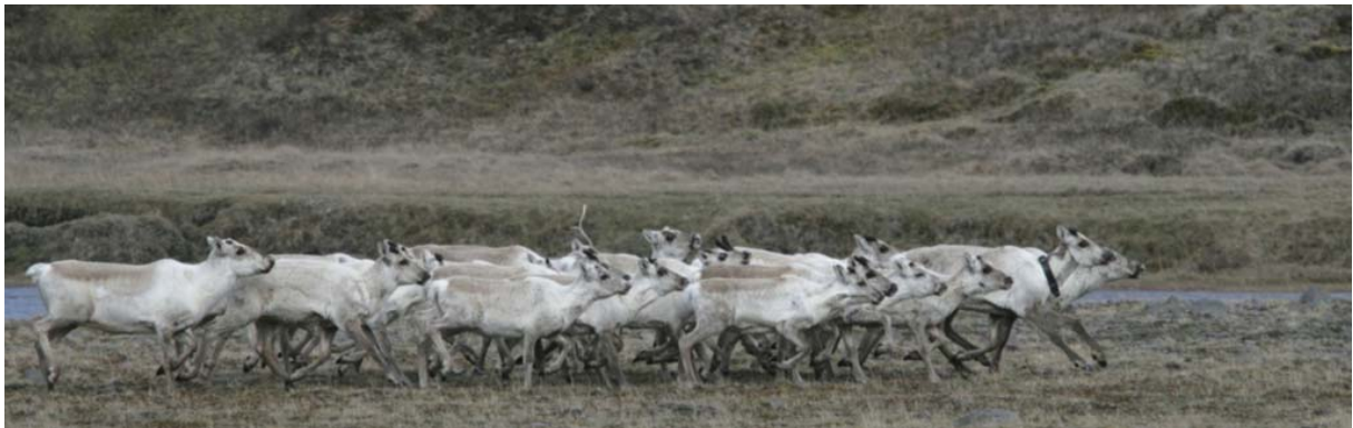
9. mynd. Hópur vetrunga og geldra kúa ein hyrnd (kelfd) kýr rétt utan við Faxahús í Hrafnkelsdal 31. maí 2010.