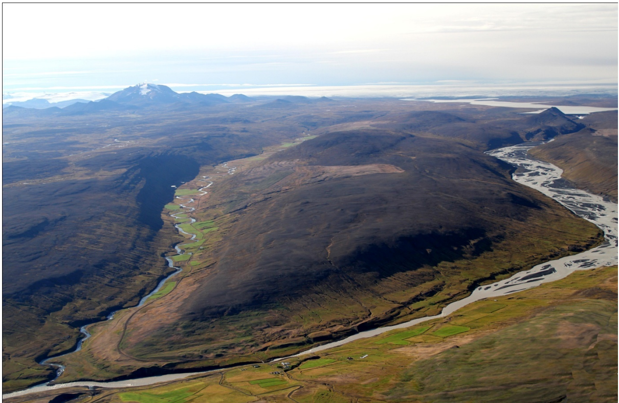
1. mynd. Hrafnkelsdalur, vettvangur athuganna. Snæfell og Brúarjökull í baksýn. Brú í forgrunni