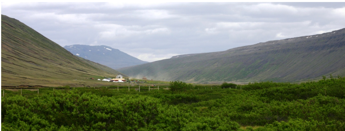
3. mynd. Afgirtur kjarrgróður við Laugarhús í Hrafnkelsdal. Aðalból fyrir miðri mynd.