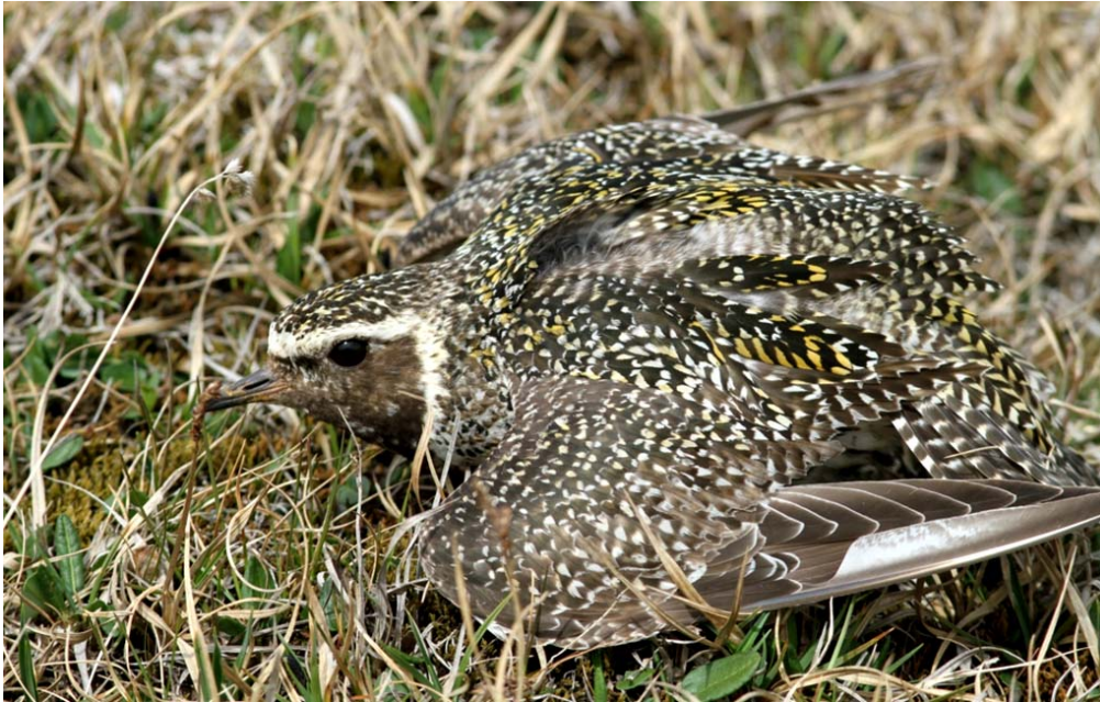
6. mynd. Heiðlóa að barma sér nálægt hreiðri.

Þar sem heiðlóur eru dreifðar um allt undirlendi dalsins sunnan Aðalbóls og er næst algengasta tegundin í dalnum samkvæmt talningum 2010 má reikna með að áhrif af vegagerð yrðu töluverð á hana. Bæði ungar og fullorðnir fuglar munu verða fyrir bílum og á það reyndar við um alla mófugla á svæðinu sem verpa og ala ungana nærri ánni.