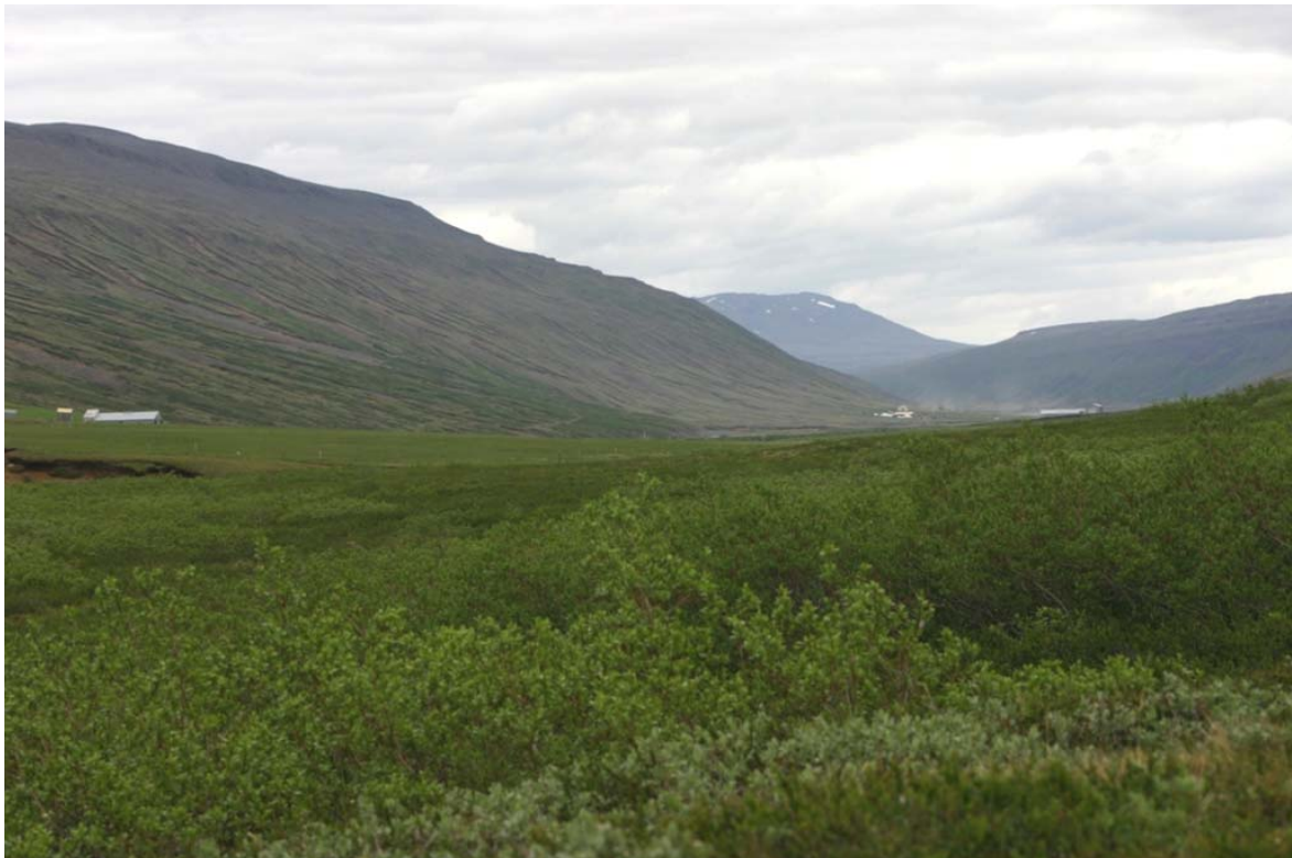
11. mynd. Horft norður Hrafnkelsdal frá Blesatanga. Faxahús til vinstri og Laugarhús til hægri, Aðalból fyrir miðjum dal og Eiríksstaðahneflar í baksýn