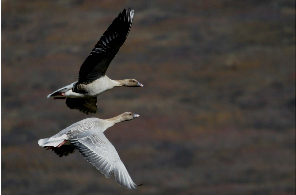
4. mynd. Hrafnkelsdælskar heiðagæsir flýja óboðinn tvífættan gest.