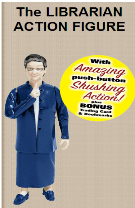
Fæst í safnbúð við útlánaborð á 2. hæð, aðeins 2.995,-