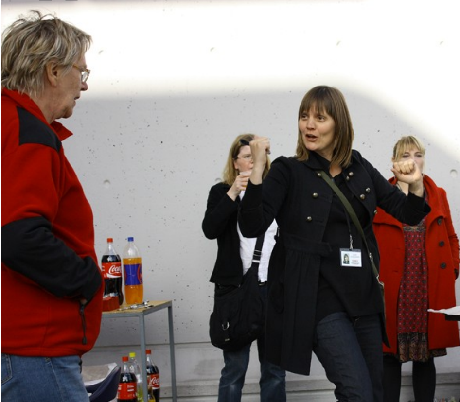
Hér sést einn sjóræningjanna leiðbeina gíslunum skömmu áður en lögreglan skarst í leikinn— Ljósmynd: Heimilið og KRON

Sjóræningjar gera óskunda við Þjóðarbókhlöðuna. Töldu sig vera á alþjóðlegu hafsvæði.