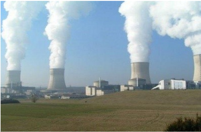
Korkeakoulut ja ikkunat Ihmiset stofnunin í Espo.—Ljósmynd: Rit Fegrunarfélags Reykjavíkur