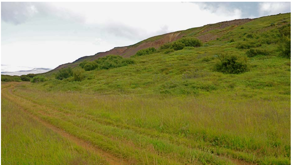
Mynd V2: Horft í átt að sniði 1 yfir götuna um Þrengsli og upp í hlíðar Selfjalls. Prentist myndin vel má greina legu sniðsins þar sem gult málband liggur í sverðinum rétt ofan við miðja mynd.