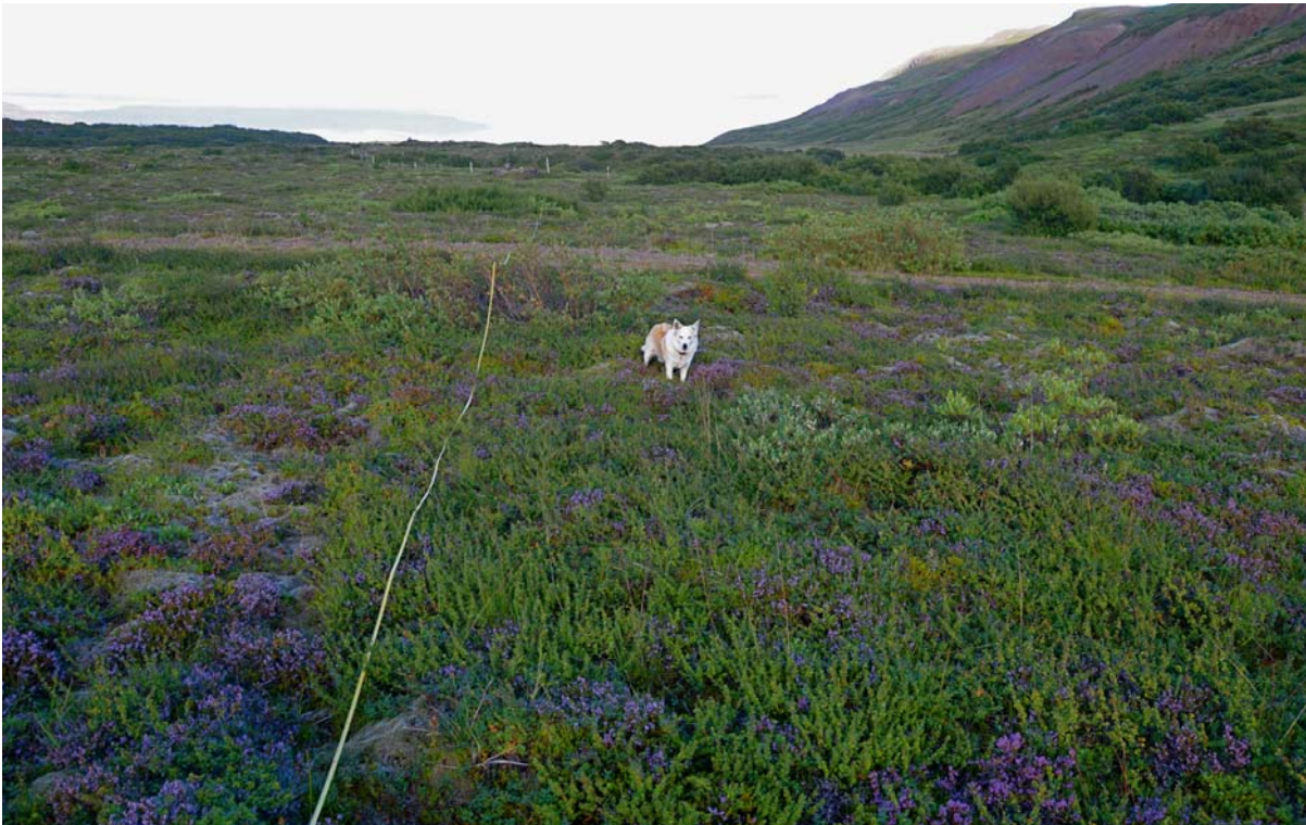
Mynd V3: Snið 2 liggur úti á hrauninu neðan hlíðar Selfjallsins sem sést lengst t.h. á myndinni. Þarna er jarðvegur rýrari en upp við fjallið og framvinda í nýliðun birkis og viðis ekki eins langt komin og við snið 1 .