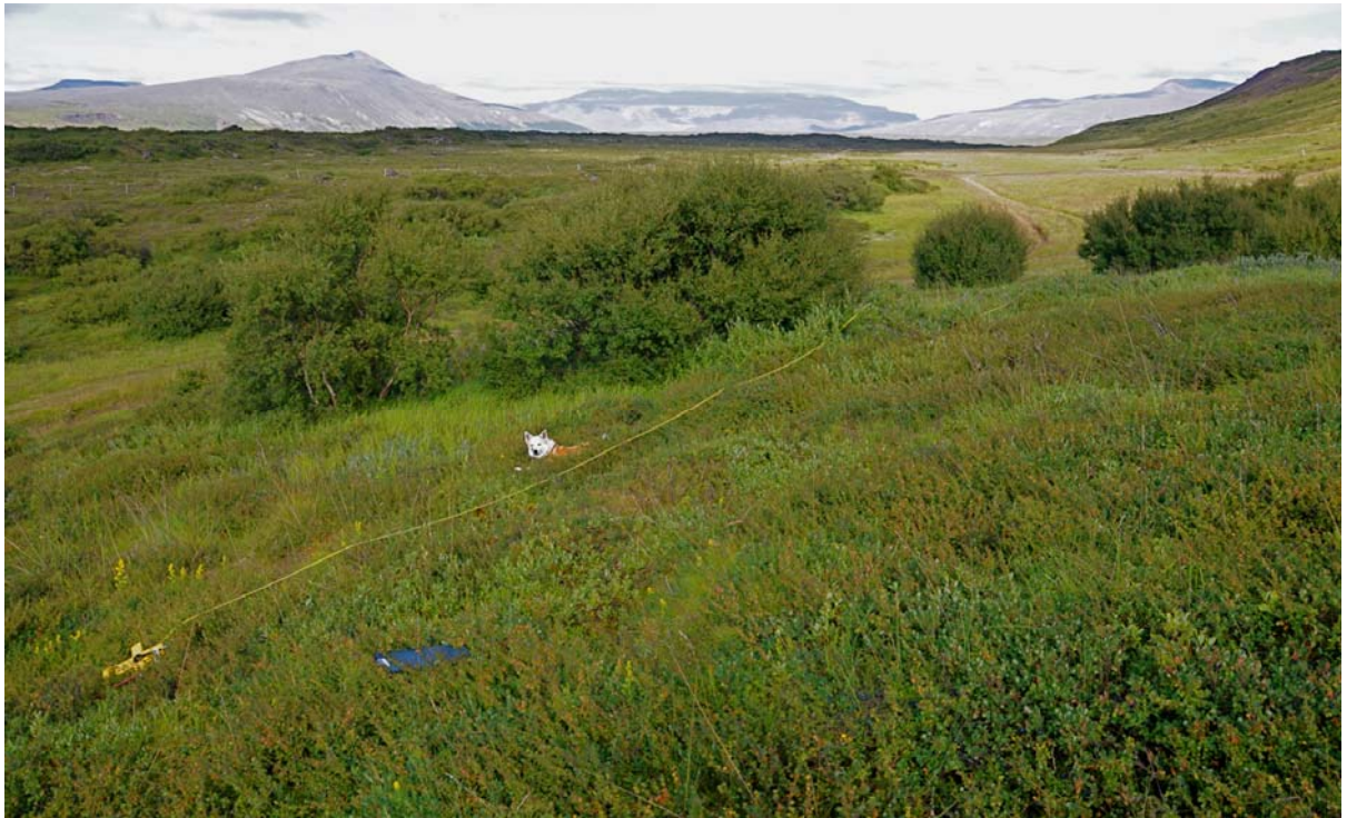
Mynd V1: Við jaðar Húsafellsskógar. Horft yfir snið 1 í undirhlíðum Selfjalls, vegurinn um Þrengsli og fram með Hlíð í baksýn ásamt fjöllum Strút, Eiríksjökli og Hafursfelli. Á þessum slóðum eins og víðast í útjarði Húsafellsskógar er skógurinn í sókn, mikil nýliðun í birki og víði. Nauðsynlegt er að höggva greinar af trjám við reiðgötuna í Þrengslum til þess að halda henni opinni fyrir umferð riðandi fólks. Allnokkur ár eru síðan gatan varð of aðþrengd fyrir bílaumferð.