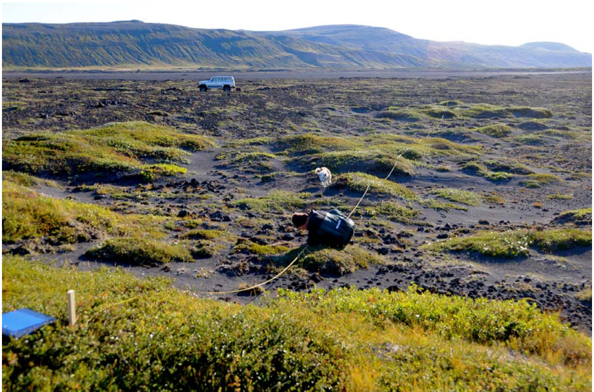
Mynd V6: Horft eftir sniði 4 í suðurátt til Húsafellsfjallanna Selfjalls, Bæjarfells, Útfjalls og Reyðarfellsbungan yfir. Hér sést vel jaðar gróðurlendisins við sandana sem myndast við framburð Svartár og Geitár og fjúka síðan inn yfir gróðurlendi nærliggjandi svæða.