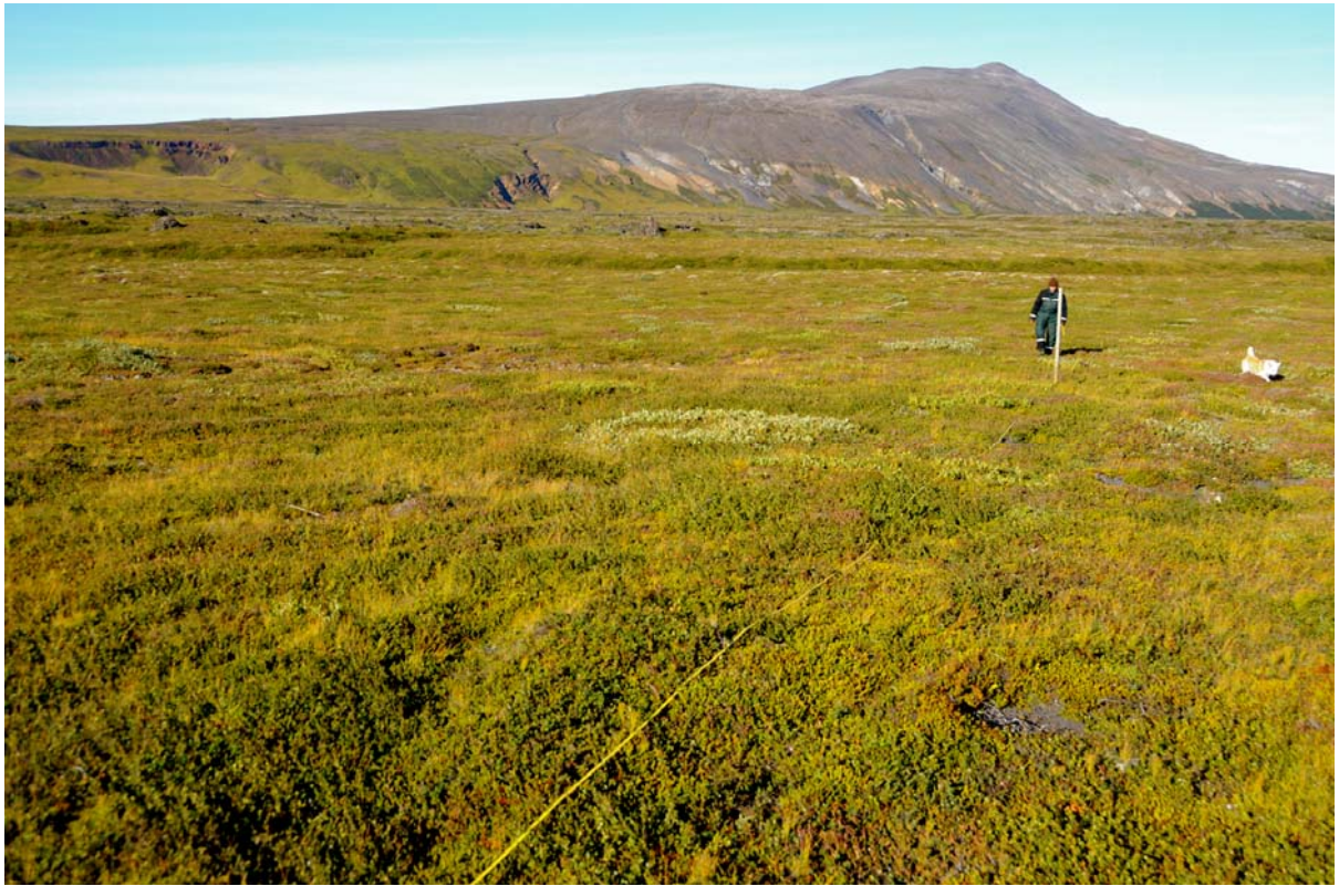
Mynd V5: Horft eftir sniði 4 , Strútur í baksýn, Katlarnir lengst til vinstri