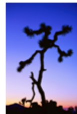
Mynd 15: Verklýsing fyrir Tree Adoption verkefnið

Nemendur skiluðu bókunum fullnum og fengu einkunnir fyrir innihald, útlit og sjálfstæða úrvinnslu verkefnanna í bókinni. Síðan skiluðu nemendur munnlegri skýrslu fyrir hópinn um efni sem þeir höfðu valið sér. Við einkunnuagjöfina studdist kennarinn við matskvarðann sem sjá má á næstu mynd: