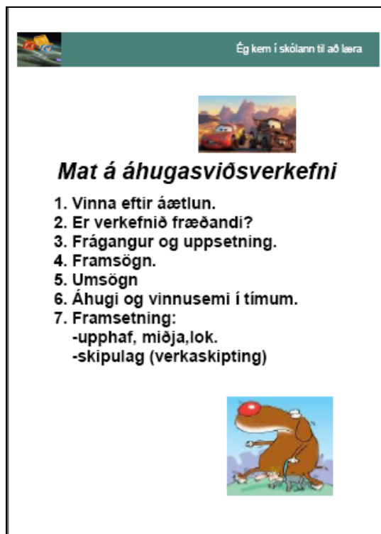
Mynd 5: Mat á áhugasviðsverkefni.

Fleiri dæmi um gögn sem kennarar Hrafnagilsskóla nota í tengslum við þessi verkefni er að finna á heimasíðu þróunarverkefnisins Ég kem í skólann til að læra á þessari slóð: http://kennsla.krummi.is/