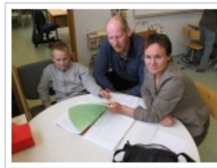
Mynd 2: Frétt um sýnismöppudag á miðstigi af heimasíðu skólans

Eitt foreldranna, sem heldur úti bloggsíðu, sá t.d. ástæðu til að fjalla um þetta á bloggsíðu sinni með þessari færslu: