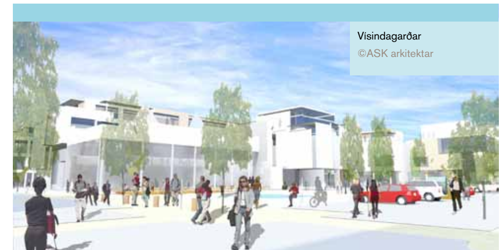
Vísindagarðar ©ASK arkitektar