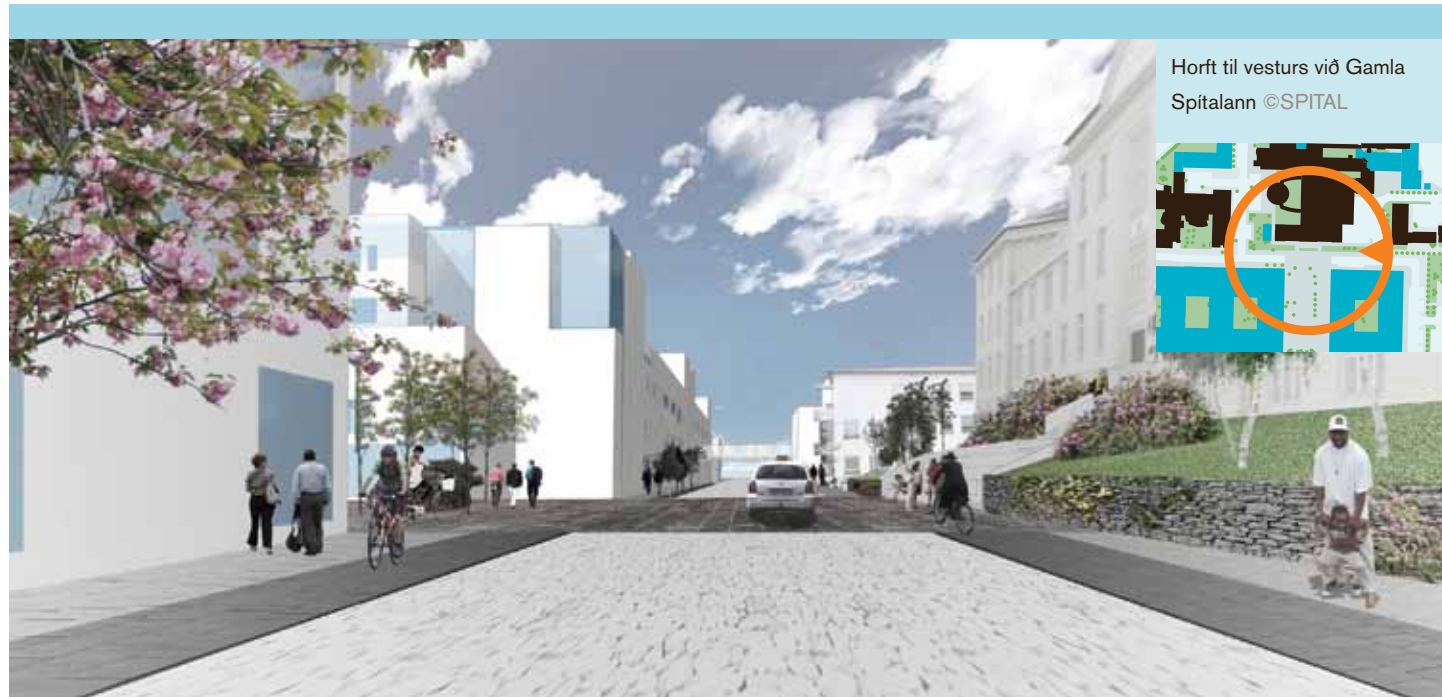
Horft til vesturs við Gamla Spítalann