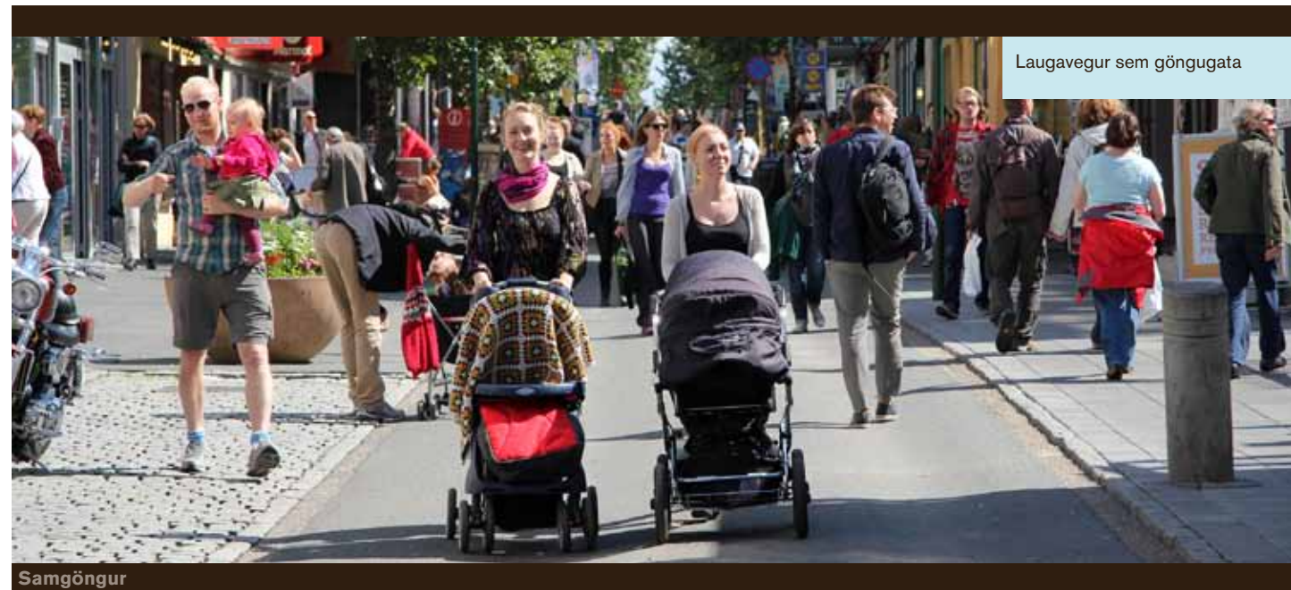
Laugavegur sem göngugata

Friðlandið í Vatnsmýrinni er einstakt svæði þar sem njóta má villtrar náttúru og fuglalífs í miðri höfuðborginni. Þar er gríðarstaður fugla, vatnalífvera og gróðurs, votlendi sem á að geta verið sjálfbært um hreinleika og endurnýjun. Rannsóknir á lífríki Vatnsmýrarinnar hafa sýnt að því fer hnignandi, en að jafnframt megi með tiltölulega einföldum aðgerðum bæta ástandið og stuðla þannig að endurbótum á náttúruferlinni. Tillögur um aðgerðir til endurbóta á svæðinu fela meðal annars í sér að tryggja Tjarnarfuglum öruggt varpland, uppræta ágengar plöntur og endurnýja og viðhalda líffræðilegum fjölbreytileika á svæðinu.