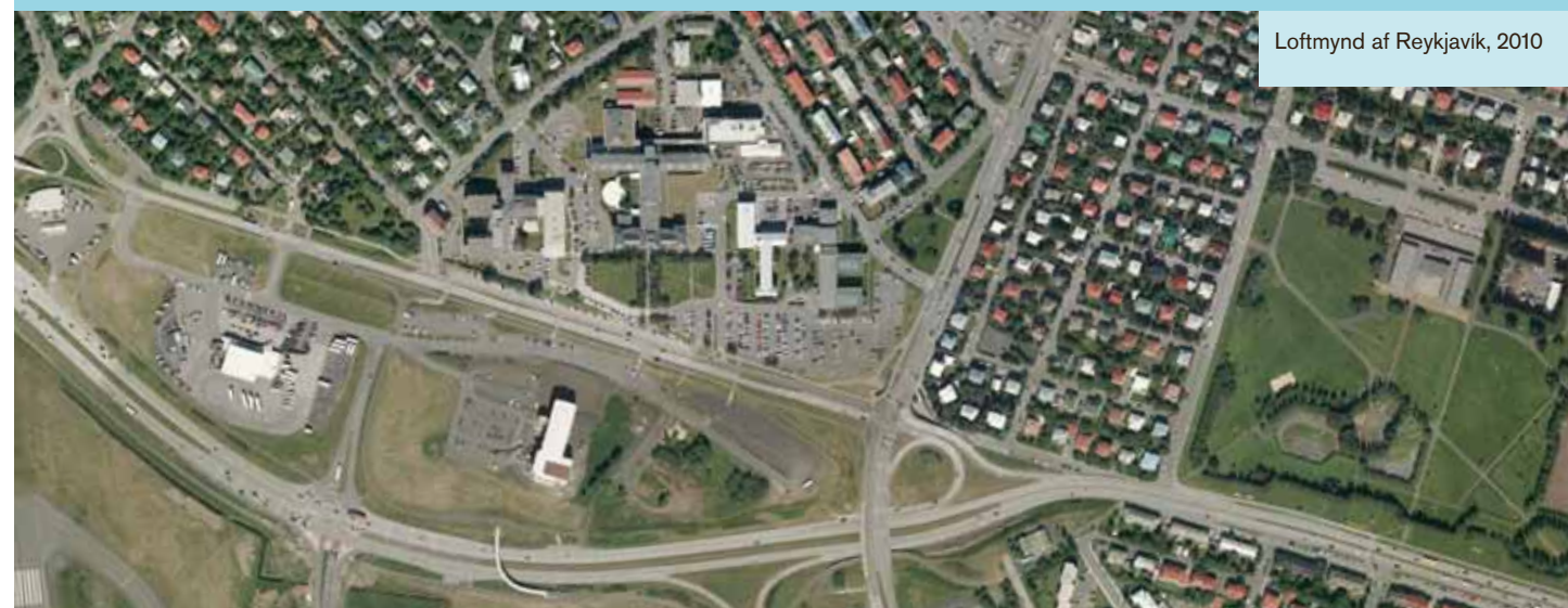
Loftmynd af Reykjavík, 2010