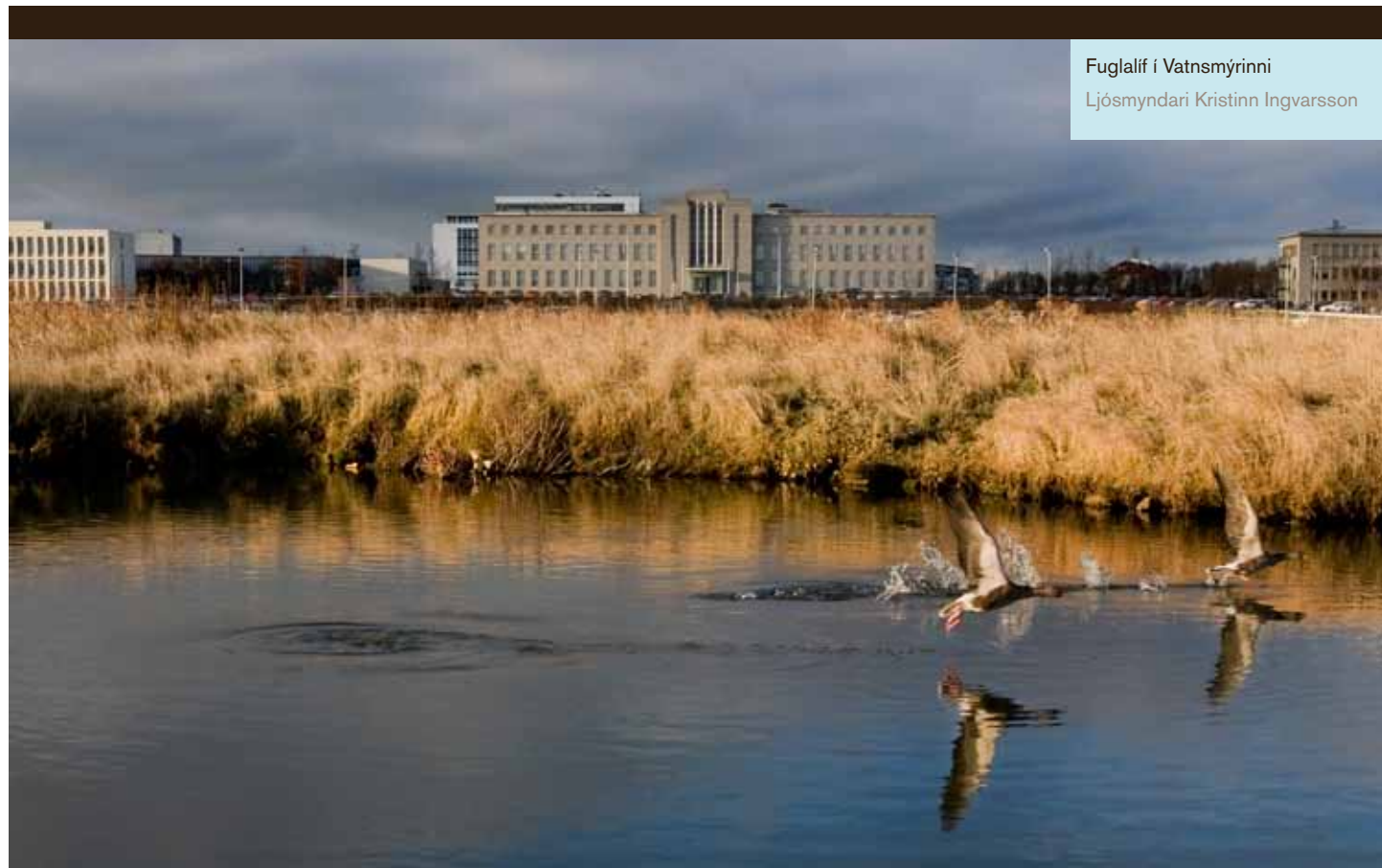
Fuglalíf í Vatnsmýrinni