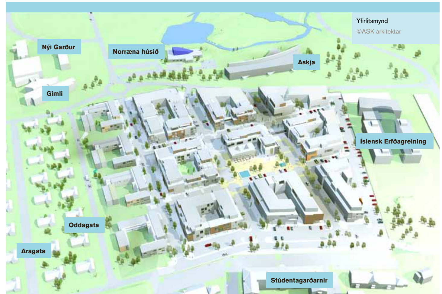
Yfirlitsmynd ©ASK arkitektar