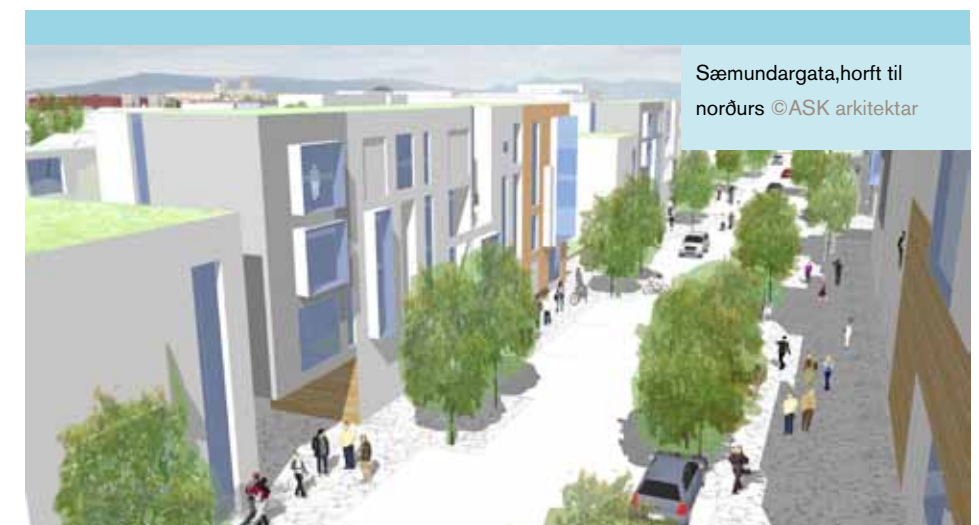
Sæmundargata, horft til norðurs ©ASK arkitektar