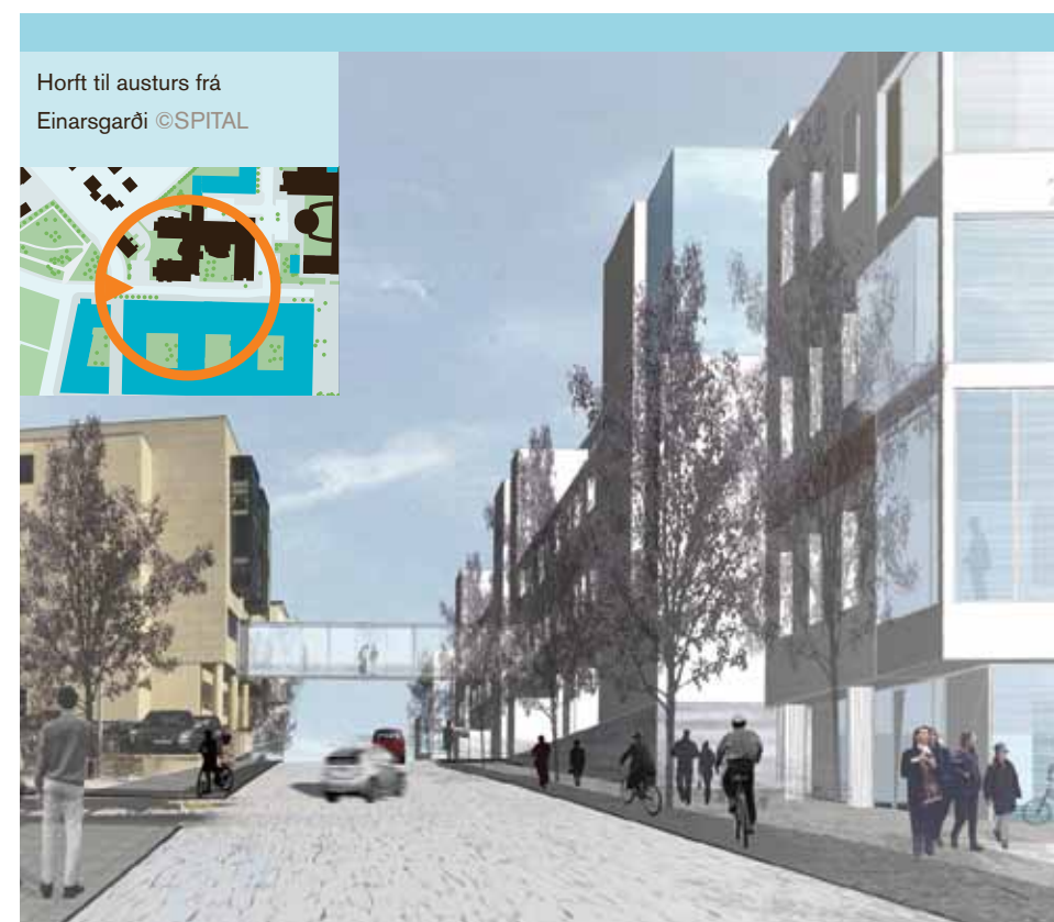
Horft til austurs frá Einarsgarði