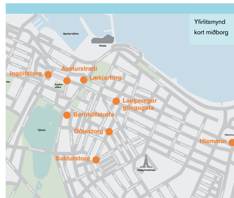
Yfirlitsmynd kort miðborg