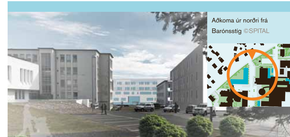
Aðkoma úr norðri frá Barónsstíg ©SPITAL