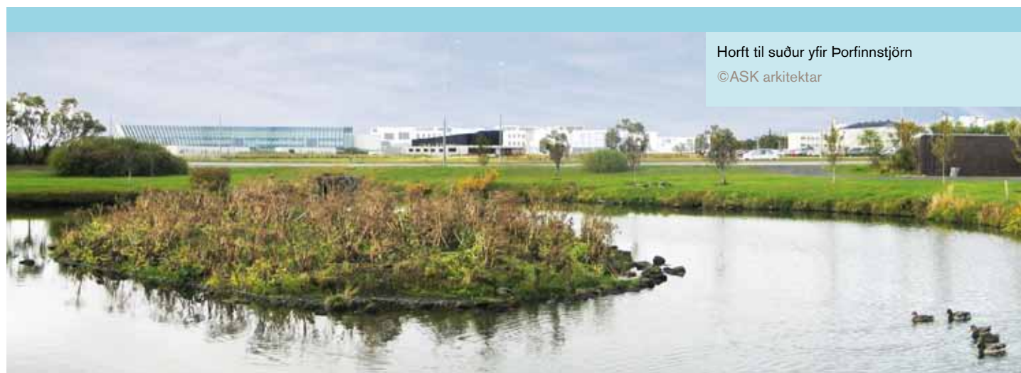
Horft til suður yfir Þorfinnstjörn