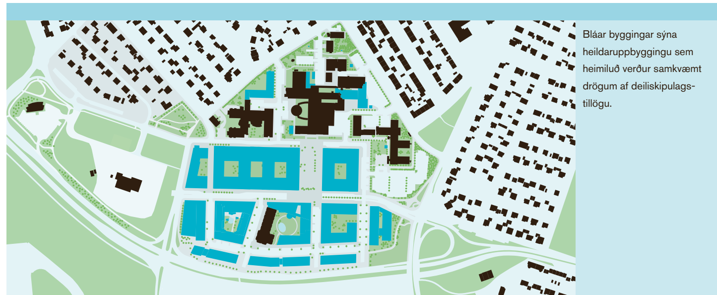
Bláar byggingar sýna heildaruppbyggingu sem heimiluð verður samkvæmt drögum af deiliskipulags-tillögu.

Íslands við Hringbraut. Teymi undir forystu C.F Möller varð hlutskarpast og vann í framhaldinu að þarfagreiningu og frumathugun. Í kjölfar efnahagshrunsins var ákveðið að endurmeta forsendur verkefnisins. Niðurstaðan var að hagnæmst væri að sameina spítalarekstur við Hringbraut og leggja af starfsemi í Fossvogi. Í kjölfarið var efnt til lokaðrar samkeppni á grunni forvals um frumhönnun Nýs Háskólasjúkrahúss snemma árs 2010. Hönnunarteymi arkitekta og verkfræðinga undir merkjum SPITAL varð hlutskarpast í samkeppni og lágu niðurstöður fyrir 9. júlí 2010. Sama haust hófst vinna við frumhönnun og deiliskipulag NLSH, Nýs Landspítala Háskólasjúkrahúss.