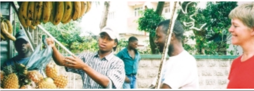
Mynd: Famney Friðriksdóttir