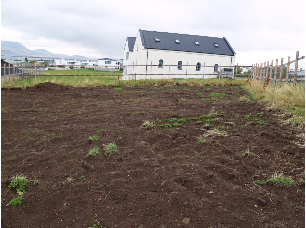
Mynd 11. Svæðið sem aftyrft var og þarf að lagfæra.