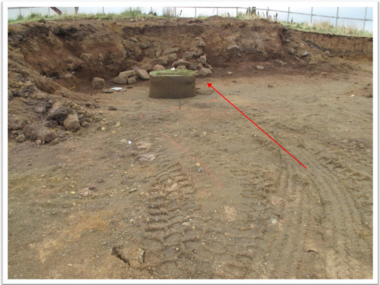
Mynd 1. Aðkoma að svæðinu áður en verkið hófst.