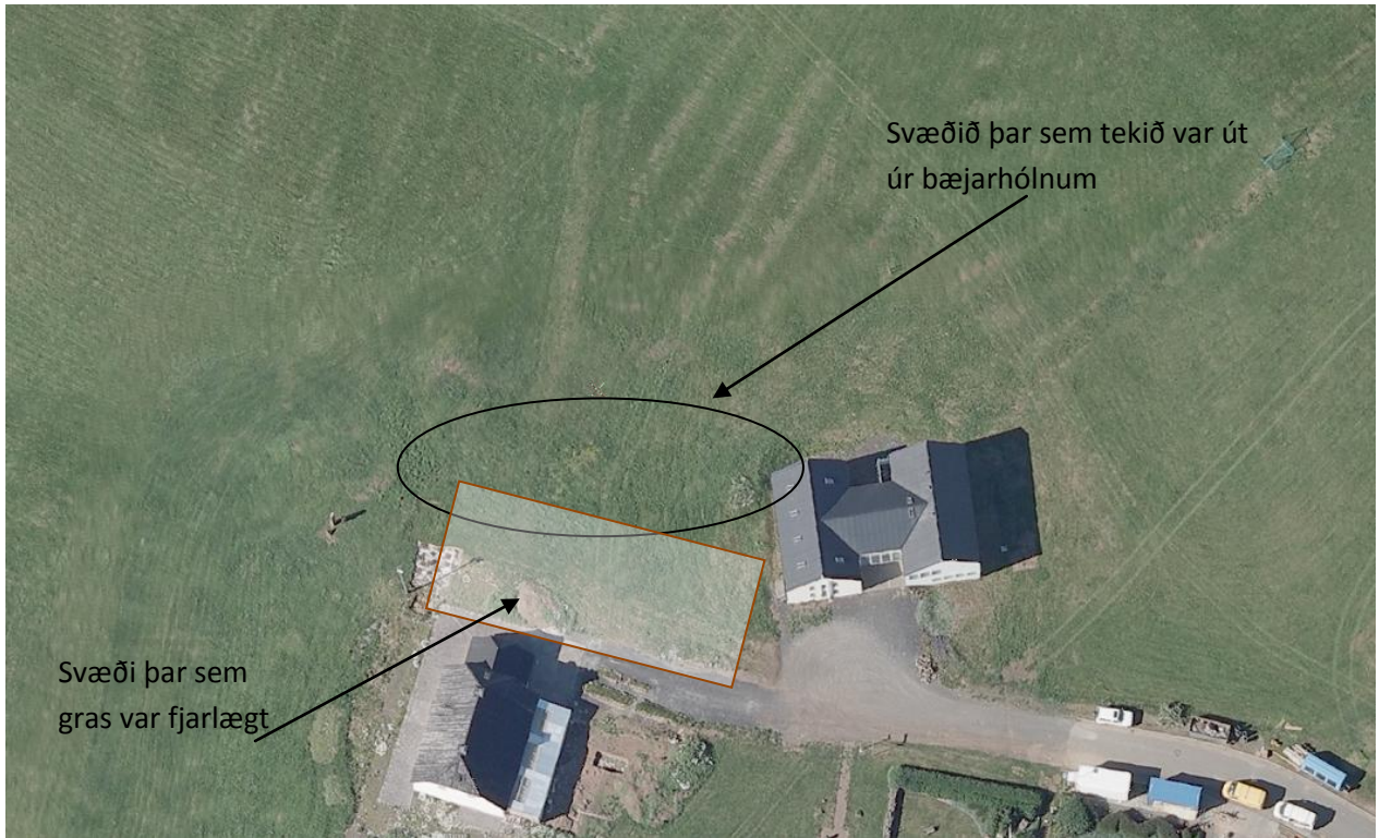
Mynd 10. Svæði þar sem skemmdir urðu á bæjarhólnum.