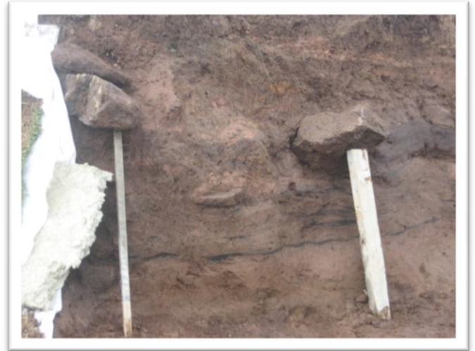
Mynd 9. Stúðningur var stettur undir grjótt sem stóð út úr sniðinu.