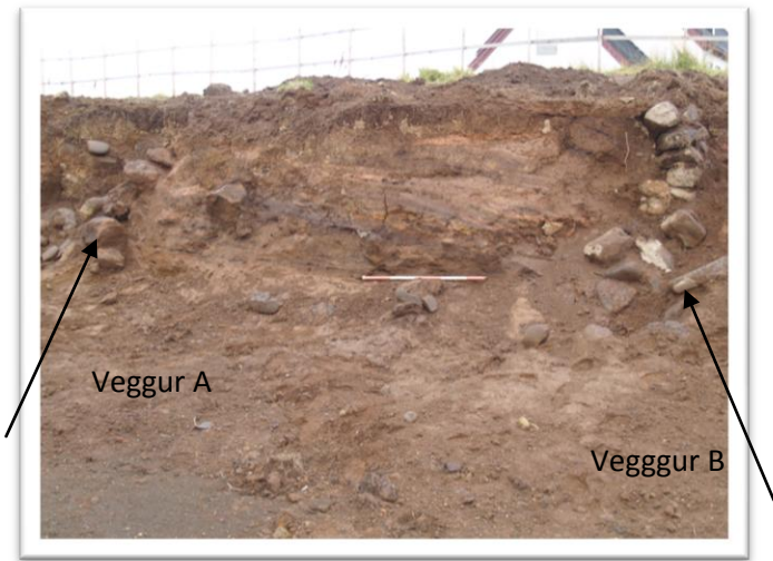
Mynd 2. Tveir veggir standa út úr bakkanum. Mannvistarlög á milli, torf, gjósku og gólfteg. Tekið í SA.