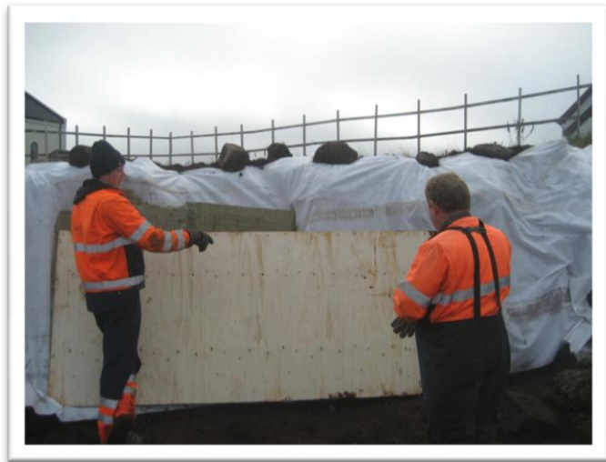
Mynd 4. Jarðvegsdúk var lagður að sniðinu og síðan steinull. Krossviðplötur lagðar að og síðan annað lag af jarðvegsdúk. Svæðið næst Lyfjafræðisafni. Tekið í SA.