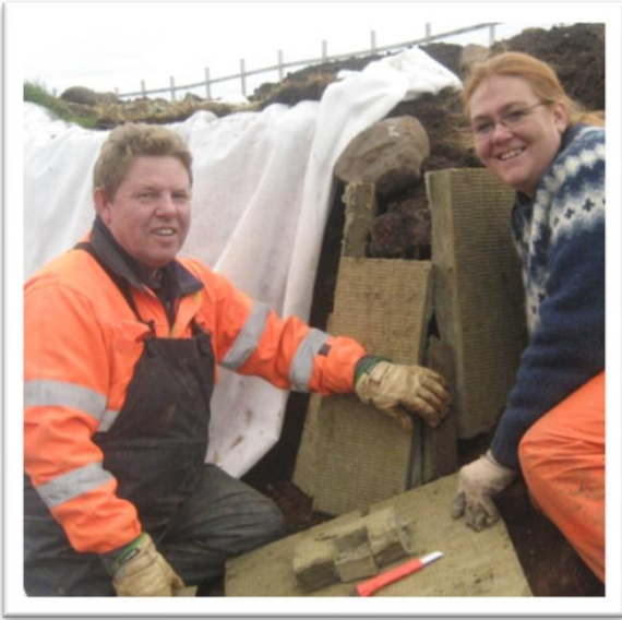
Mynd 8. Veggur B (sjá mynd 2). Búið um vegginn til að að hindra að hann hrynji. Jarðvegsdúkur settur yfir og jarðvegur settur að. Tekið í SSA.