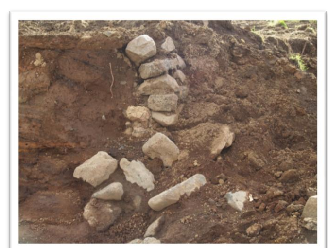
Mynd 7. Veggur B (sjá mynd 2). Tekið í N.