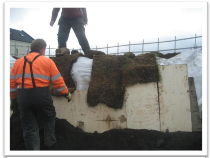
Mynd 5. Torf lagt yfir og ferst með stuttum teinum. Stífa stett að krossviðnum og mól lögð að. Tekið í SA.