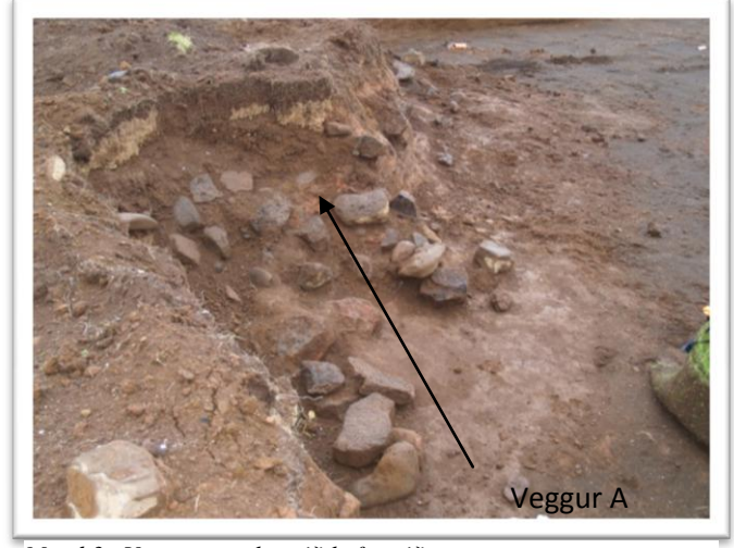
Mynd 3. Veggur sem hrúnið hefur niður. Tekið í SA.