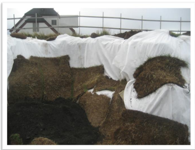
Mynd 6. Veggur A eftir lokun (sjá mynd 2). Tekið í N.