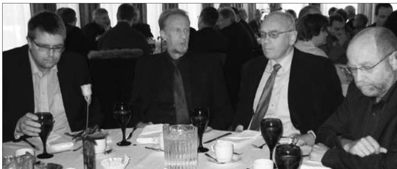
Lagt við hlustir

Í ljósi þeirra óska sem félagsmenn hafa um þjónustu og lögboðins hlutverks FLE þá er ljóst að auka þarf starfsemi félagsins. Þá hefur það verið rætt að ýmis verkefni stjórnar félagsins megi flytja til framkvæmdastjóra. Tveir starfsmenn eru hjá FLE og eru báðir í 60% starfi. Allt til 1. febrúar 2005 var einungis einn starfsmaður hjá félaginu, þegar ráðinn var faglegur framkvæmdarstjóri í 60% starf. Með þeirri ráðningu