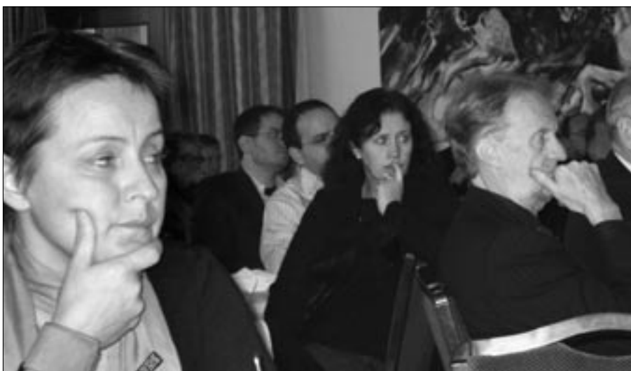
Lagt við hlustir

varð veruleg breyting á starfsemi félagsins. Faglegur framkvæmdastjóri sinnir ýmsum faglegum málum svo sem vinnu fyrir fagnefndir félagsins, samskiptum innan NRF, samskiptum við fjármálaráðuneytið og skattayfirvöld, auk ýmissra annarar faglegrar vinnu. Með faglegum framkvæmdastjóra hefur vinna formanns og varaformanns vegna ýmissa verkefna í þágu félagsins