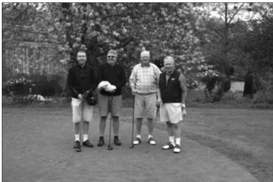
Fjórir stæltir strákar mættir á teig.