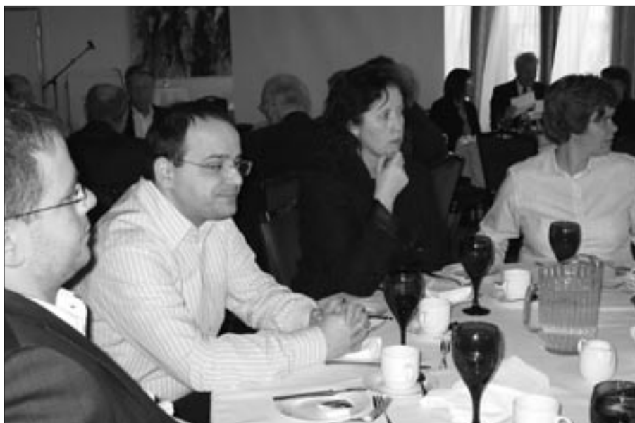
Lagt við hlustir

Stjórn félagsins tók strax þá stefnu að félagið skuli eftir sem áður vera fyrir alla þá sem hlotið hafa löggildingu sem endurskoðendur á Íslandi óháð því hvort þeir hafa lagt inn réttindi sín eða ekki. Það þýðir að nauðsynlegt er að skilgreina þjónustu félagsins með tilliti til þess að þessir hópar kunni að hafa mismunandi þarfir.