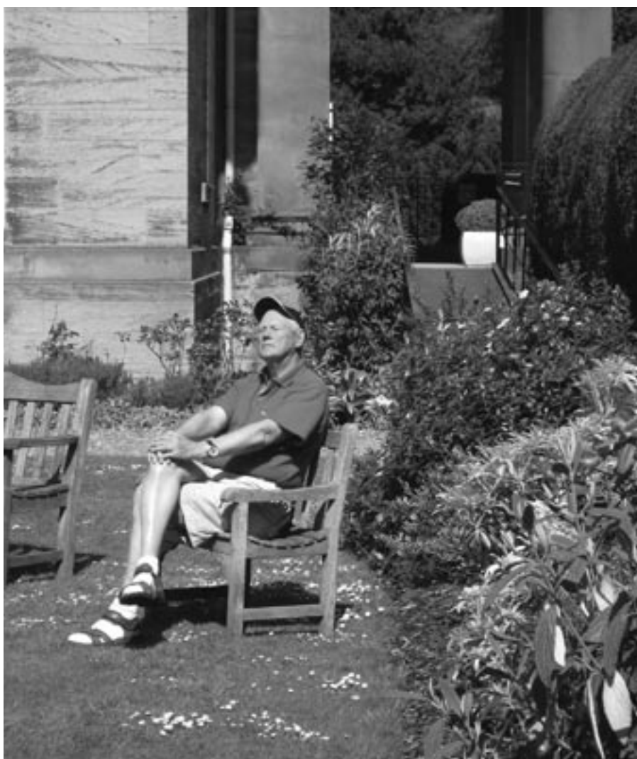
Eldri endurskoðandi sólar sig í hallargarðinum við Balbirnie hótelið.

Hefð er komin á golfferð endurskoðenda til Skotlands í maí hvert ár. Ellefta vorferð FLE golfara var farin dagana 8.–15. maí 2008 og í þetta sinn var ferðinni heitið á golfhótel í nánunda við borgina Glenrothes í Perth héraði. Fyrir tæpum 10 árum hafði golfhópurinn komið á þær slóðir sem nú skyldi haldið á. Glæsilegur golfvöllur og forn hótélbygging hafði síðan virkað sem segull á nokkra í hópnum og nú skyldi haldið á þessi mið. Áfangastaðurinn eða hótelið heitir Balbirnie House, sveitasetur eða bústaður heldri manna frá árinu 1777. Hótélbyggingin er nú í hópi þeirra bygginga á Skotlandi sem mest varðveislu gildi hafa (Grade A), bæði vegna sögulegrar þýðingar og eins vegna byggingalistarinnar. Húsið er með fyrstu húsum í Skotlandi sem byggt var eftir klassískum (grískum) stíl og að auki líklega það stærsta. Þó greinilega hafi sitthvað verið gert fyrir húsið frá fyrstu dögum þá má enn merkja gömlu tímana, notalegt marr í trégólfum á göngum og í stigum. En þó fornt sé þá er aðstaðan öll notaleg og gott úr-