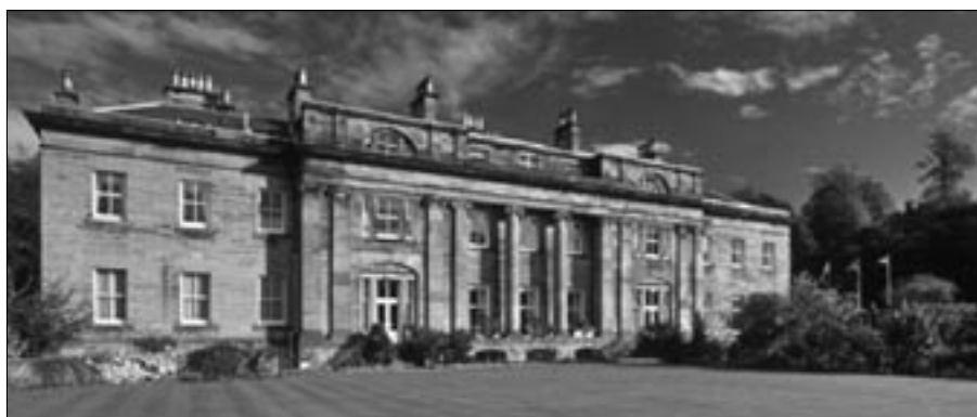
Balbirnie House hótelið.

Dagsetning meistaramótsins vakti athygli og kallaði á athugasemd athuguls golfara. Þeir sem þekka til staðháttu við Korpuvöll vita að stórhýsið þar þjónar margskonar tilgangi og í nyrðri endandum hefir Golfklúbbur Reykjavíkur sína aðstöðu við Korpuvöll. Við þann enda rísa 2 turnar viðfestir aðalbyggingunni – súrheysturnar. Tvíburaturnar. Að halda golfmót í skugga tvíburaturna þann 11. september þótti bera vott um að mótshaldari vildi storka örlögunum. Varla hafa menn þó talið að súrheysturnarnir ættu eftir að lenda í árekstri við flugvél og hrynja yfir golfara þennan dag en þetta aðeins sett fram sem skemmtilegur og sérstakur áhittingur. En það var fleira eftirminnilegt sem skeði í Reykjavík þennan dag, 11. september 2008. Ráðherra afhenti verðlaun fyrir Árskýrslu ársins 2007 og