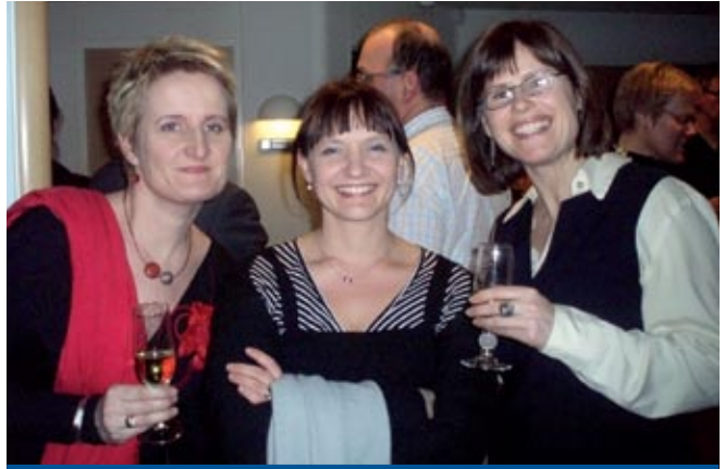
Á góðri stund í árlegu höfundaboði Námsgagnastofnunar.

Meðal nýs námsefnis til tungumálakennslu sem gefið var út á árinu 2008 má nefna New Matrix-Intermediate , enskukennsluefni fyrir 10. bekk, æfingaheftin Hickory, Dickory, Dock , vefinn Think about it og Adventure Island of English Words , sem er kassi með 311 myndaspjöldum sem eru ætluð til kennslu í ensku og íslensku á yngsta stigi, ásamt á annað hundrað vinnublöðum sem fylgja efninu til útprintunar á vef. Efnið hentar ágætlega til kennslu innflytjenda. Í dönsku kom út þemaheftið Dejlige danmark ásamt verkefnibók og Sådan , sem eru þemaverkefni í dönsku og upplýsingatækni.