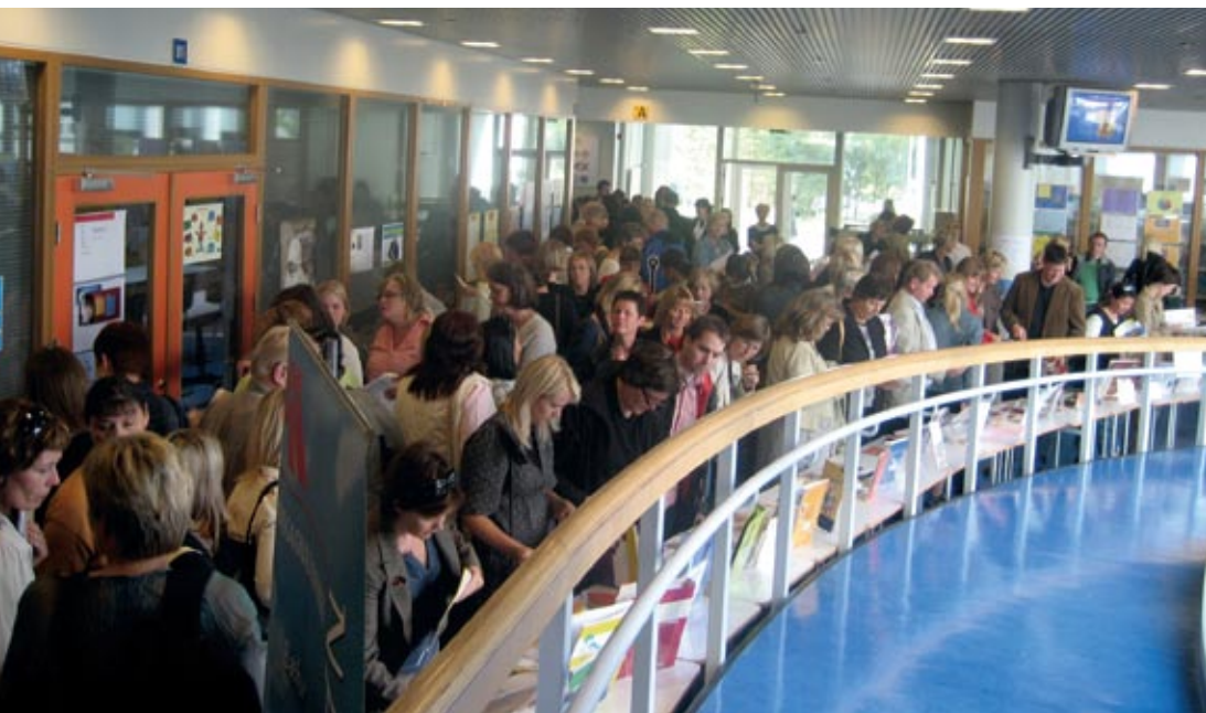
Frá árlegri sýningu Námsgagnastofnunar í Árbæjarskóla.