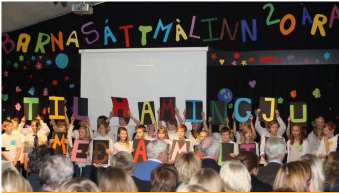
Þann 20. nóvember var þess minnst í Smáraskóla í Kópavogi að 20 ár voru liðin frá setningu Barnasáttmála Sameinuðu þjóðanna. Af því tilefni var opnaður vefurinn www.barnasattmali.is .

efni úr söngvasöfnum sem fylgdu námsefni í tónmennt fyrir yngsta stigið og loks má geta efnis sem gefið var út í samstarfi við arkitektafélag Íslands og heitir Byggingarlist í augnhæð .