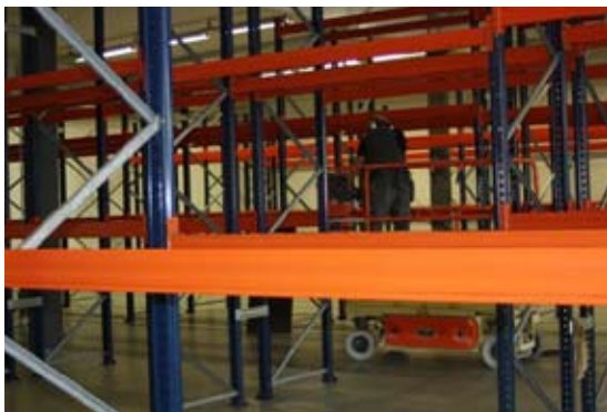
Á nýjum lager er fullkomin aðstaða fyrir stöðluð Evrópu-vörubretti, sem ekki var hægt að nota fyrr.