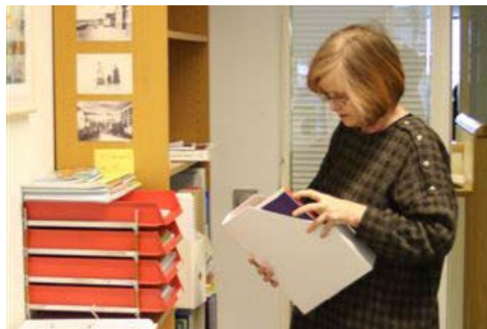
Það er í mörg horn að líta þegar flutt er eftir langa veru á sama stað.