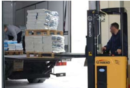
Í Víkurhvarfi er hægt að koma við nýjustu tækjum á lagernum.