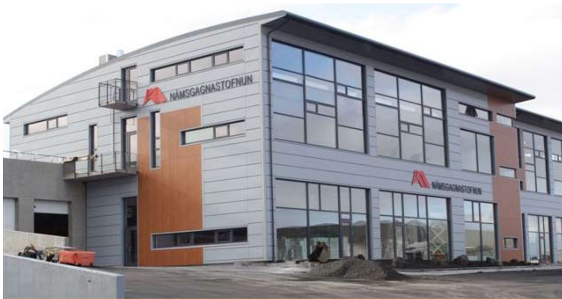
Nýtt aðsetur Námsgagnastofnunar að Víkurhvarfi 3, Kópavogi.