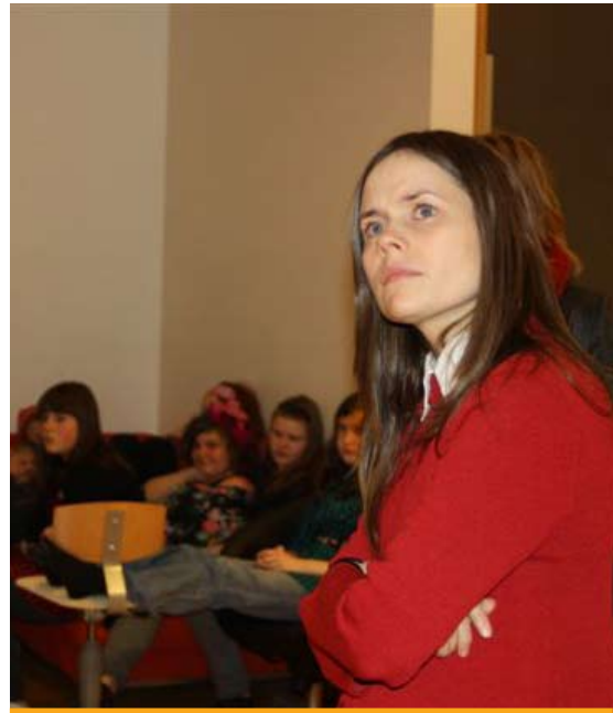
Mennta- og menningarmálaráðherra, Katrín Jakobsdóttir, fylgist einbeitt með opnun á nýjum vef um loftslagsmál í Sjúalandsskóla, í nóvember síðastliðnum.

Í íslensku kom margt út á árinu. Fyrst má nefna handbók kennara, Íslenska í 1. og 2. bekk . Hand-