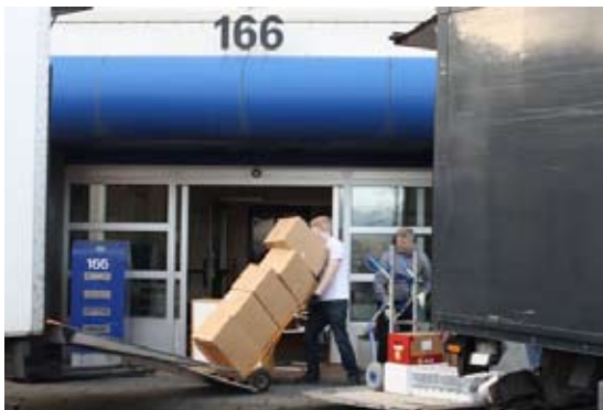
Margir kvöddu Laugaveg 166 með söknuði.