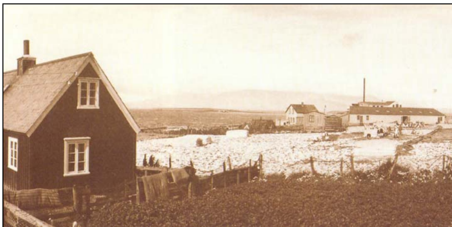
Mynd 6. Ánanaust upp úr aldamótum, næst er Ívarssel (nr.1-1), fjær sjást Ánanaustabæirnir, vestast torfbærinn (4-8 ) og austar timburhúsin tvö (nr 4-1 og 4-7) og fiskvinnsluhús Alliance. 29

Upphaf búsetu í Ánanaustum er óvíst, en talið er að þar hafi upphaflega verið naust frá Vík. 26 Ánanaust eru skráð sem hjáleiga frá Hlíðarhúsum í Jarðabók Árna og Páls. 27 Ánanaust fylgdu Hlíðarhúsum þegar þau urðu eign Helgafellsklausurs þegar jörðin var gefin kirkjunni 1723, eins var þegar bæjarstjórnin keypti Hlíðarhús. Bæjarhúsin í Ánanaustum munu hafa staðið nálægt Örfiriseyjargrandanum, vestast við Mýrargötu norðan megin. Bæirnir hafa verið fimm um tíma en síðasti bærinn var rifinn um 1940 vegna framlengingar Mýrargötu. 28