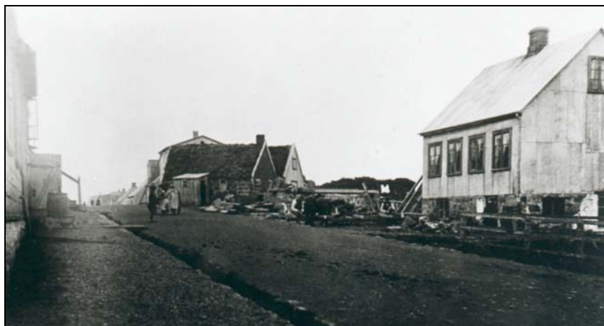
Mynd 5. Hlíðarhúsastígur (Vesturgata) og Hlíðarhús (Austurbær) 1897 séð í vestur. 22

Hjá Hlíðarhúsum stóð brunnur er var nefndur Hlíðarhúsabrunnur (nr. 3-21). 20 Meðfram Hlíðarhúsabæjunum var sjávargata niður í aðalvörina um 1870 (nr. 3-3). 21 Eftir að Hlíðarhúsabæirnir byrjuðu að týna tölunni risu þar fjölmörg timburhús sem standa þar enn.