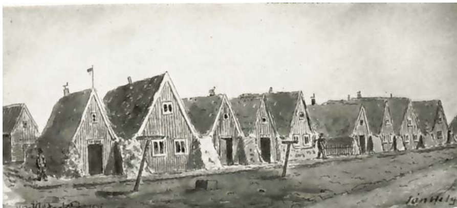
Mynd 3. Hlíðarhús (nr. 3-1) 1887, horft austur eftir. Hús norðan við er nr. 3-10. 14

Reykjavíkur, ef bærinn gjaldi 9 vættir og 30 fiska árlega til prestsins á Helgafelli í Snæfellsnessýslu, sjá brauðskýrsluna þar". 13