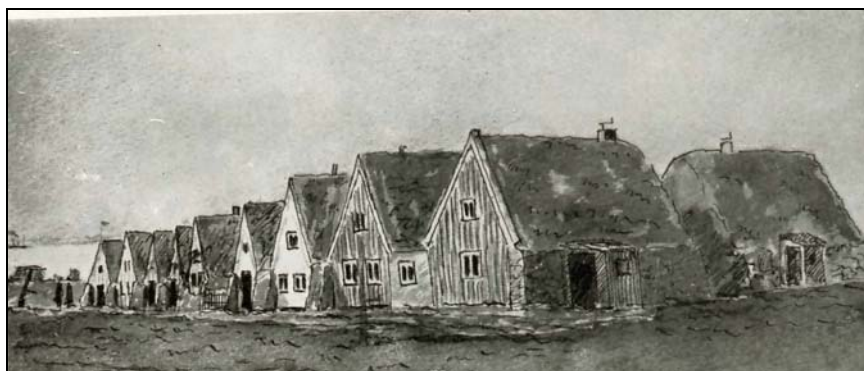
Mynd 2. Hlíðarhús (nr. 3-1) 1887, horft vestur eftir. Torfbær norðan við er nr. 3-11. 9

Í Jarðabók Árna Magnússonar og Páls Vídalíns segir að samkvæmt sögn manna séu Hlíðarhús partur af Víkurlandi og sjötugur jarðarinnar. Hins vegar höfðu Hlíðarhús þá sérstöðu að þau voru aldrei konungseign, gagnstætt því sem var algengast á suðvesturhorni landsins, heldur í bændaeign og voru því talin til sjálfstæðra lögbýla. 8