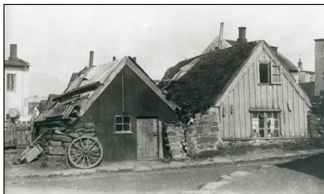
Mynd 4. Hlíðarhús. Vesturbær um 1920 en hann var rifin árið 1927. 18