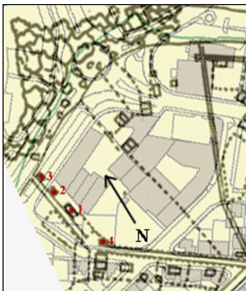
Mynd 8. Samsett kort Hlíðarhús. Á kortið eru merktar fornleifar Sels.