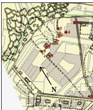
Mynd 7. Samsett kort Hlíðarhús. Á kortið eru merktar fornleifar Ánanausta.

Fiskvinnslufélagið Alliance hf., sem stofnað var árið 1905, var lengi atkvæðamikili í útgerð. Það reisti mikil fiskþurrkunarhús og stakkstæði á lóð Ánanausta og voru tún bæjarins lögð undir. 30 Jarðamörk átti jörðin á mótum Hlíðarhúsum og Seli.