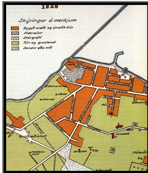
Reiturinn á korti frá 1920. 1

Reiturinn afmarkast af Framnesvegi, Holtsgötu, Seljavegi og Vesturgötu.