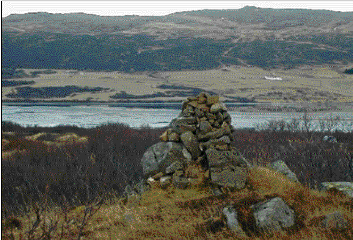
Mynd 4. Stráksvarða.