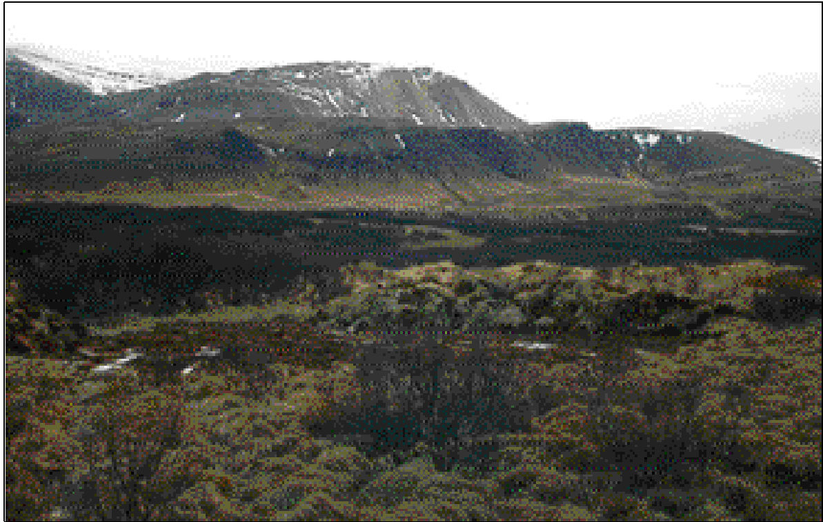
Mynd 2. Yfirlitsmynd yfir skipulagssvæðið. Horft í suðvestur.