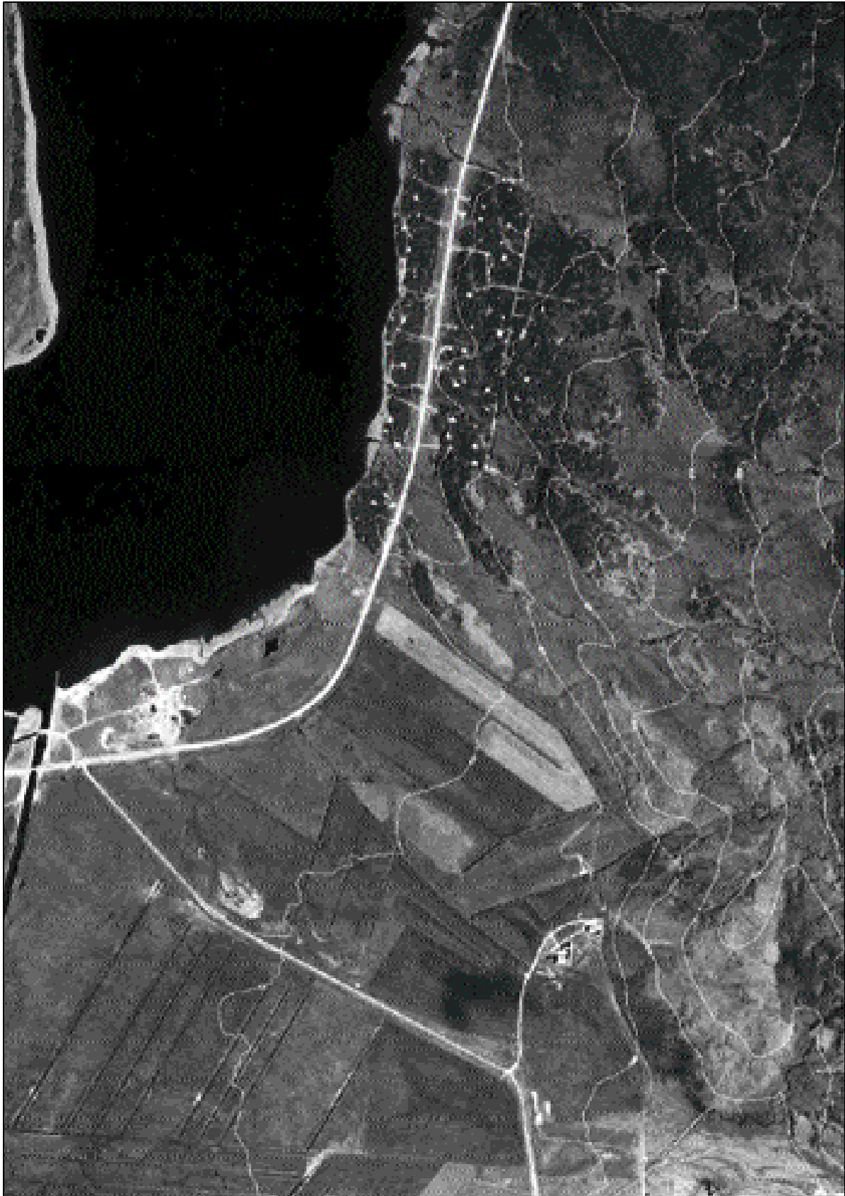
Lofmynd af skipulagssvæðinu við Skorradalsvatn, sbr. skipulagskort.