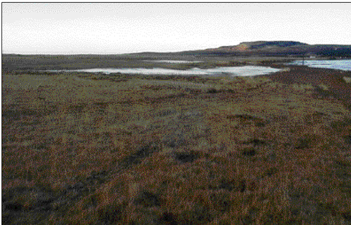
Mynd 5. Eyrar. Horft í norðvestur.

staða. Teknar voru myndir þar sem það átti við og skráð það sem fyrir augun bar.