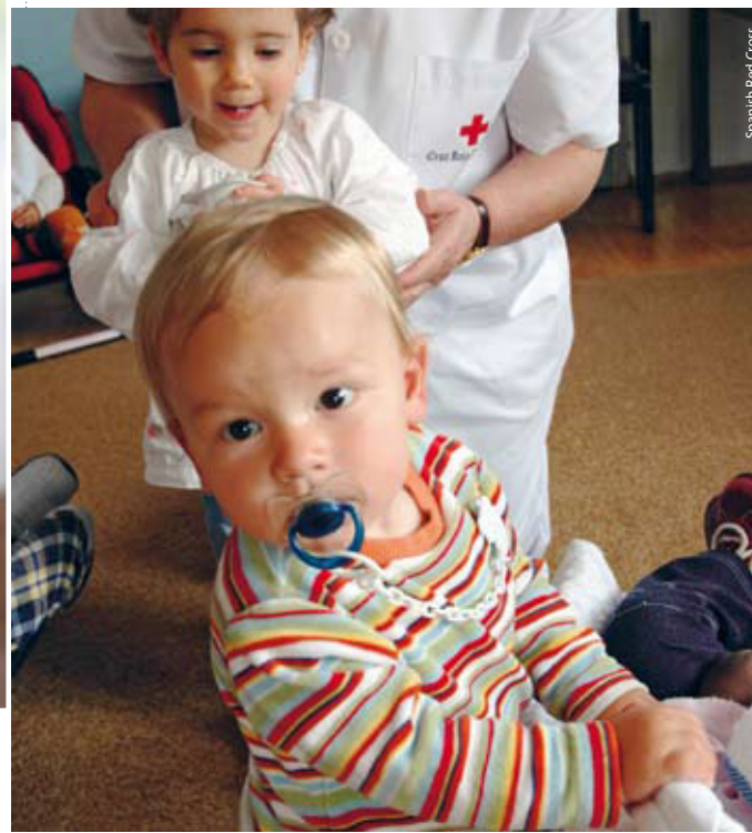
Spanish Red Cross

samræmi við grundvallarmarkmið okkar og mannúðargildi endurspeglar samsetning og starfsemi landsfélagsins fjölbreytni samfélagsins og hefur innan sinna vébanda fulltrúa hópa sem eiga undir högg að sækja. Við keppum að jafnrétti í öllu okkar skipulagi og starfi og gætum þess sérstaklega að hvergi sé að finna misrétti af nokkru tagi hvað varðar laun og kjör, aðgengi að þjónustu eða töku ákvarðana. Við beitum sömu aðferð út á við til að hvetja til samskipta á milli ólíkra menningarheima og samstöðu innan samfélaga og á milli þeirra. Landsfélögin taka höndum saman með stjórnvöldum í sínum löndum til að kynna og virkja alþjóðleg mannúðarlög sem sett eru með stuðningi og þátttöku ICRC og Alþjóðasambandsins. Þetta gerum við með fræðslu og þjálfun sem sniðin er sérstaklega að þörfum ólíkra hópa. Við veitum vernd þegar þörf er á og nýtum sálfélagsglegar aðferðir til að hafa áhrif gegn ofbeldi þar sem þess er þörf. Við gefum þéttbýlinu sérstakar gætur. Þar getum við byggt upp þekkingu og hæfni til að þekkja siði og venjur sem útiloka og aðskilja fólk og beitt samskiptakunnáttu okkar til að takast á við slík mál með samræðum og lipurð.