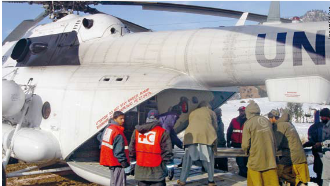
American Red Cross