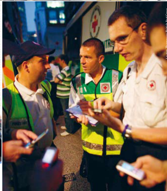
Layton Thompson/British Red Cross

herðar félögum að þau taki til rækilegrar skoðunar óskir ríkisvaldsins um þátttöku í mannúðarstarfi sem fellur undir hlutverk þeirra. Ríkisvaldið skal forðast að gera kröfur til félagsins sem væru í andstöðu við grundvallarmarkmið eða stofnskrá Alþjóðahreyfingar Rauða krossins og Rauða hálfmánans. Landsfélögum er skylt að synja öllum slíkum óskum og stjórnvöld þurfa að virða slíkar ákvarðanir. Ríkisvaldinu er einnig óheimilt að hafa afskipti af starfsemi landsfélagsins, vali verkefna og forustumanna og breytinga á félagslögum.