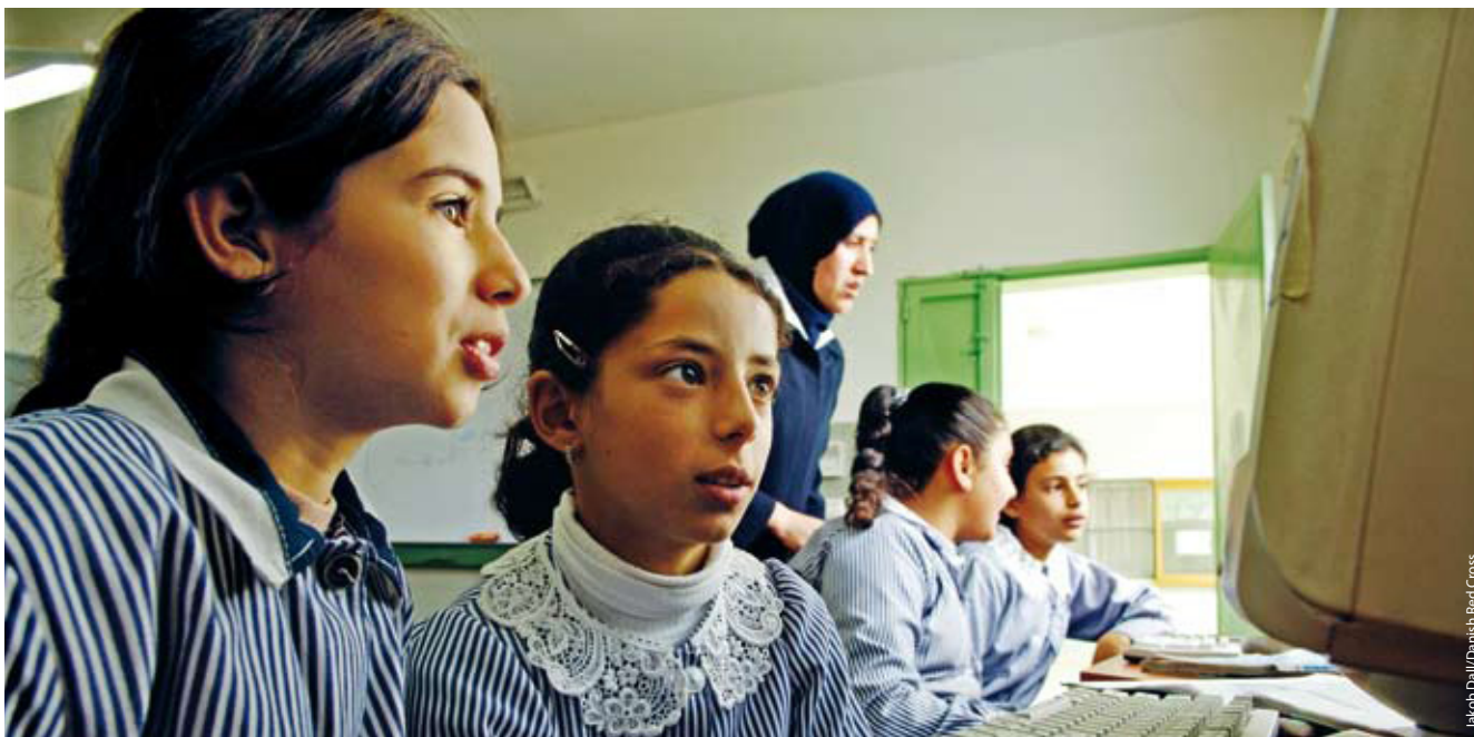
Jakob Dall/Danish Red Cross

beitum okkur fyrir greiðari aðgangi að heilbrigðis- og félagslega kerfinu.