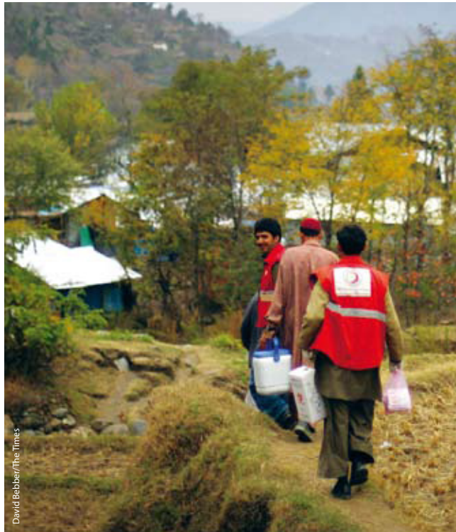
David Beaber/The Times

Gott heilsufar – þ.e. andleg, líkamleg og félagsleg vellíðan – gefur okkur tækifæri til að njóta mannréttinda okkar til fulls. Verkefnum okkar á sviði heilbrigðismála er ætlað að draga úr varnarleysi einstaklinga og samfélaga. Hærrí meðalaldur, breytingar í mannfjöldaþróun, viðvarandi kynjamisrétti ásamt félagslegum og efnahagslegum breytingum og breyttu lífsmynstri margra – allt þetta hefur átt sinn þátt í umtalsverðri breytingu á útbreiðslu og hegðun sjúkdóma. Smitlausir sjúkdómar og smitlaust umhverfi mun hafa meiri áhrif í