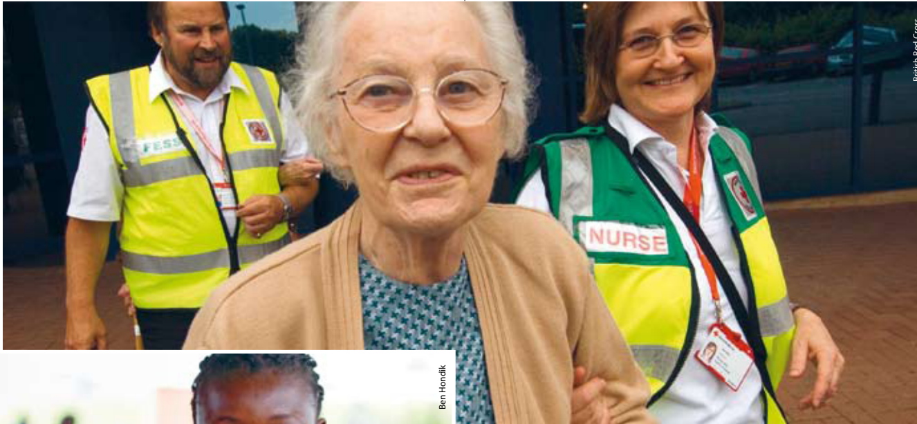
British Red Cross