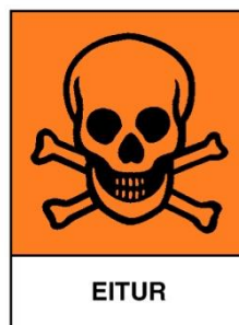
Mynd 3. Varnaðarmerki eiturefna

Eiturefni og bannvörur fundust í sex tilfellum. Sala á eiturefnum er háð sérstökum leyfum sem ekki voru fyrir hendi í þeim byggingavöruverslunum þar sem slíkar vörur fundust. Eiturefni eiga að vera merktar með eftirfarandi varnaðarmerki: