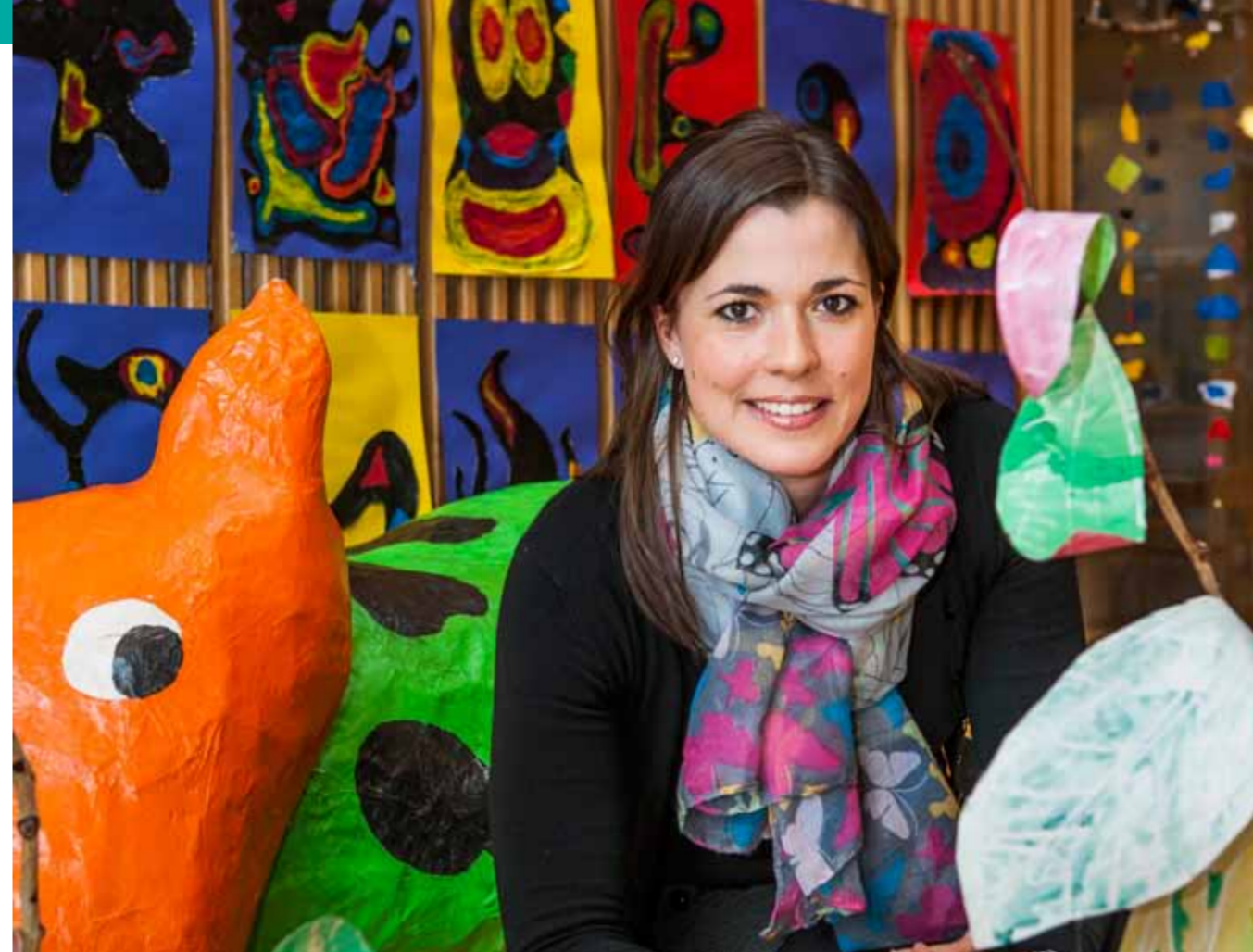
Hrafnhildur Sigurðardóttir: „Í þemum er kennarinn ekki með fyrirfram ákveðna hugmynd um hvernig hlutirnir eiga að vera.“