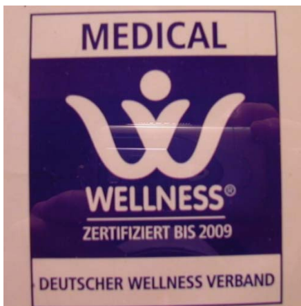
Mynd 8: Medical Wellness vottun á Termy Pałacowe

Af öllu því framboði sem finna má er mest með faglegu yfirbragði. Heilsuhótelin og þjónustu aðilar hafa allir frammi vottanir sínar. Flestir bera auðkenni hinna pólsku sjúkratrygginga enda á við um mikið af þjónustunni sem þarna er í boði að hún fæst bætt frá þeim eins og áður sagði. Aðrir hafa gæða- eða samstarfsvottun frá pólskum ferðamálayfirvöldum og einnig mátti sjá hina þýsku Medical Wellness vottun hjá stærstu þjónustuveitendunum (mynd 8).