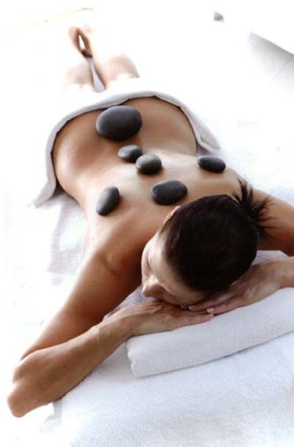
Mynd 9: Rómverskt svall og steinanudd Mynd: EHH, mars 2011, póstkort Spa Nałęczów

Vissulega má líta svo á að hluti vellíðunar sé lífsgleði og áhyggjulaus skemmtun, en nú verður eiginlega hver að meta fyrir sig hvað virkar og getur fallið undir hatt heilsuferðapjónustu.