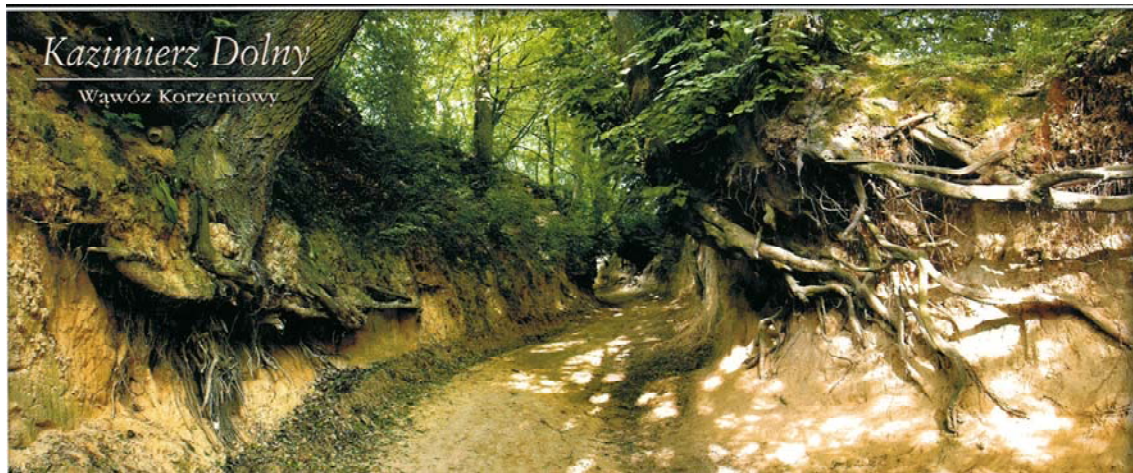
Mynd 13: Dæmigerð slóð í Kazimierz landslagsgarðinum