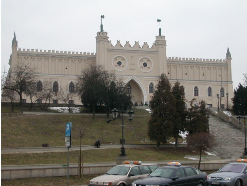
Mynd 11: Kastalinn í Lublin, heimar austurs og vestur mætast Mynd: EHH, mars 2011

heims og vestræna (mynd 11), enda borgin rétt við úkraínsku landamærin og miðja hins pólska konungsveldis sem var á miðöldum. Um borgina eru merktar og skilgreindar gönguleiðir með ólíkum þemum. Þar er til að mynda í boði gönguleið um slóðir gyðinga sem bjuggu í borginni fyrir stríð og allt frá 15. öldinni. Það eru einnig gönguleiðir um slóðir konunga og helgra manna.