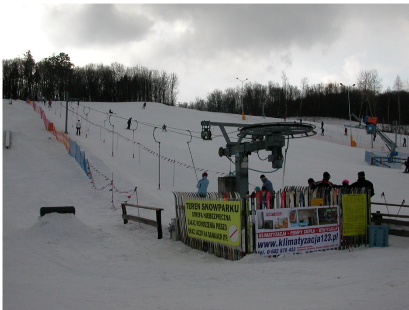
Mynd 14: Skíði í Rąblów

Í garðinn sækja íbúa Varsjá og Lublin til afþreyingar í náttúru og til að fara í bæinn Kazimierz Dolny (sjá neðar). Á veturna er hægt að fara á skíði í garðinum (mynd 14) en á sumrin nýtur fólk þeirra skilgreindu gönguleiða sem nefndar voru hér að ofan.