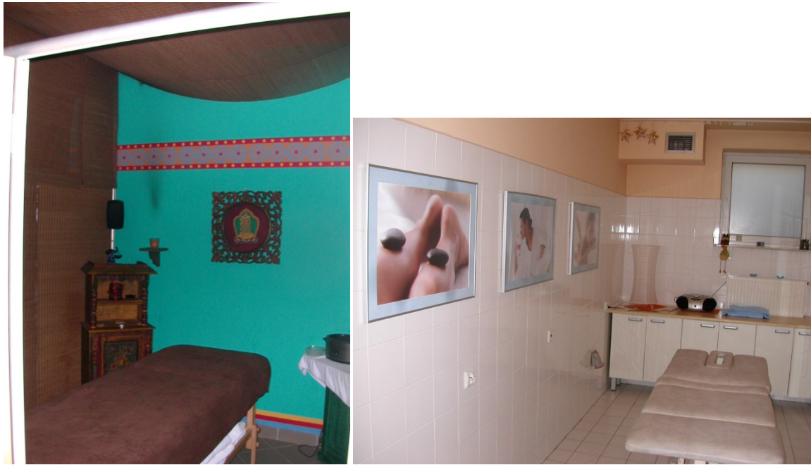
Mynd 4: Yfirbragð hins exótíska – hið hefðbundna óhefðbundna

Fyrir fall Sovétríkjanna var sú þjónusta sem er í boði á svæðinu rekin alfarið af ríkisstofnun. Þá var þjónustan miðuð að lækningum kvilla og ekki endilega mikið lagt uppúr hlýlegheitum eða andrúmslofti. Furðuleg samsuða muzak og pólskra sjónvarpsstöðva sem sýna helst The Bold and the Beautiful lesið yfir á pólsku yfir daginn, gefur hálf undarlegt yfirbragð sérstaklega þegar það er í eldri húsum frá Sovét tíma, skreytt með vísunum í óhefðbundnar eða austurlenskar lækningar. Dæmi um þetta, sem mögulegt að miðla með myndum hér, er yfirbragð á þeim herbergjum eða klfum sem þjónustan er boðin (mynd 4).