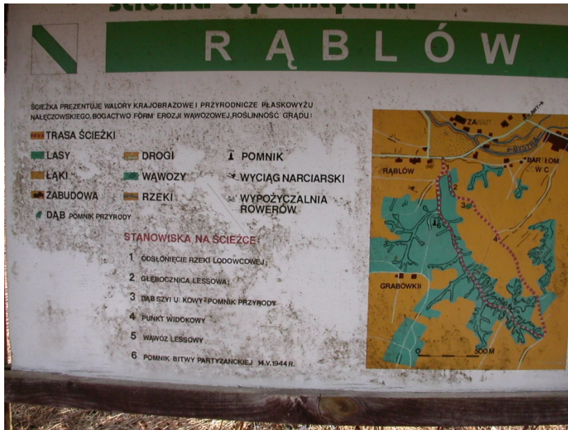
Mynd 12: Upplýsingaskilti við upphaf gönguleiðar í Rablów

Þegar kemur að heilsu og vellíðan er gestum boðin ráð um hvernig bæta megi heilsu sína beint með því að nýta sér stafgöngutækni og hægt er að fá stafi leigða og leiðsögn með. Allar leiðir eru skýrt afmarkaðar, merktar á kort og skoðunar og útsýnisstaðir skilgreindir og sagt frá hvað er þar markverðast að sjá (mynd 12).