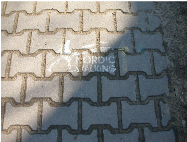
Mynd 6: Stafgönguleið

Jafnvel þó að þjónustan sem boðin er til heilsu og vellíðunar á svæðinu sé í fögrum garði með úrvali gönguleiða er ekki gert mikið úr náttúru garðsins, en þess í stað vísað á Kazimierz landslagsgarðinn og þangað er fólki beint, eins og nánar verður vikið að síðar. Þjálfarar og læknar á svæðinu ráðleggja þó sumum að fara í stafgöngu og mátti finna merкта leið um svæðið á stígum ef mjög grannt var skoðað (mynd 6). Á svæðinu er leikvöllur fyrir börnin, lítill og falin bakvið eina bygginguna, sem kemur á óvart þar sem mikið er þarna um fjölskyldufólk. Það er þó mest að nota sér laugarnar sem eru innanhúss.