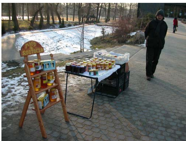
Mynd 3: Sulta og hunang frá svæðinu til sölu.

Líkt og með drykkjarvatnið, sem nú er hvergi að sjá, er ekkert gert úr matvöru eða því sem svæðið hefur sérstaklega uppá að bjóða ef frá er talin náttúran sem síðar verður vikið að. Lækningar eða meðferðir sem voru til sölu í stofnunum fyrirtækisins á svæðinu byggðu ekkert á hefðum heimafólks né átti sér sögulega skírskotun. Þar sem ekki var þögn sem þjónaði tilgangi þeirrar meðferðar sem var í boði ómaði hefðbundið muzak og á sjónvarpsskjáum í biðrymum eða anddyrum hótela var dagskrá pólsku sjónvarpstöðvanna hverju sinni í boði. Einn maður var þó að selja hunang og sultur frá svæðinu fyrir framan laugarnar í Atrium (mynd 3). Þegar rætt var við hann var hann með á hreinu gegn hvaða kvillum hver tegund hunangs var sem hann var með í boði.