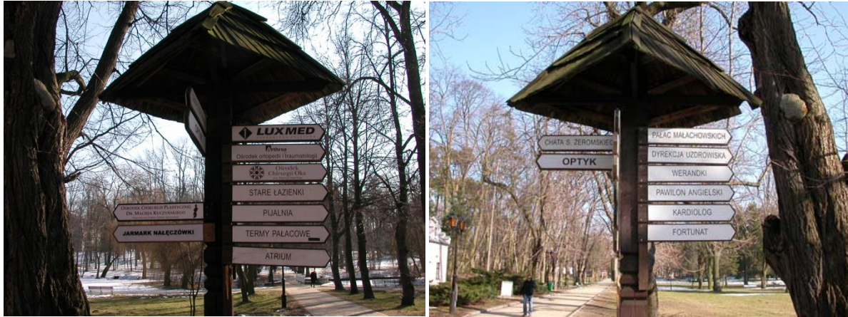
Mynd 7: Hvert skal halda til að leita bót sinna meina