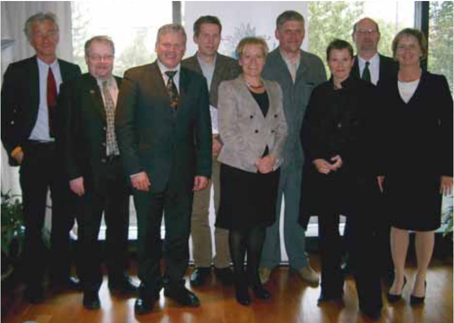
Utanríkisráðherra með háskólarektorum

Haustið 2007 efndu íslensk stjórnvöld í samvinnu við alla háskóla landsins til fundaraðar um stöðu Íslands á alþjóðavettvangi - erindi og ávinning. Markmiðið með fundaröðinni var að hvetja til upplýstrar samræðu um alþjóðamál í þjóðfélaginu. Fjallað var um stöðu og hlutverk Íslands á alþjóðavettvangi og um einstök mikilvæg verkefni eins og hugsanlega þátttöku Íslands í öryggisráði Sameinuðu þjóðanna. Tillögur að fundar- og umræðuefnum komu frá háskólunum. Einnig var efnt til málstofa og vinnustofa með þátttöku fræðimanna, nemenda og sérfræðinga á sviði utanríkismála.