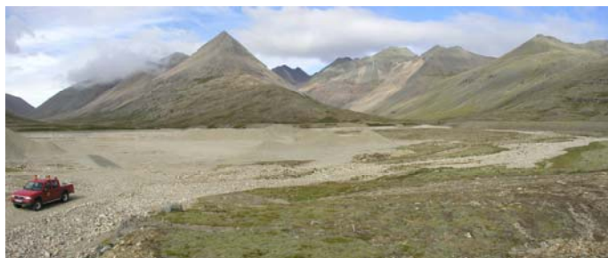
Mynd B.9. Náma 9 er í mynna Slaufprudals sem sést á miðri mynd. Náman er í notkun og eru malarhaugar í henni.