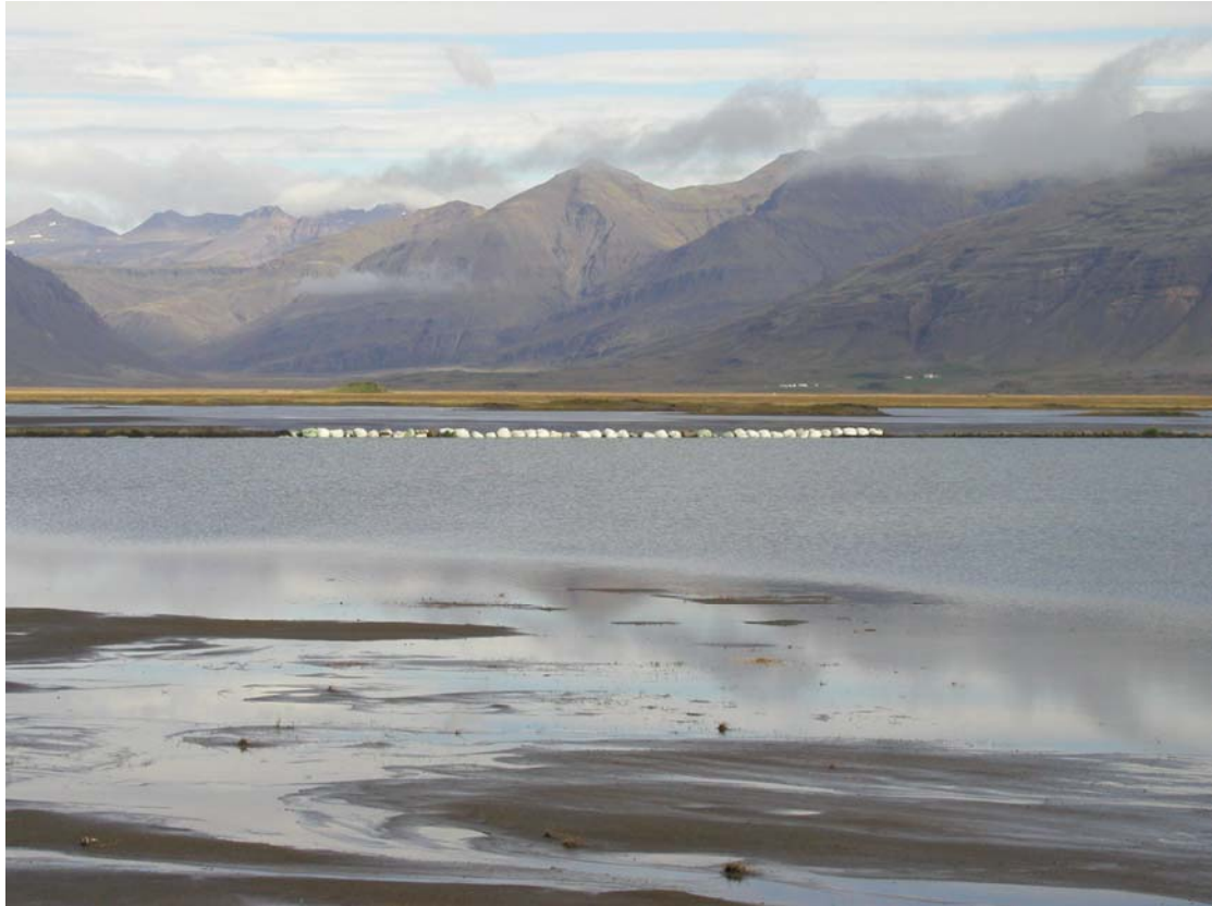
Mynd 4. Varnargarðar fyrir norðan Skógey. Gamlar heyrúllur notaðar til að hindra að vatn flæði inn á gróin svæði.