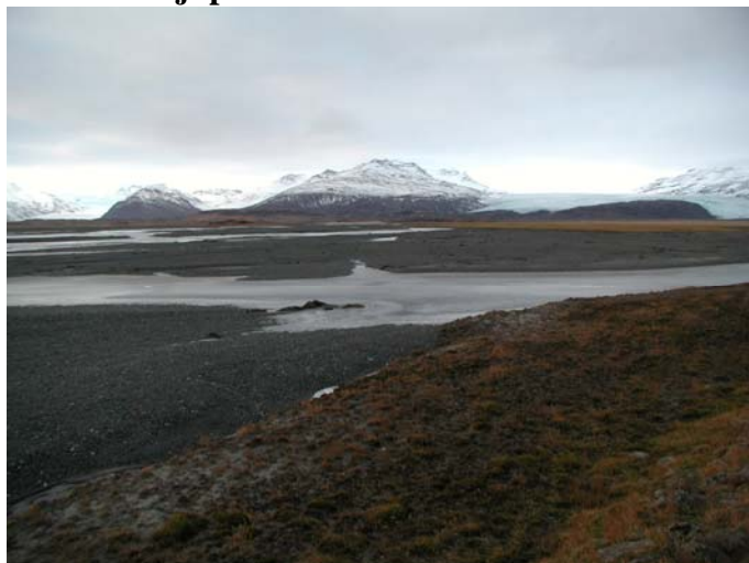
Mynd B.2. Áreyrar Djúpár

Áætluð efnistaka er í ógrónum áreyrum Djúpár.