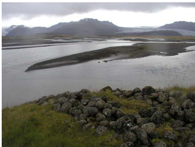
Mynd B.1. Hólmsá

Náma 1 er í lítt grónum áreyrum og árfarvegi Hólmsár.