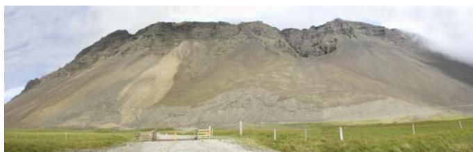
Mynd B.7. Friðsæld, náman er í skriðum og aurkeilu. Burðarlag verður tekið í skriðum vinstra megin en fyllingar í aurkeilu hægra megin á myndinni.