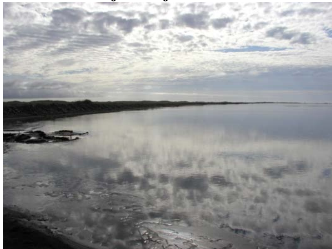
Mynd B.5. Hornafjarðarfljót, horft niður með Skógey. Efnistaka mun fara fram í farveginum.