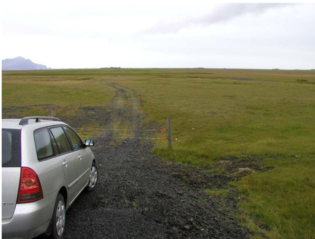
Mynd 2. Mýrar, Vesturhorn í baksýn til vinstri. Land er almennt flatt og gróið.

Berggrunnur á Mýrum er myndaður af basískum eða ísúrum hraunum frá tertíer, eldri en 3,1 milljón ára (Helgi Torfason, 1985). Berggrunnurinn er að mestu hulinn jökulaurum/söndum en þó má víða sjá klapparholt upp úr jökulaurunum. Holtin eru jökulsorfin auk þess sem sjór hefur slípað þau til (Hjörleifur Guttormsson, 1993). Þar sem holtin standa hærra í landi hefur búseta á Mýrunum verið að mestu bundin við þau því þar er ekki hættu af flóðum (Jóhanna Katrín Þórhallsdóttir & Rannveig Ólafsdóttir, 2004).