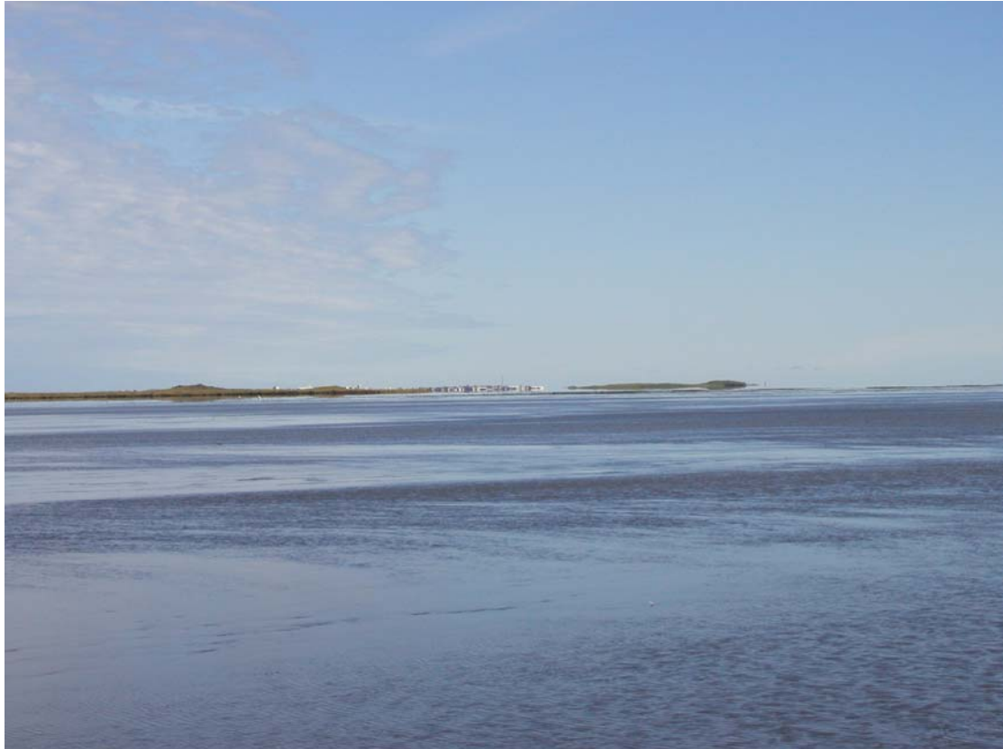
Mynd 3. Horft yfir Hornafjarðarfljót, Skógey og Höfn í baksýn.