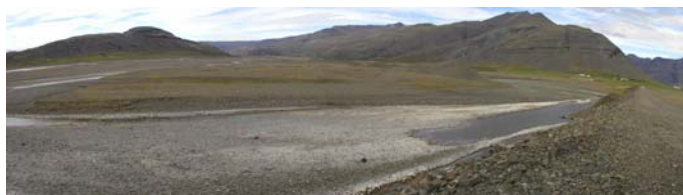
Mynd b.4. Austurfljót. Horft upp með farvegi Austurfljóts.