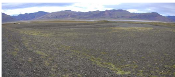
Mynd B.3. Grjótá

Efri myndin sýnir efnistöku svæðið fyrir ofan veg en sú neðri sýnir efnistökusvæðið fyrir neðan veg.