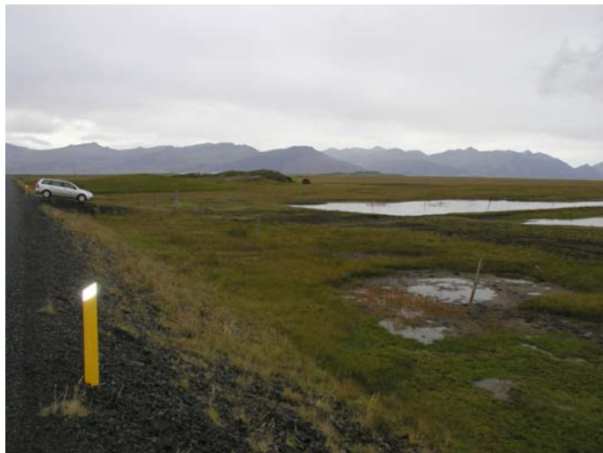
Mynd B.10. Náma 10 er á flötu landi fyrir miðri mynd. Tjörn sem er við veginn eru leifar af gamalli efnistöku.