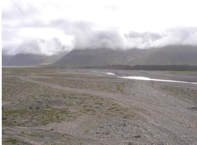
Mynd B.8. Áreyrar Fjarðará, að mestu ógrónar.