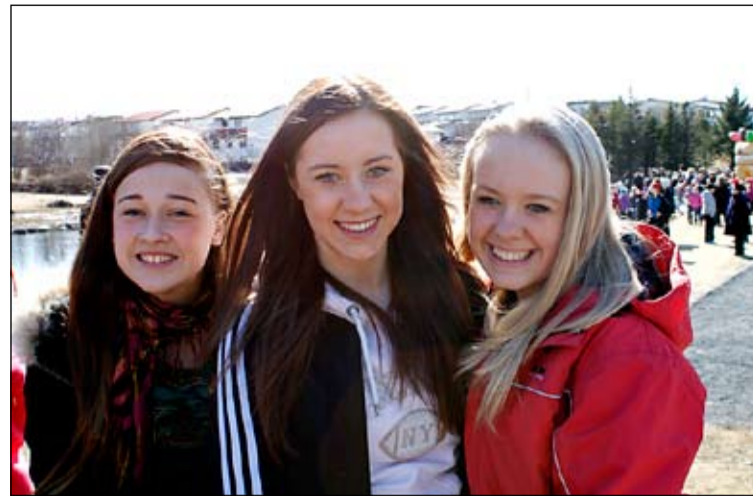
Margt verður um að vera fyrir tíu til tólf ára í sumar.

og ævintýraviku og munum við meðal annars fara í origami og leiki, hjólaferð á Vífilfell, helluferð, sund í Álftaneslaug og hafa sérstakar stelpu- og strákasmíðu. Nánari upplýsingar á midberg.is og holmasel.is. Skráning er hafin á Rafrænni Reykjavík.