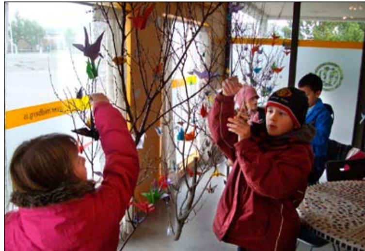
Börn frá Vinaheimum að setja friðatrönur á tréið í Miðbergi.