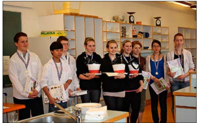
Hluti verðlaunahafa með verðlaunagripum.