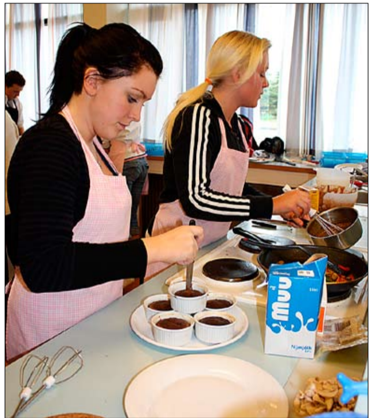
Einbeitingin við matargerðina leynir sér ekki.