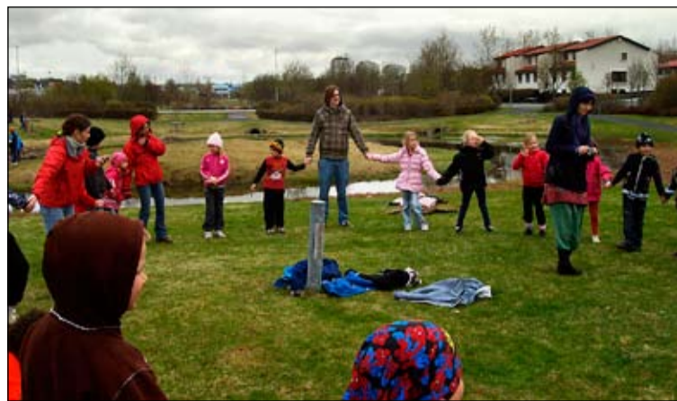
Hópleikur á stórleikjadegi frístundaheimilanna.

Einnig þá stóðum við fyrir flísalistaverki í samvinnu við Breiðholtslaug. Listaverkið fékk nafnið Forvitni veggurinn og var öllum boðið að koma og skrifa spurningar á flís sem síðan voru festar á þar til gerðan vegg. Þetta gekk svona ljómandi vel og eftir stendur þetta flotta listaverk sem verður til sýnis í sundlauginni út maí. Frístundaheimilin voru með sameiginlegan stórleikjadag. Þar komu öll börnin úr frístund saman á grasflötinni við Hólmasel. Var mikið fjör í skemmtilegum leikjum og svo voru grillaðar pylsur. Börnin gengu á milli leikja og fengu sér pylsur á milli stöðva.