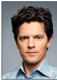
Dagur B. Eggertsson.

Dagur B. Eggertsson skipar fyrsta sæti á lista Samfylkingarinnar í Reykjavík.