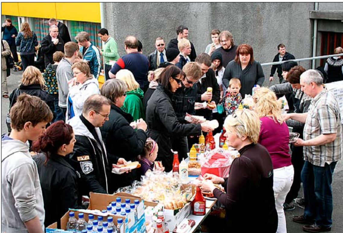
Nemendur og gestir nutu veitinga undir berum himni – að sjálfsgöðu var efnt til pylsupartýs við skólann í tilefni dagsins.