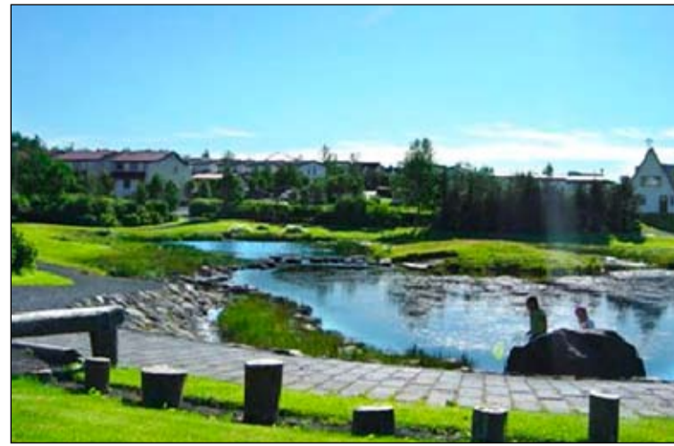
Sumarfeegurð í Breiðholti.