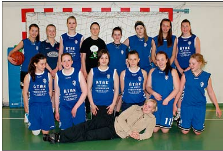
Körfuboltastelpurnar með Bonny þjálfara sínum.

Komdu í Gróðrarstöðina Stord og njóttu svo sumarsins í litríkum blómagarði heima.