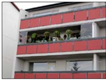
Nokkurra fermetrar svalagarður staðsettur á svölum á 2. hæð í fjölbýlishúsi við Vesturbergi 54.

Breiðhýltingar eru almennt mjög ánægðir með hverfið sitt enda er það umlukið einstaklega fallettri náttúru og hefur yfir að ráða meiri