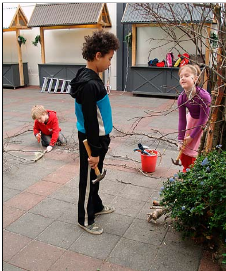
Með smíðatól við undirbúning opunarinnar í Mjóddinni.