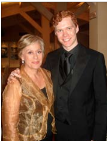
Ég og Dame Kiri Te Kanawa á Ítalíu 2009.