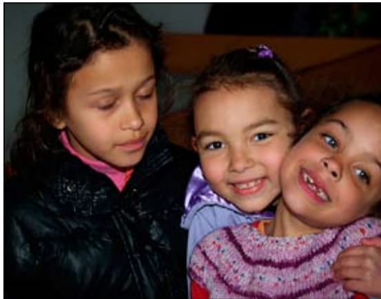
Fjölmening setti einnig svip á hátíðina.