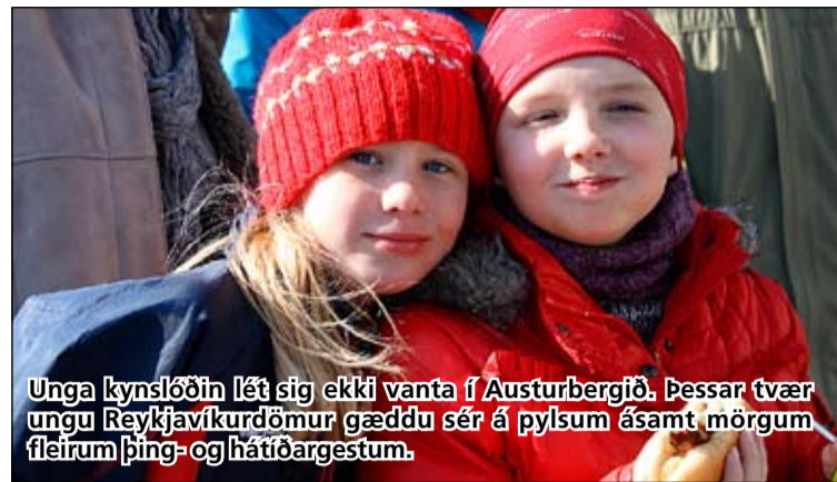
Unga kynslóðin lét sig ekki vanta í Austurbergið. Þessar tvær ungu Reykjavíkurdömur gæddu sér á pylsum ásamt mörgum fleirum þing- og hátíðargestum.

Breiðhylltingar og aðrir Reykjavíkurbíngar fjölmenntu í Austurbergið til þess að leggja lokahönd á stefnuskrá Samfylkingarinnar fyrir komandi borgarstjórnarkosningar en ekki síður til þess að taka þátt í sannkallaðri fjölskylduhátíð. Leikjadagskrá var fyrir börnin allan daginn, skottmarkaður á bílaplaninu, ýmis skemmtiatriði á sviðinu og pylsuparty í lokin.