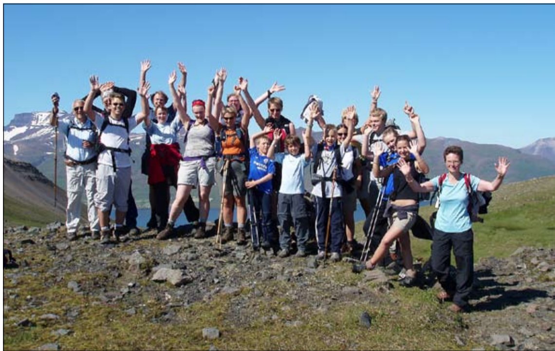
Sumarleyfisferðir FÍ eru alltaf vinsælar og má þá einu gilda um hvaða slóðir förinni er heitið.