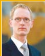
Frímarr Andrésen útfararþjónusta