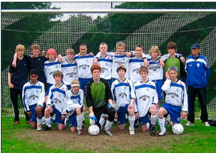
Skotlandsferð 3. flokks ÍR sumarið 2004. Ég í fremri röð fyrir miðju.

Það vildi mér til nokkurs happs að ég fann mér snemma áhugamál sem ég sinnti fram eftir öllum aldri meðfram söng-