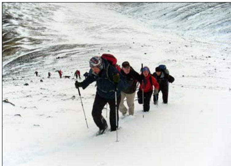
Að undanförunu hefur verið bryddað upp á ýmsum nýjungum í félagsstarfinu.

Grunngildin í starfi FÍ eru fjögur, að sögn Páls, það er skipulagning ferða, útgáfa rita um land og leiðir, rekstur skála víða um landið og í fjórða og síðasta lagi náttúruvernd í sinni víðustu merkingu. Sjálfböðaliðastarfi er burðarásinn í starfi FÍ. Hópar röskra félaga sinnir ýmsum verkefnum á vettvangi félagsins, svo sem viðhald skála, merkingu gönguleiða, fararstjórn að nokkru leyti og þannig mætti áfram telja.