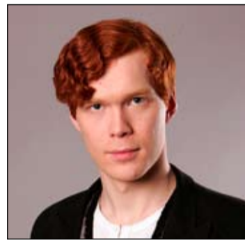
Nýleg mynd – eins og ég er í dag.