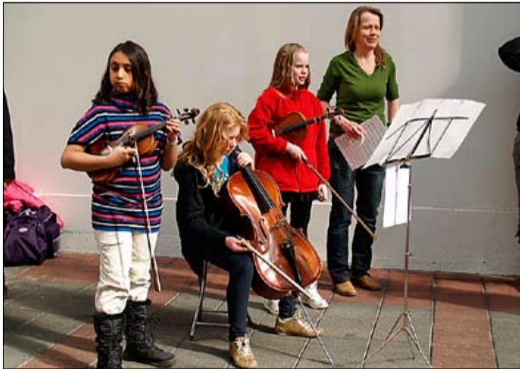
Nemendur Waldorfsskólans Sólstafa sýndu gjörning og léku á hljóðfæri í tilefni af opnuninni.

samstarfsverkefni sínu með Þorgrími Þráinssyni í Ráðhúsi Reykjavíkur. Mikill tónlistardagur var í Fellaskóla á föstudeginum sem hófst kl. 9.00 með því að 4. bekkur bauð öllum 4. bekkjum í Ölduselsskóla og Hólabrekkskóla á tónleika sem voru haldnir í hátíðarsal skólans og nemendur í myndmenntavali Hólabrekkskóla sýndu samvinnuverk í Lista-