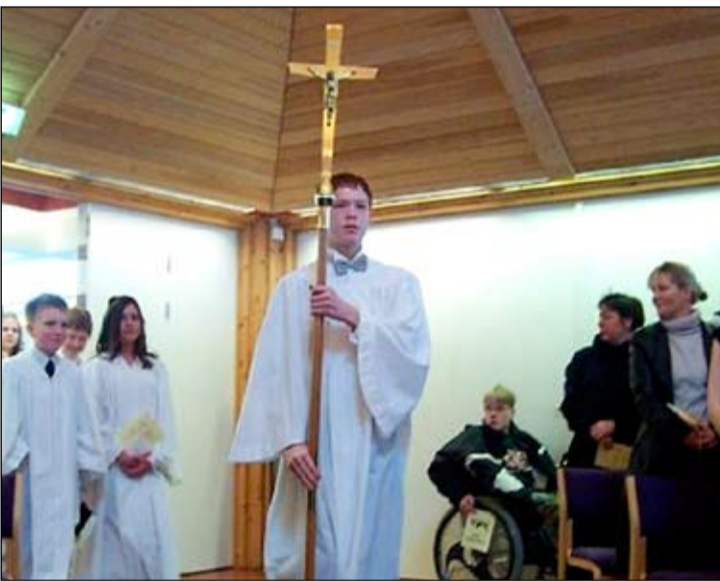
Ferming í Seljakirkju 30. mars 2003.

um. Ég fór snemma að taka þátt í fótboltaæfingum hjá ÍR. Eftir skóla var oft haldið niður í ÍR og stundum dvalið þar það sem eftir var dagsins. Ég man að á meðan ekki var komið gervigras á ÍR völlinn fórum við upp á Leiknisvöll í Fellahverfinu til þess að æfa. Það var ekkert verið að slá slöku við þótt æfingaaðstaðan væri ekki upp á það besta. Ég segi að fótboltinn hafi orðið mér til happs vegna þess að í honum eignaðist ég félagi og vini og fékk líka minn skerf af hreyfingu