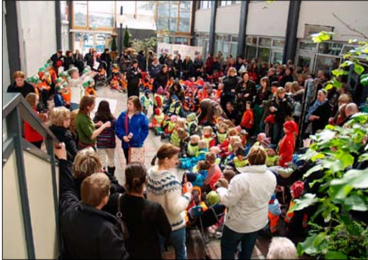
Fjöldi fólks kom í göngugötuna í Mjóddinni þegar myndlistarsýning barnanna í Bakkahverfi var opnuð. Myndir frá barnamenningarhátíð. ÁHG.

Fjórði bekkur Fellaskóla fjölmennti í skrudgöngu undir fjólubláum lit kl. 10 á mánudag. Á þriðjudag voru nemendur í 7. bekk skólans með kynningu á