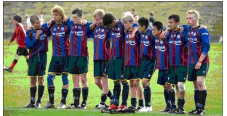
Leiknismenn í Svíþjóð. Myndin var tekin fyrir tveimur árum.

Ætlað er að keppendur frá Leikni verði á bilinu 60 til 70 talsins á aldrinum 13 til 19 ára. Leiknir sendir til leiks bæði stúlkna og stráka lið til mótsins. Þetta verður í 6 skipti sem Leiknir sendir lið til leiks á mótið. Viljum við því biðla til Breiðholtsbúa að taka vel á móti krökkunum í Leikni þegar þau selja fjáröflunaryörur til styrktar þessari ferð.