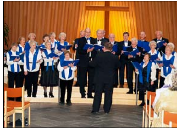
Gerðubergskórinn tók lagið á vetrarlokahlátidinni í Breiðholtskirkju.