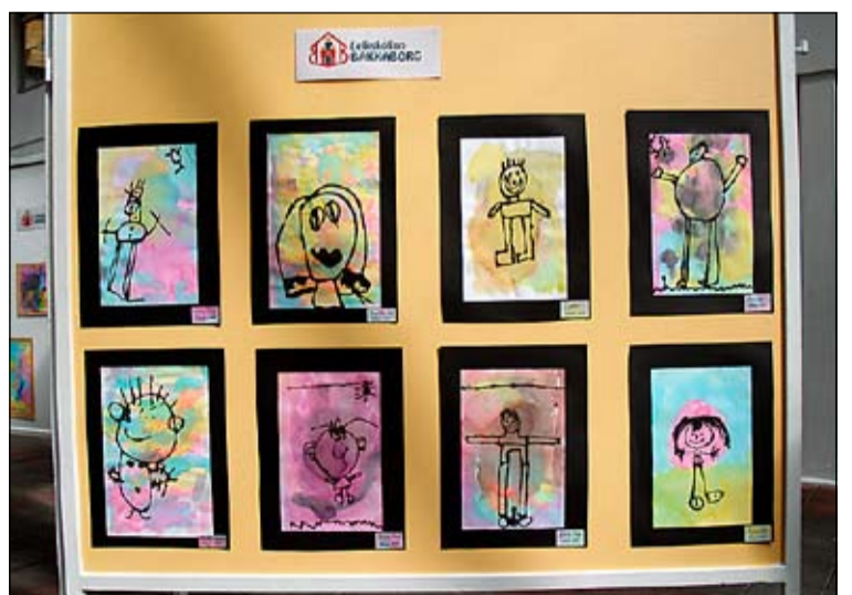
Myndir eftir börn úr Bakkaborg.