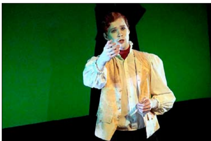
Ég í nemendasýningu í Íslensku Óperunni í febrúar 2010.