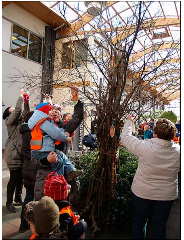
Börnin skreyta tré í göngugötunni í Mjódd.