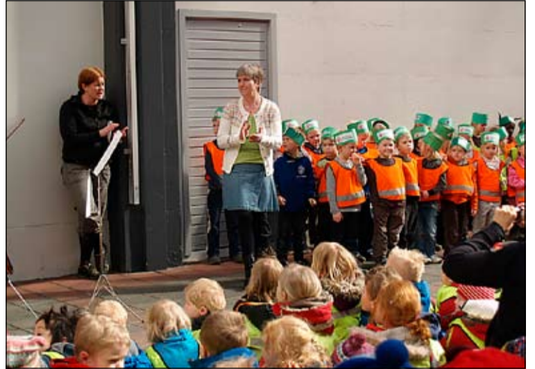
Leikskólabörnin höfðu gert sér höfuðbúna í tilefni dagsins.

Leikskólinn Hólaborg stóð ásamt fleiri leikskólum og í samstarfi við Tónskóla Sigursveins að skemmtun sem fram fór í Háskólabíói 21. apríl. Leikskólarnir Hólaborg, Hraunborg og Suðurborg efndu til listsýningar barna í Verslunarmiðstöðinni Hólagarði sem opnaði þann 20. apríl og síðan má nefna forvitna vegginn sem er flísalistaverk í Breiðholtslaug. Veggurinn varð þannig til að gestum og gangandi var boðið að koma við í lauginni og skrifa niður setningu um málefni sem líklegt væri til að vekja forvitni á þar til gerðar flísar. Flísarnar voru síðan límdar á sérstakan vegg í kaffisal sundlaugarinnar þar sem hægt var að fylgjast með forvitna flísaveggnum í sköpun. Af öðru athyglisverðu sem börn í Breiðholtinu stóðu að á barnamenningarhátíð má nefna tónleika Listasmiðjunnar Litrófs í Fella- og Hólakirkju 21. apríl en Listasmiðjan Litróf er hluti af innflytjendastarfi kirkjunnar. Félagsmiðstöðin í Hólmaseli stóð fyrir leikjamenning barna á sumardaginn fyrsta þar sem farið var í ýmsa leiki, þar á meðal brennibolta, fót-bolta, kyló, kött og mús, hlaupið í skarðið, stórfiskaleik, fram fram fylkingu, fallna spýtu, eitur í flösku, 1, 2, 3, 4, 5 dimmalimm, snú snú og fleiri klassíska barnaleiki. Á heimsdegi barna í Gerðubergi var gestum boðið að upplifa ólíka menningarheima á skapandi og skemmtilegan hátt.