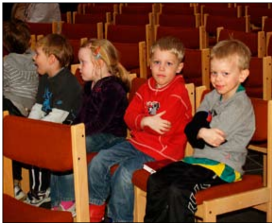
Yngri kynslóðin lét sig ekki vanta í Breiðholtskirkju enda er viðburðurinn ætlaður til þess að styrkja tengsl þeirra yngri og hinna eldri.