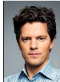
Dagur B. Eggertsson.

nýsköpunarsetur og ýmis önnur starfsemi byrji í húsnæði sem stendur autt. Tómt húsnæði er tómt bull. Og munum það að við eigum aldrei að setta okkur við atvinnuleysi á Íslandi.