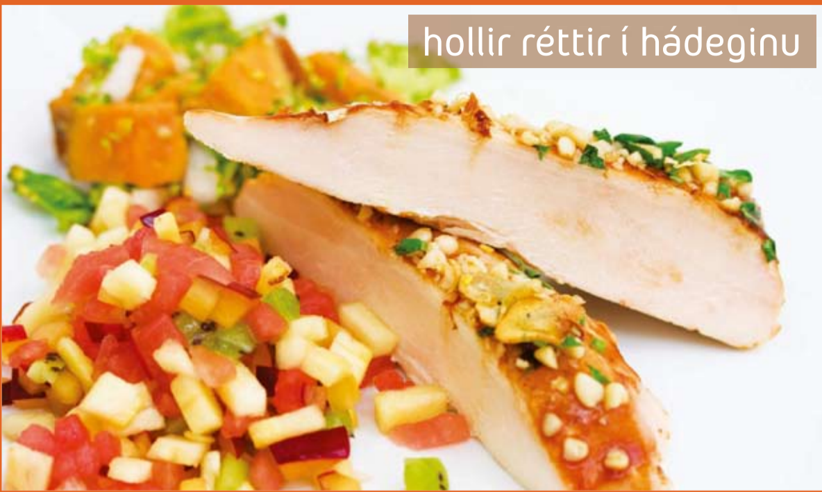
hollir réttir í hádeginu