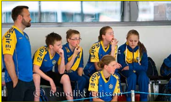
Í pásu á laugarbarminum.

Óhætt er að segja að þetta sundár hafi farið af stað með krafti hjá sundfélaginu Ægi. Það var metfjöldi skráninga í alla hópa og því aldrei verið fleiri við æfingar hjá félaginu og flestir hópar fullir.