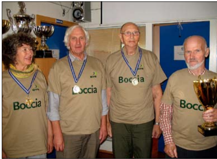
Á myndinni má sjá sigurvegarana, lið Gjábakka.

Mótið stóð yfir í rúma tvo tíma og að því loknu buðu ÍR leikmenn gestum upp á veitingar, allt heimatilbúið og fóru því allir saddir og sælir að heimsókn lokinni. Efstu þrjú sætin skipuðu Gjábakki 1.sæti og sitthvort lið Garðabæjar í 2. og 3. sæti. ÍR-ingarnir hafa stundað leikfimi í ÍR heimilinu í 2 ár með dyggri aðstoð borgarinnar og æft boccía samhliða því. Til samanburðar má geta þess að sumir andstæðinganna hafa keppt í hátt í 10 ár. Keppnisþrá er leyndi sér ekki svo ÍR-ingar koma enn grimmar til leiks að ári.