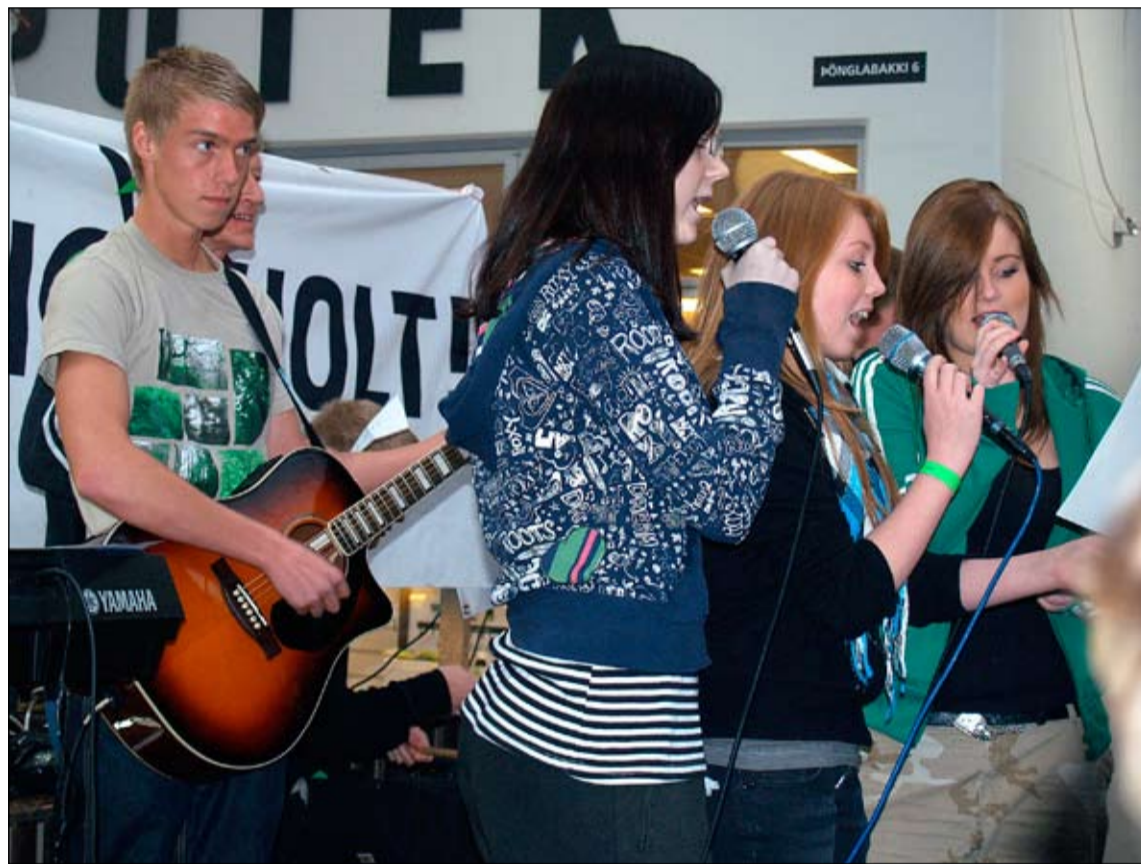
Þessi skemmtilega mynd var tekin í Hólabrekkuskóla á Breiðholtsdögum í fyrra þar sem ungmenni fluttu tónlistartriði.