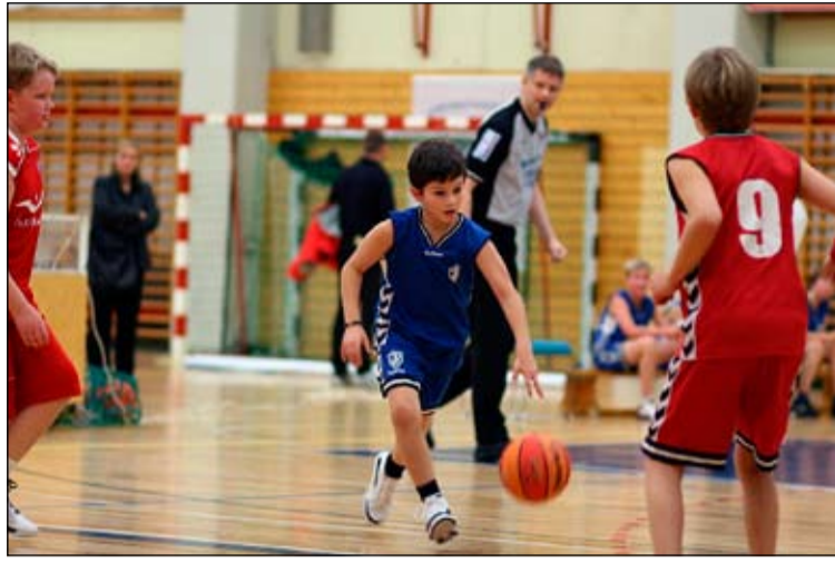
Glæsileg tilþrif sáust á mótinu.

Fyrri leikurinn á laugardegnum var gegn Val og þar leiddi ÍR nánast allan tímann en misstu leikinn í fullmikla spennu undir lokin, höfðu þó 42:40 sigur. Seinni leikurinn var gegn Þór Akureyri og þar varð niðurstaðan 51:34 fyrir ÍR. Á sunnudeginum voru svo tveir leikir, í þeim fyrri vannst sigur á ÍBV 46:33 og í síðasta leik mótsins var spilað við Hrunamenn þar sem ÍR sigraði 49:29. Mjög góður árangur hjá strákunum og niðurstaðan var sigur í riðlinum og það þýðir að liðið færast upp í B-riðil fyrir næsta mót sem haldið verður 20. til 21. nóvember.