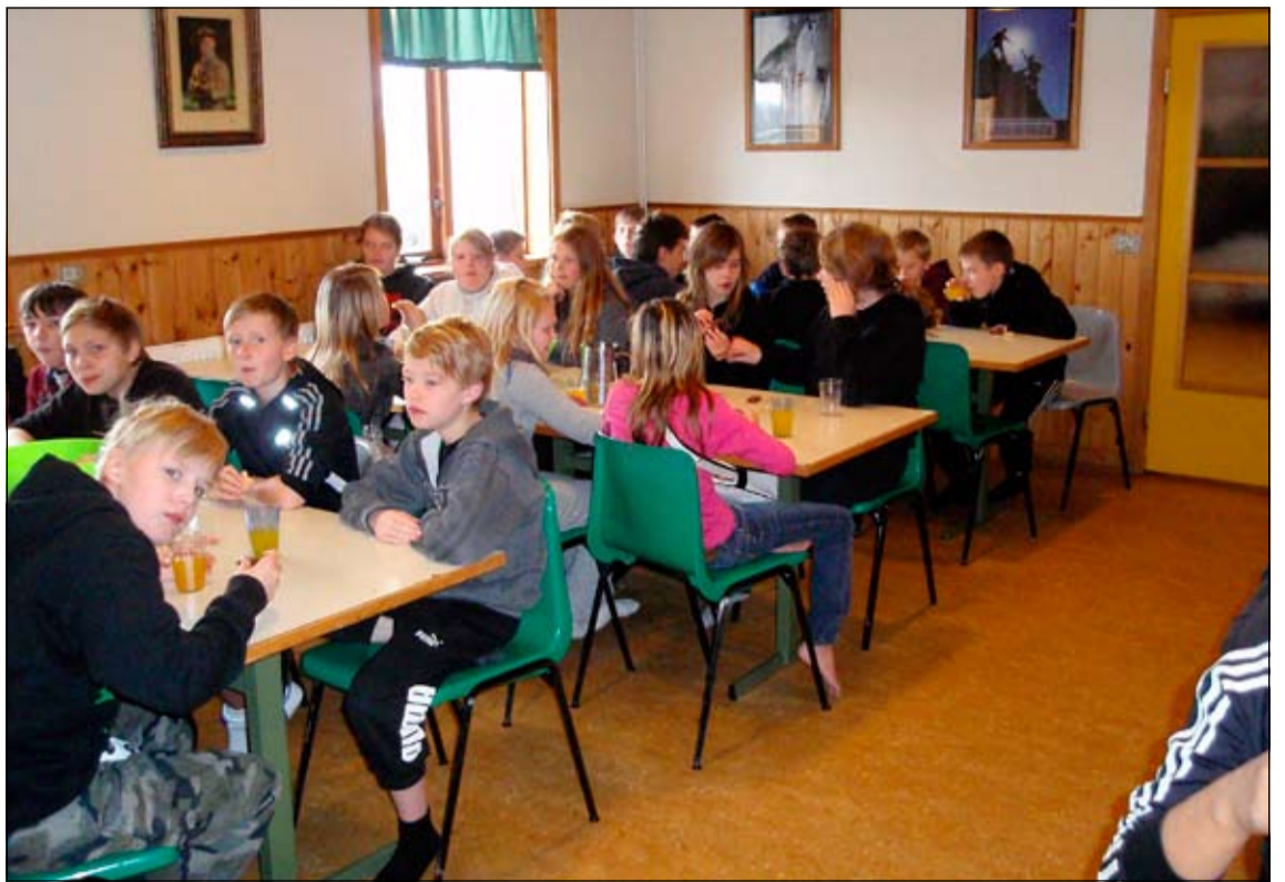
Frá félagstarfi úr eldribekkjum í Seljaskóla.