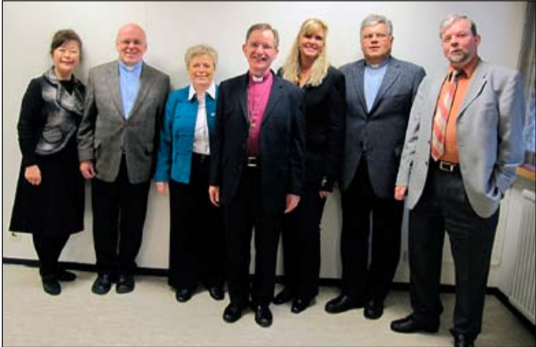
Karl Sigurbjörnsson, biskup heimsótti félagsstarfið í Gerðubergi á dögnum og er hér með prestum og öðru starfsfólki kirkjunnar og félagsstarfsins í Gerðubergi.

góða samstarf sem þróast hefur á milli félagsstarfsins í Gerðubergi og starfs eldri borgara í Fella- og Hólakirkju en það hófst 1990 með vikulegum helgistundum og sameiginlegum viðburðum. Þetta samstarf hefur því staðið í tvo áratugi.