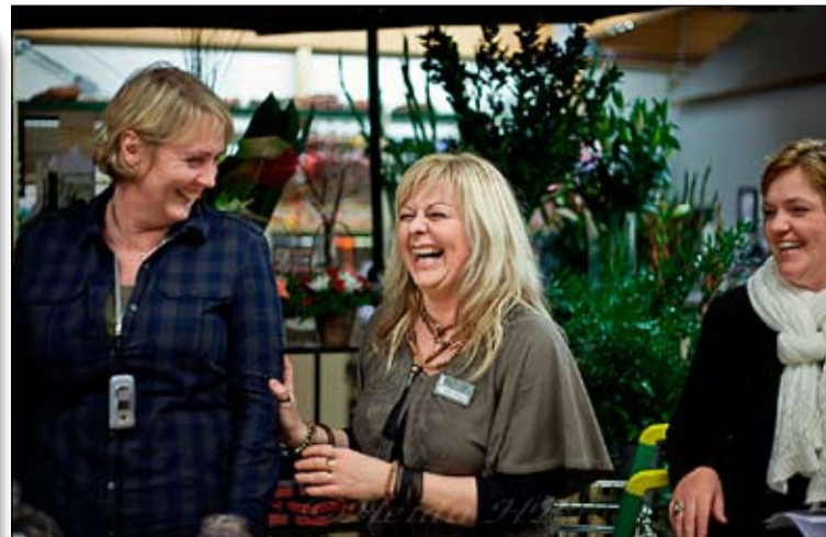
Konurnar skemmtu sér frábærlega eins og sjá má á þessari mynd.

Rosemount Road White verð 1.789 kr (hvítvín - Ástralía) Sítrónugult. Meðalfylling, þurr, ferskt. Suðrænn ávöxtur, mangó, melóna.