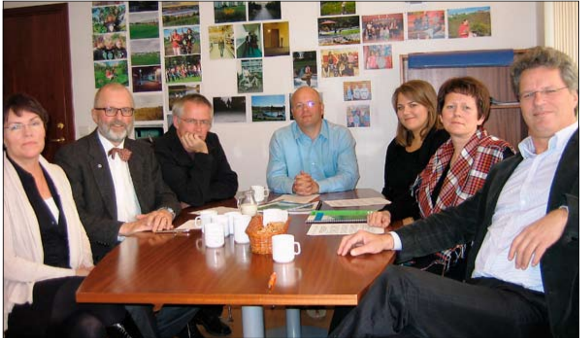
Myndin var tekin að undirritun samningsins lokinni

Gengið hefur verið frá samstarfssamningi á milli Heilsugæslunnar í Mjódd, Þjónustumiðstöðvar Breiðholts, Barna- og unglingageðdeildar LSH og Barnaverndar Reykjavíkur. Fyrirmynd samningsins er þverfaglegt samstarf við Heilsugæsluna í Efra Breiðholti sem hefur reynst afar vel síðastliðin tvö ár.