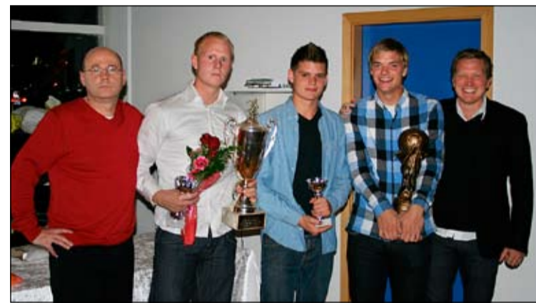
Verðlaunahafar meistaraflökks karla ásamt forráðamönnum.