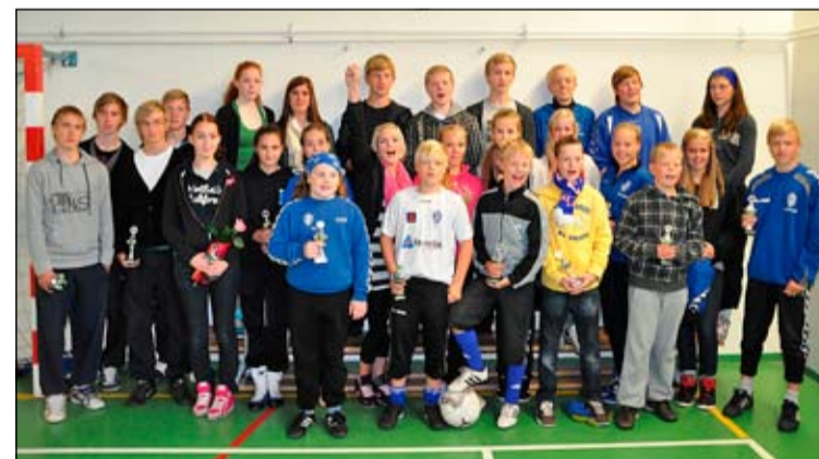
Verðlaunahafar yngri flokka.