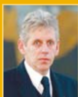
Guðmundur Baldvinsson útfararþjónusta