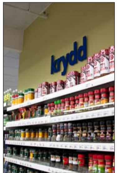
Í kryddhillunum í Nettó kennir margra grasa.

eftir sem lagt hafi verið upp með og varði þjónustu við viðskiptavininn. „Nettó er lágvörverslun á sama hátt og Krónan og Bónus og þótt verslunin hafi verið endurnýjuð frá grunni verður ekki hvikað frá þeirri stefnu. Við munum verða áfram með margskonar tilboð. Þau voru ekki bundin við opnunardaginn og ég held að ég geti lofað viðskiptavinum okkar því að þau verð hagstæð.“