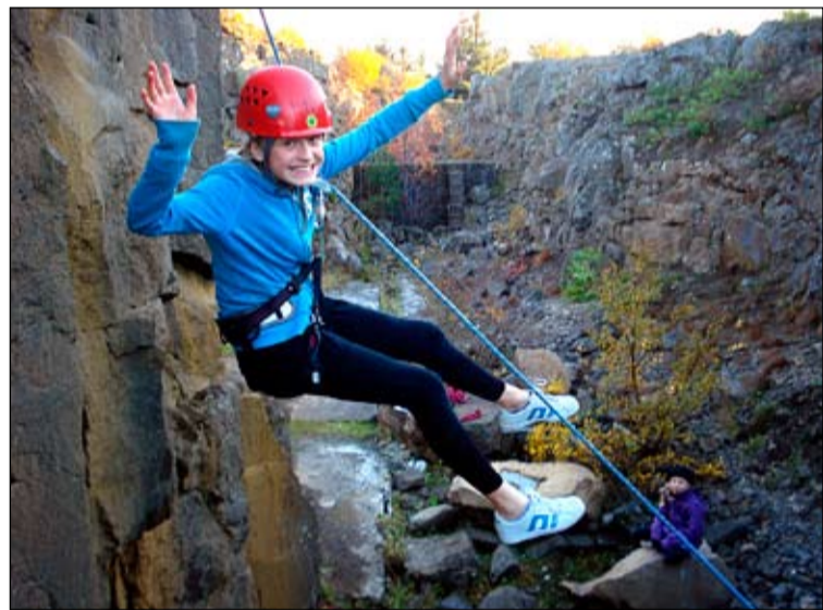
Klifur er hluti af þjálfun skáta. Hér er skátastúlka að klifra í Öskjuhlíðinni