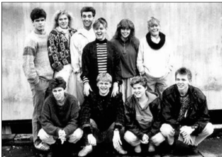
Nemendaráð FB veturinn 1986 til 1987.

Ég byrjaði í Ölduselsskólanum og það voru mikil viðbrigði að koma úr tveggja manna bekknum í Andakíl í þennan fjölmenna skóla þar sem allt að 30 krakkar voru í einum bekk. Þá kynntist maður því að þurfa að hafa fyrir stöðu sinni í bekkjarsamfélaginu. Ég man líka vel eftir því hvernig var að koma úr grónu umhverfi Hvanneyrar í ógróid Seljahverfið sem var í byggingu. Ekki var búið að malbika allar götur, engir göngustígar, flestar lóðir enn ófrágengnar og drulluflákar um allt. Þetta var eins og að fara alla leið á milli mjög ólíkra hluta. Ég lærði þó aldrei almennilega að nota gúmmístígvélina því ég var komin á þann aldur að þjatt-hugsun unglingsáranna hafði tekið völdin. Flauelsbuxur frá Karnabæ voru orðnar toppurinn í mínum tískuheimi. Þannig breyttist maður fljótt úr sveitadrengrum í borgarþarn. Ég stoppaði fremur stutt í Ölduselsskóla því á þessum árum var verið að byggja Seljaskólann og krakkar úr Engjaselinu fóru þangað. Ég og systir mín höfðum verið í leikskóla í Wales og þótt foreldrar okkar töluðu alltaf íslensku við okkur heima þá síaðist engin inn í barnshausinn þannig ég ólst upp við tvítyngi. Og framan af var engin mér eiginlega tamari. Ég sótti fremur í að lesa bækur á ensku en íslensku. Þetta breyttist með árunum og í dag held