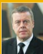
Þorsteinn Elísson útfararþjónusta