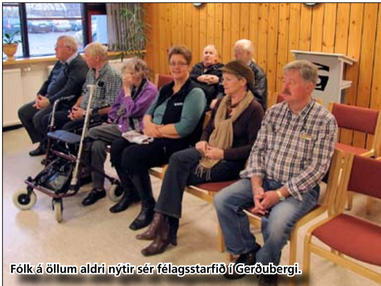
Fólk á öllum aldri nýttir sér félagsstarfið í Gerðubergi.

Nú er önnur kynslóðin og jafnvel sú þriðja farin að mæta í félagsstarfið. „Já - þetta tók strax við sér