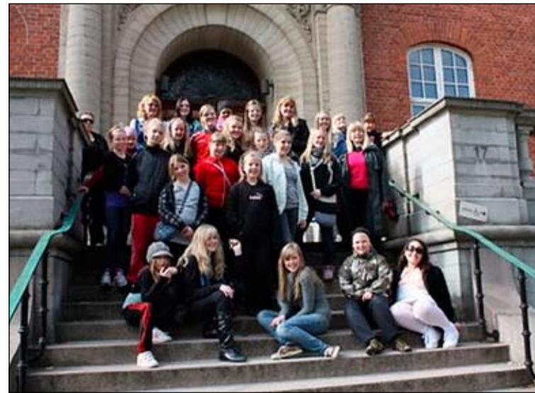
Svíðþjóðarfararnir á góðri stund.

4. – 6. bekk æfir frá klukkan 16 til 17, en eldri hópurinn, frá 7. bekk æfir kl. 17. Stúlkurnar úr hópnun eru flestar úr Breiðholtinu en nokkrar stúlkur úr öðrum hverfum hafa bæst í hópinn. Allir nýir þátttakendur eru innilega velkomnir í þetta skemmtilega starf. Það er ekkert þáttökugjald en greiða þarf fyrir æfingaferðir tvisvar á ári.