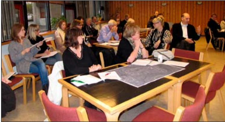
Nokkrir fundarmanna. Á fremsta borðinu má sjá kort af 111 Reykjavík.

athuga með að nýta svæðið bet- ur sem leiksvæði, hugsanlega með sparkvelli, þrautabraut, sem og fyr- ir skíði og sleða þegar er snjór, auk þess að nýta skíðasvæðið við Jafn- asel betur. Huga mætti möguleika á að koma þar upp snjóframleiðslu í ljósi þess hversu lítið hefur snjóað undanfarna vetur.