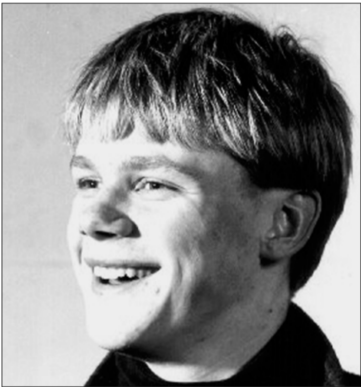
Ungur maður í FB.

ég að ég sé nokkuð jafnvígur á bæði málin en verð þó stundum var við að ég nota enn brenglaða setningaskipan þar sem enska orðaröðunin nær yfirhöndinni.