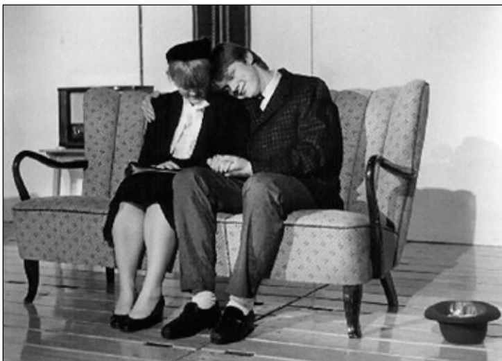
Á leiksviði í sköllóttu söngkonunni.

Ég var nokkuð virkur í félagsstarfinu í FB eftir að ég kom heim og þar hefur ef til vill orðið til sá grunnur sem ég byggði á í þeim víðfangsefnum sem ég hef tekið mér fyrir hendur. Eitt af því sem við gerðum var að stofna útvarpsstöð og annað var aðdragandinn að Undirheimum sem var félagsaðstaða fyrir unga Breiðhyllinga. Við vorum nokkur saman í þessu og við vorum einnig virk í hagsmunabaráttu fyrir skólann okkar og hverfið sem okkur þótti vænt um. Stemningin í FB dró þessa hagsmuni saman – hagsmuni þessara krakka sem voru að koma út grunnskólunum í hverfinu. Ég reyndi að nýta mér þetta þegar ég réðst síðar sem forstöðumaður fyrir Miðbergi um tíma. Við reyndum að efla hverfisvitundina og stemninguna því á orði var að Efra Breiðholtid væri erfitt hverfi. Við vildum sýna fram á að þar byggji kraftmikið fólk og ég held að okkur hafi tekist það að nokkru leyti. Þótt ég búi ekki lengur í Breiðholtinu þá er mér samt að segja að ég sé úr Breiðholtinu rétt eins og fólk segist vera úr Skagafirði af Héraði eða annarstaðar frá.