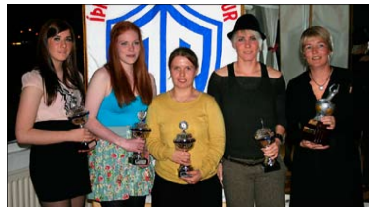
Verðlaunahafar meistaraflökks kvenna.