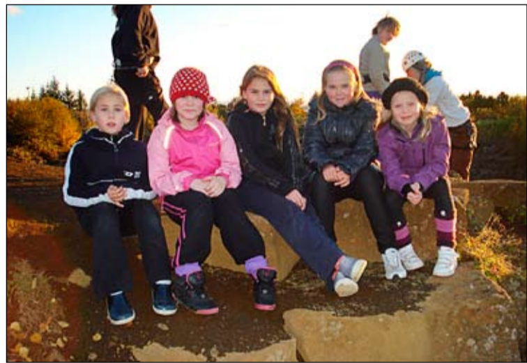
Skátastúlkur á ferðalagi.

skátarnir verið í útiöldun þar sem eldaðar voru súkkulaðikökur á kólum og sigið niður klettaveggi í Öskjuhlíðinni ásamt fjölda allan leikjum. Það reyndist mörgum erfitt að stíga fram af klettabrúnni í fyrsta skiptið en undir handleiðslu reyndra skátaforingja tekst flestum að sigrast á hræðslunni. Margir krakkar eru að takast á við skátaævintýrið í fyrsta sinn og eru allar sveitir í óða önn að geri sig klára fyrir fyrstu útilegu vetrarinnar á Úlfjótssvatni í lok október.