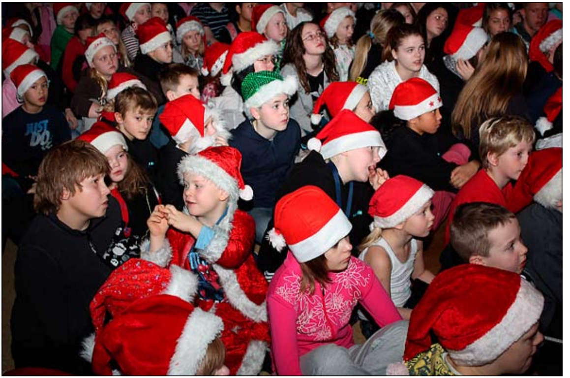
Hér má sjá hóp nemenda Hólabrekkuskóla með jólahúfurnar sínar.