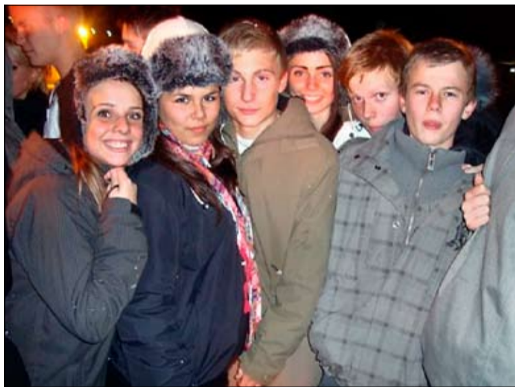
Tilbúin í slaginn.

pool borð, borðtennis, fótbolta-spil og margt fleira. Mætingin hefur verið með besta móti nú í byrjun árs, enda ekki að undra, því mikið líf og fjör er alla jafna í 111. Við viljum hvetja unglínga til þess að gerast vinir félagsmiðstöðvar-