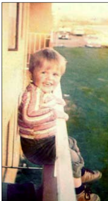
Úti á svölum. „Ég hef ekki hugmynd um hvar þessi mynd er tekinn né hvað ég er gamall á þessum svölum.“