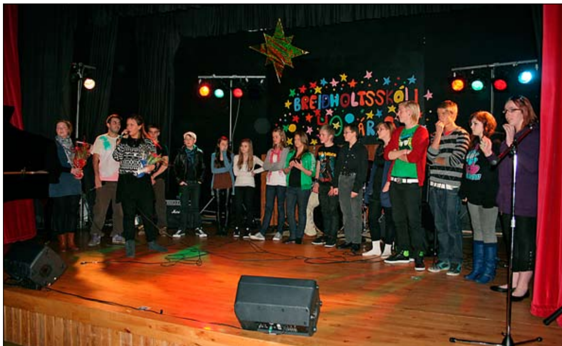
Hópur saman komin á sviðinu.