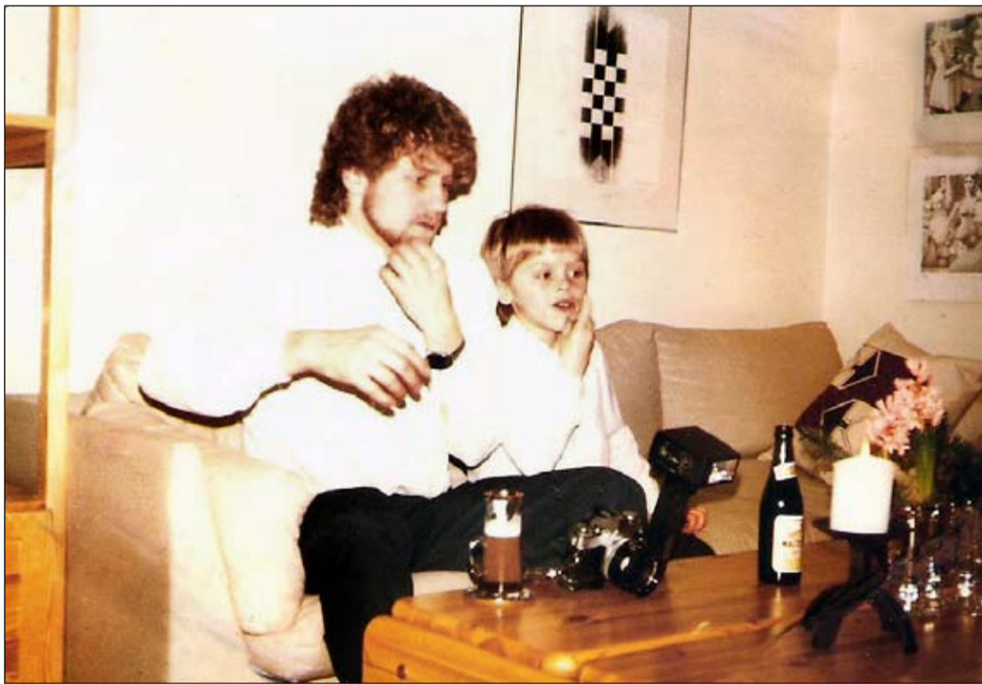
Ég og pabbi. „Hér erum við feðgarnir einhver jólin. Voðaleg hamingja alveg hreint og eftirvænting eftir gjöfum.“

„Ég geri það, já. Og ég hef alltaf átt í miklu ástarsambandi við Breiðholtið. Nýjasta bók mín, Vormenn Íslands, gerist öll í Fellahverfi. Á tímabili var ég með það í kollinum að mín fyrsta bók, Falskur Fugl, sem kom út 1997, ætti að gerast í Breiðholti. En þá var Breiðholtið farið að minna á settlegu svefnhverfin í Voga-