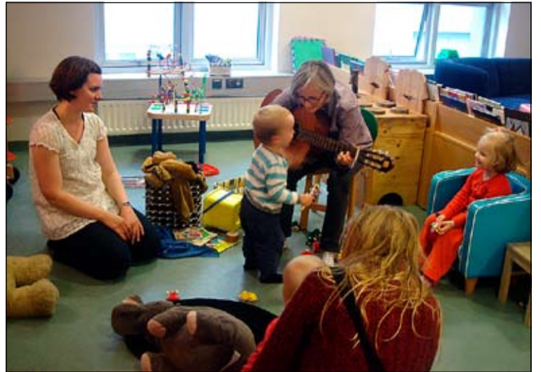
Gluggað í bækur og spjallað saman á fjölskyldumorgni í bókasafninu.