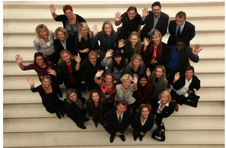
La délégation nordique