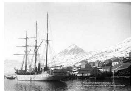
Fáskrúðsfjörður au début du siècle dernier

Pour en savoir plus : www.hopitalfrancais.fr