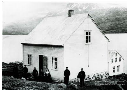
Fáskrúðsfjörður, l'hôpital français.

L'hôpital français à Fáskrúðsfjörður a été construit en 1903 et mis en service l'année suivante. C'était un des trois hôpitaux construits en Islande par la France pour aider et soigner les nombreux marins français qui pêchaient la morue dans les eaux islandaises.