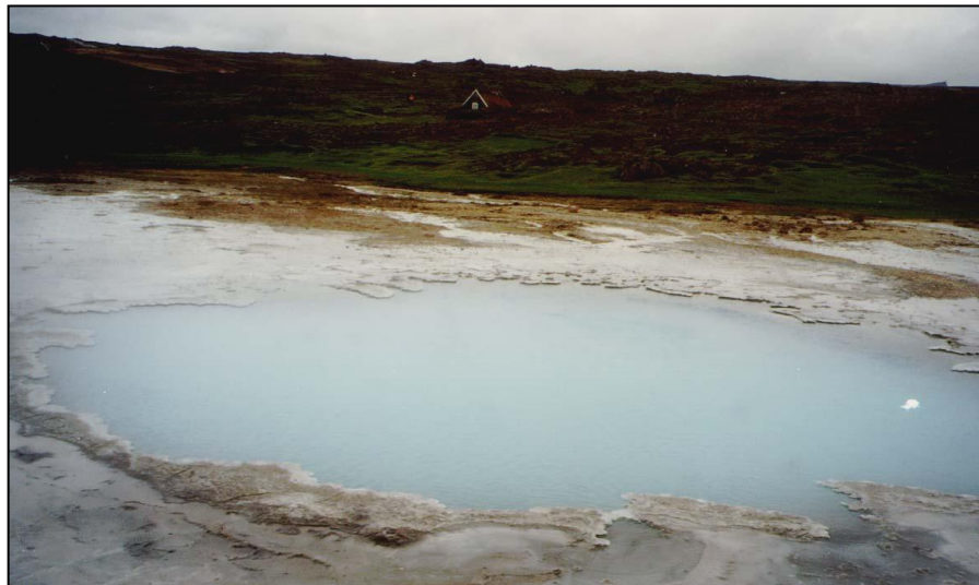
Bláhver á Hveravöllum