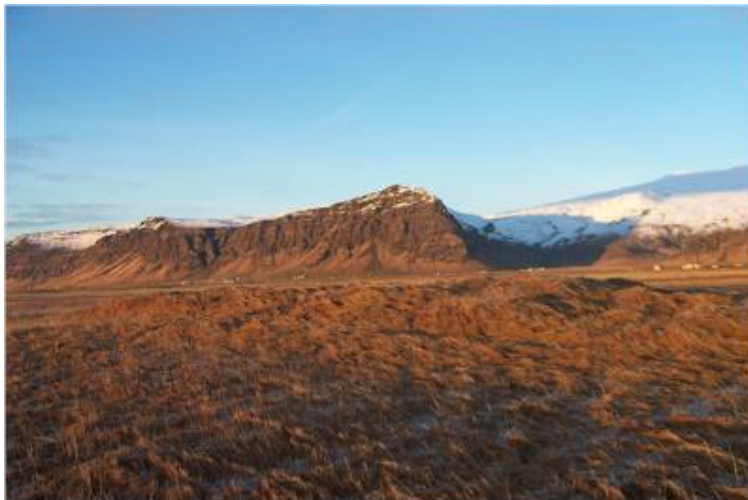
Myndin tekin til norðvesturs í átt að Steinafjalli.

(Þórður Tómasson, Sunnlenskar byggðir IV, Eyjafjöll, 55 )