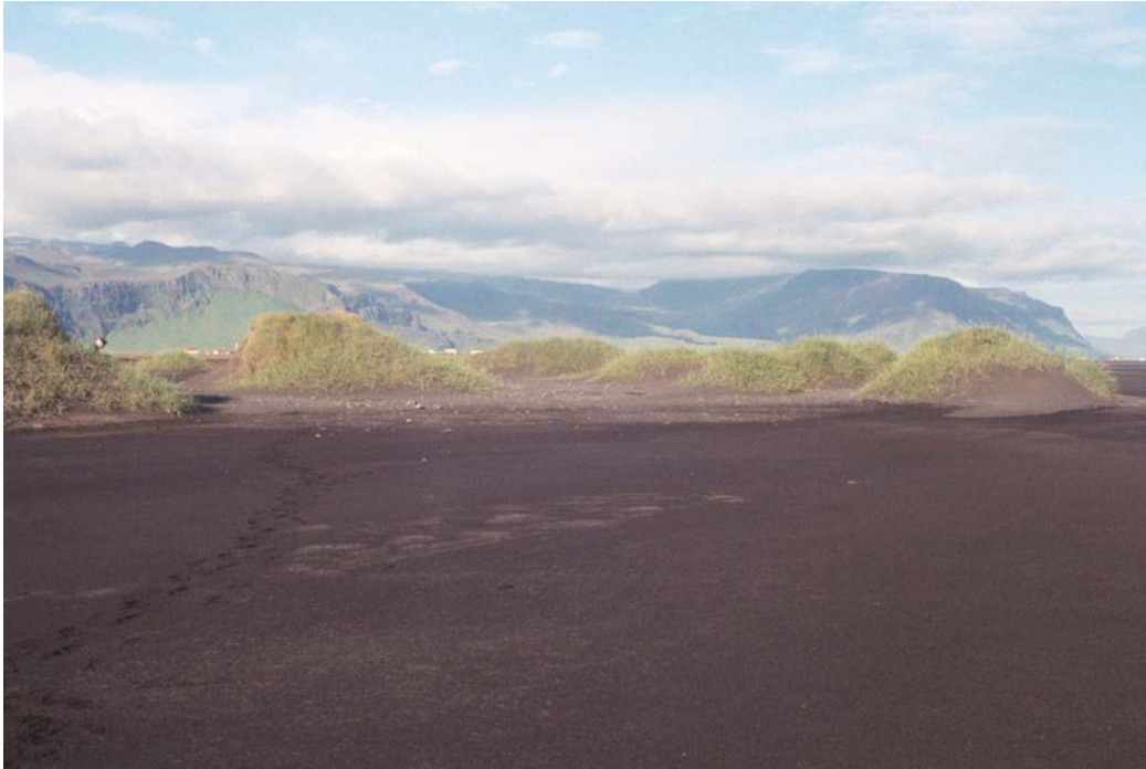
Horft til norðausturs í átt að Fornusöndum og Hvammsnúp

Nafnlaus uppblásinn bæjarrúst á Sandhólmagljá.