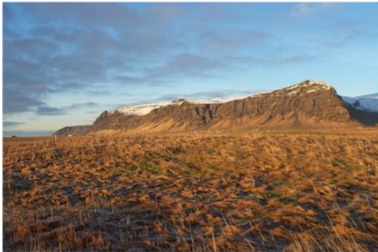
Myndin tekin til norðvesturs í átt að Steinafjalli.

(Þórður Tómasson, Sunnlenskar byggðir IV, Eyjafjöll , 63)