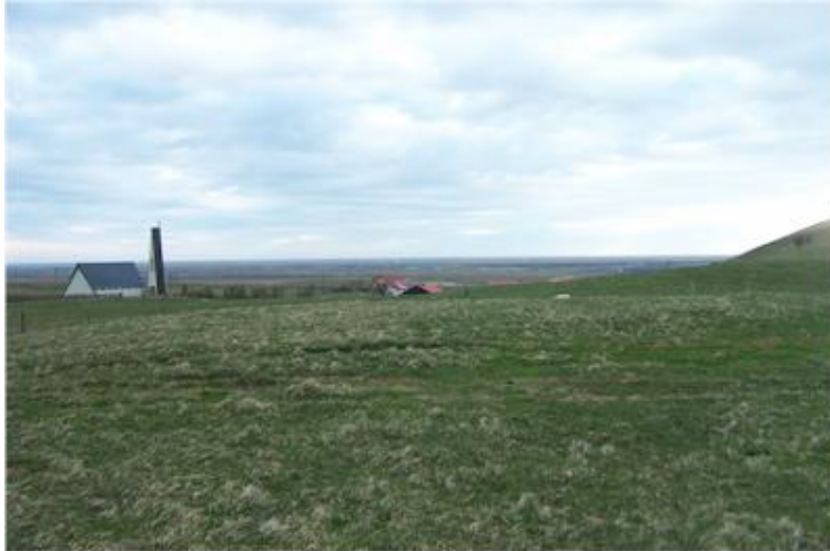
Horft heim að Stóradal og út yfir Markarfljótsaura.

Lítt áberandi ummerki um bæjarstæði má finna í túninu fyrir ofan Stóra-Dal. Þar hafa tún verið sléttuð og því ekki hægt að finna tættur.