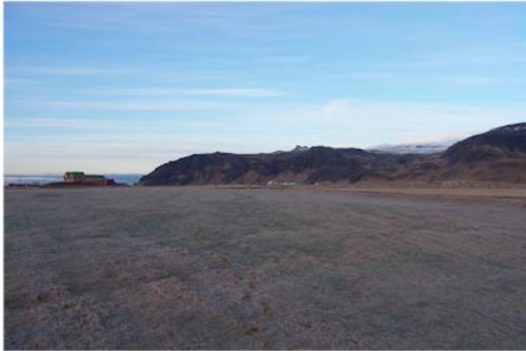
Myndin tekin til vesturs í átt að Hvammsnúpi.

(Þórður Tómasson, Sunnlenskar byggðir IV, Eyjafjöll, 136 )