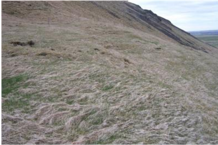
Staðsetning norðan í Dalsás, í miðri brekku.