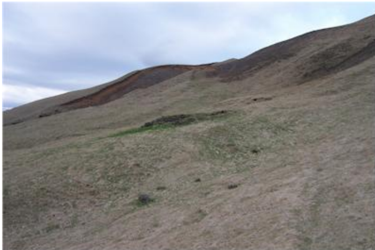
Staðsetning, innar í Dalsás

Tvær staðsetningar koma til greina varðandi staðsetningu Stóra-Murnavallar. Annars vegar staður upp í brekkunni norðan í Dalsás þar sem sést móta fyrir tóftum. Hinn staðurinn er aftur á móti fyrir framan tóft af fjárhúsum sem stendur innar og neðar. Stóri-Murnavöllur var hjáleiga frá Eyvindarholti. Bæjarstæðið er hátt í brekku. Þar eru nú miklar fjárhústættur. Á norðurvæng bæjarstæðis er örnefnið Hjálmarsstöðull og þar auðsæ mannaverk sem þó lítið ber á í sinuborinni jörð. Örnefnisins gefur í landamerkjaskrá Ólafstorfunnar. Forn garðstúfur er niður frá bæjarstæði á mótum brekku og mýrar. Á honum var aflraunasteinn sem kallaðist Fullsterkur.