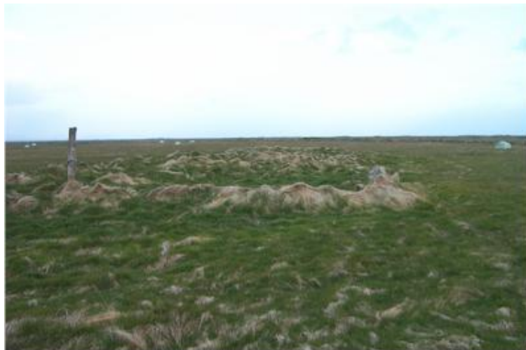
Ystabælikot vestra, mynd tekin til suðausturs.

Ystabælikot, eystra, stóð við austurmark Ystabælislands, um 500 m austnorðaustur frá Ystabæli. Jarðabókin 1709 greinir aðeins frá einu Ystabælikoti í byggð. 10 hundruð í mati og því helmingur torfunnar. Síðar urðu kotin tvö og hafi þá hvort 5 hundruð. Um galla jarðarinnar hefur Jarðabókin þetta að segja: „Engjum spilla ár á vetrum og sumri með leiri og óklárindum, so og flýtur Holtsós yfir slægjur nær hans útrá lengi teppist og næst þá ei heyskapur. Hagar eru litlir og þröngir.“ Eigi er því nú til að dreifa að Holtsós gangi yfir gömul slægjulönd Ystabælis og er þetta þá vitni um landeyðingu. Jarðabókin telur að jörðin geti fódrað á heyjum 13 kúa þunga og er furðu mikið miðað við ástand jarðarinnar síðar.