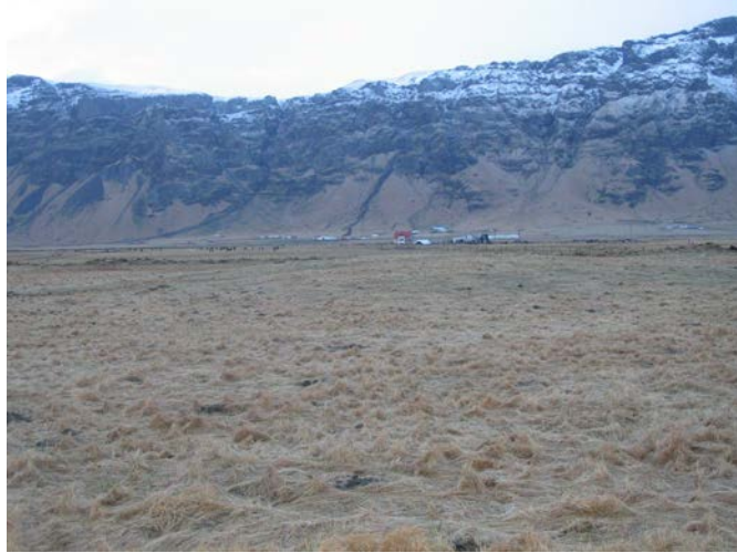
Bæjarhóll Berjaneskots, Berjanes og Steinafjall