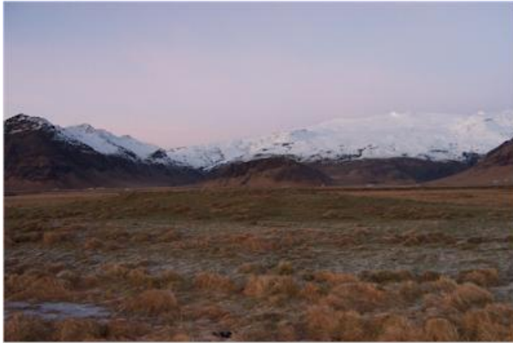
Syðra-Bakkakot, mynd tekin til norðvesturs í átt að Lambafelli.