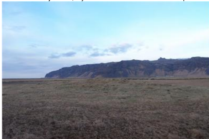
Mynd tekin til vestur í átt að Hvammsnúpi.