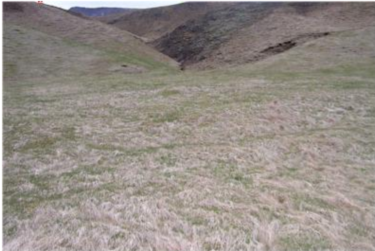
Bæjarstæðið fyrir framan Kotagilslæk.

Bærinn hefur staðið þar sem heitir Stekkatún, við Kotagilslæk sem fellur hér fram úr Kotagili, bak við bæjarstæðið. Rústir mjög óglöggar.