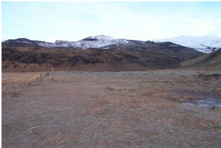
Myndin tekin til norðurs, í átt að Fosshólum.

(Þórður Tómasson, Sunnlenskar byggðir IV, Eyjafjöll, 137)