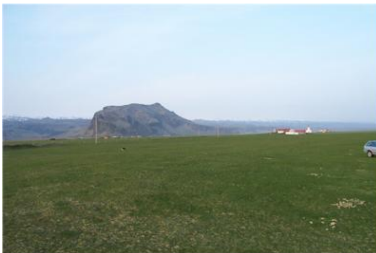
Mynd tekin til norðausturs í átt að Hrutafelli.