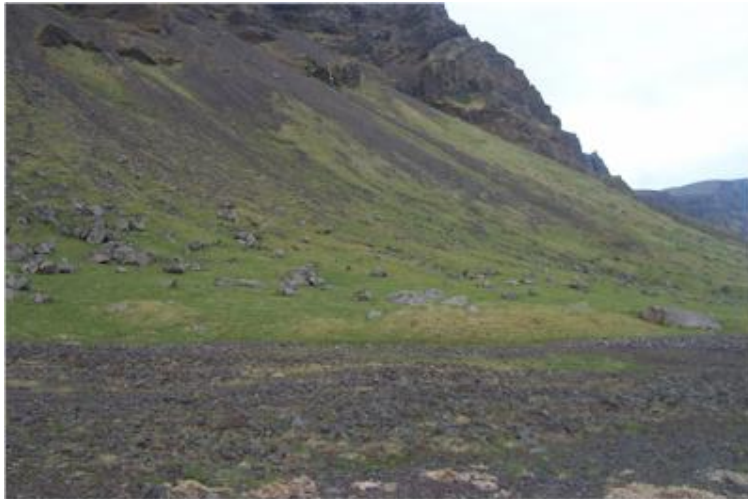
Horft til suðausturs í átt að Hvammsnúp

Upp við fjallsrætur fyrir austan Sauðhúsvöll er greinilegt bæjarstæði sennilega lagt í eyði fyrir hrap ofan frá fjallinu. Hrapklettur eru í rústunum. Nafnlaust