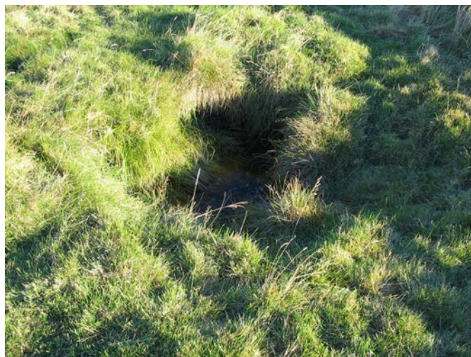
Brunnurinn í Syðri-Rotum, norðan við hólinn.