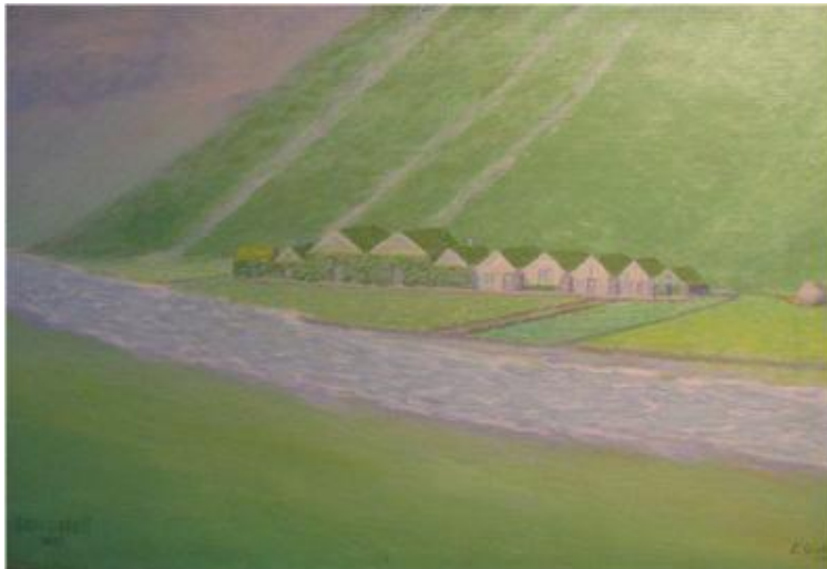
Málverk af Lambafelli frá um 1900 málað af Engilbert Gíslasyni, eign Skógasafns.

(Þórður Tómasson, Sunnlenskar byggðir IV, Eyjafjöll, 89)