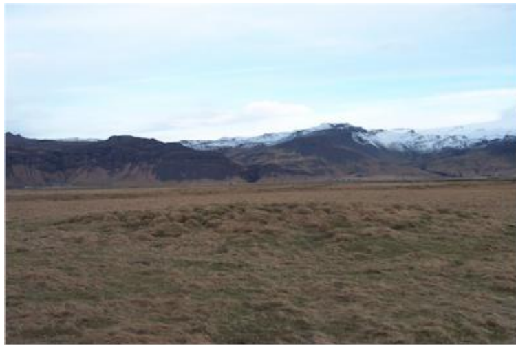
Mynd tekin til norðurs í átt að Miðskálaegg.