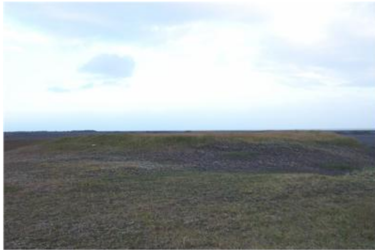
Mynd tekin til suðausturs.

Grasbali við fjörujaðarinn austan við vegarslóða fram að sjó. Ekki er hægt að greina neinar byggingar. Þar hafa fundist gripir frá forni búsetu og einnig hefur verið grafið niður á hleðslur.