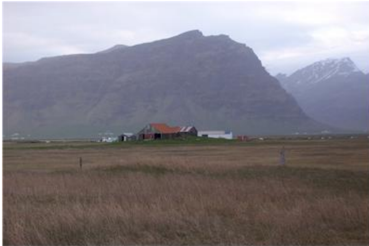
Mynd tekin til norðurs í átt að Núpakotsnúp.

Stór og greinilegur hóll suður af Ystabæli. Á honum standa gömul fjárhús ofan á gömlum bæjartóftum.