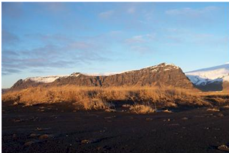
Myndin tekin til norðvesturs í átt að Steinafjalli.

Gíslakot var hjáleiga frá Miðbæli, 10 hundruð að fornu mati. Bærinn stóð um 350 m vestsuðvestur frá Miðbæli en var fluttur þaðan á 18. öld sökum landeyðingar af völdum sjávar. Gamla bæjarstæðið er nú norðan í Miðbælisfjöru og um 50 m frá því upp á grös. Bærinn var að nýju byggður nálægt vesturmörkum Miðbælistorfu, um 300 m norðaustur frá Ystabælistoti eystra og um 950 m norðnorðvestur frá Miðbæli. ( Þórður Tómasson, Sunnlenskar byggðir IV, Eyjafjöll, 68 )