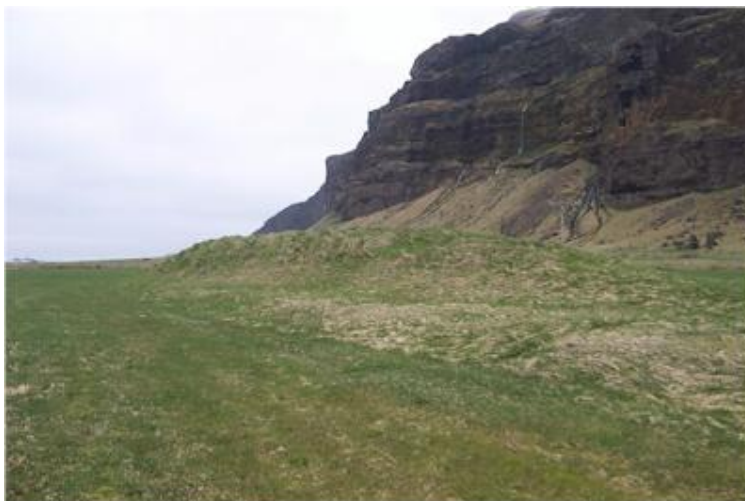
Mynd tekin til vesturs í átt að Paradísarhelli.

Mikill bæjarhóll, nokkur hundruð metra vestan við bæinn Fit. Hólinn er mikill og langur og í honum má sjá móta greinilega fyrir byggingum. Bakki er fyrir framan hólinn og má ætla að þar hafi Markarfljót runnið á þeim tíma þegar það rann austur með Eyjafjöllum fyrir á öldum.