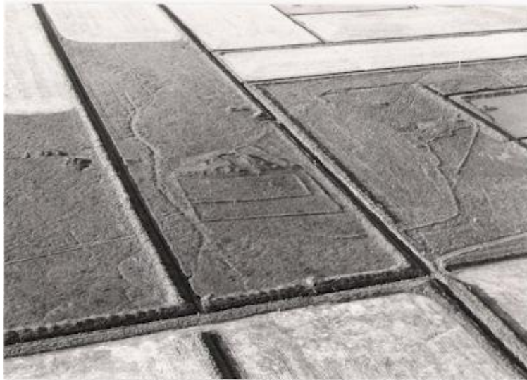
Gerðakot, fornir túngarðar greinilegir og engjagata upp að Holti. Myndin er tekin af Háskólanum í Birmingham á Englandi.

(Þórður Tómasson, Sunnlenskar byggðir IV, Eyjafjöll, 136 )