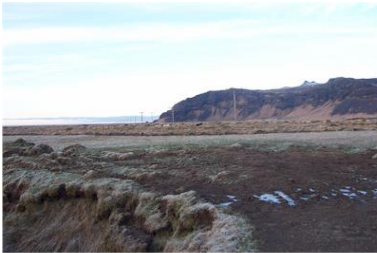
Myndin tekin til norðvesturs í átt að Hvammsnúpi.

(Þórður Tómasson, Sunnlenskar byggðir IV, Eyjafjöll, 137)