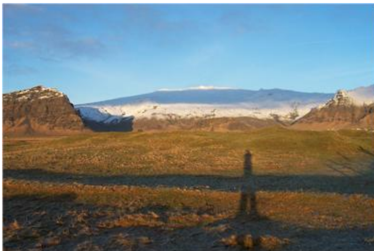
Myndin tekin til norðurs í átt að Lambafelli.

(Þórður Tómasson, Sunnlenskar byggðir IV, Eyjafjöll, 64)