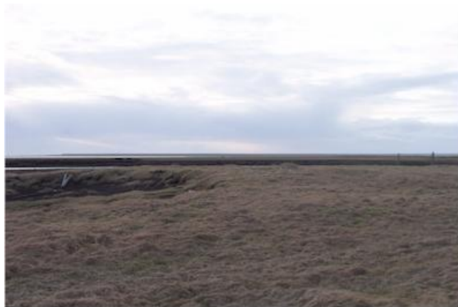
Mynd tekin til suðurs.