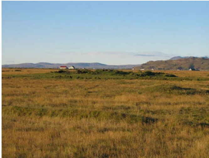
Nafnlaust bæjarstæði næst, Helgusandar fyrir miðri mynd.