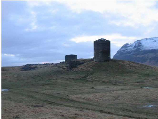
Stór og voldugur bæjarhóll þar sem Berjanes stóð.