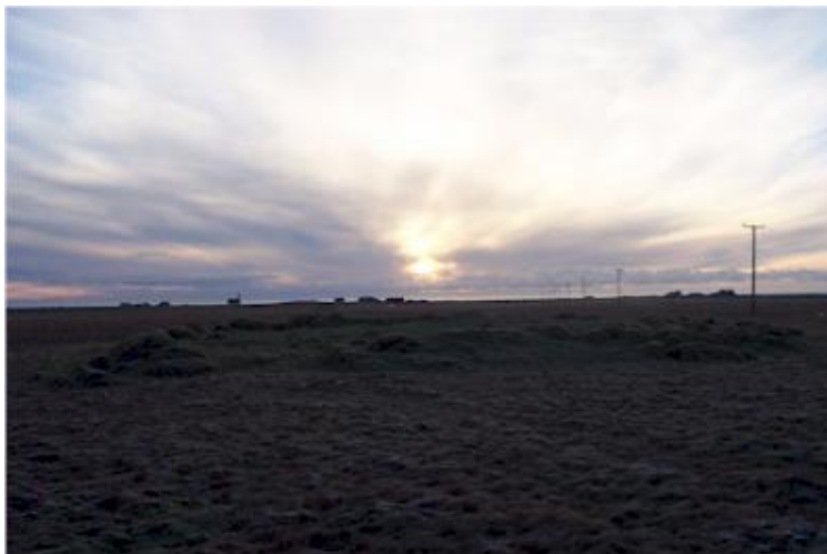
Myndin tekinn til suðurs í átt að Eyvindarhólum.

(Þórður Tómasson, Sunnlenskar byggðir IV, Eyjafjöll, 55)