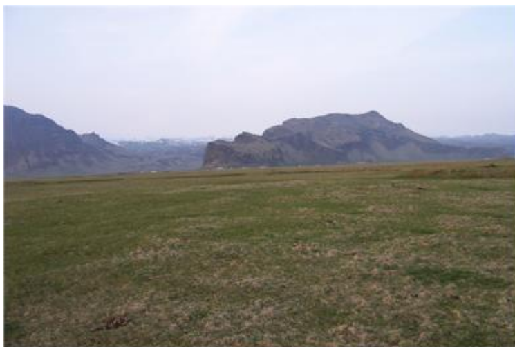
Mynd tekin til norðurs í átt að Hrutafelli.

(Þórður Tómasson, Sunnlenskar byggðir IV, Eyjafjöll, 58 )