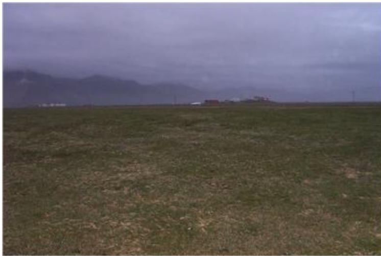
Mynd tekin til norðausturs í átt að Hvammsnúp.