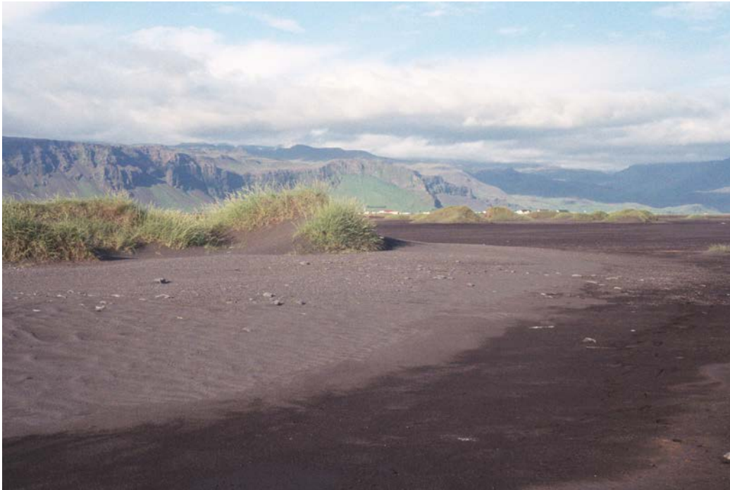
Horft til norðausturs í átt að Fornusöndum og Hvammsnúp

Uppblásin bæjarrúst. Hér stóð sennilega býlið Stekkjarbakki á 17. öld. Brot úr krítarpípu frá lokum aldarinnar er til tímaákvörðunar.