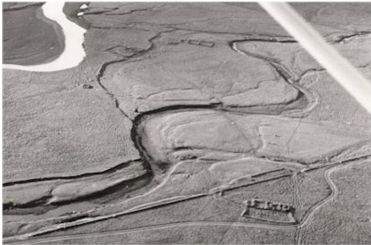
Sitjandi efst til vinstri á myndinni en Gíslatættur neðst, myndin er tekin af Háskólanum í Birmingham á Englandi.