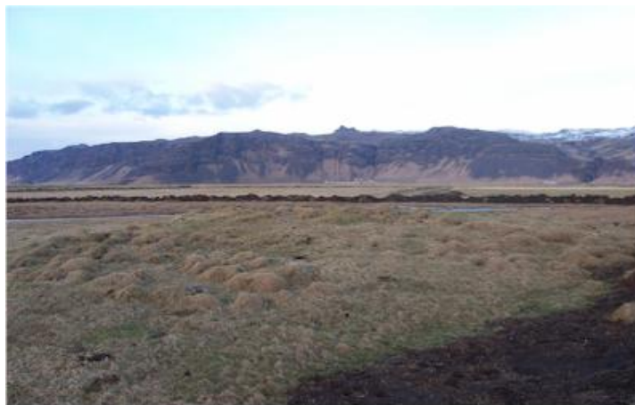
Efri Lækjarbakki, mynd tekin til norðvesturs í átt að Núi.

(Þórður Tómasson, Sunnlenskar byggðir IV, Eyjafjöll, 137)