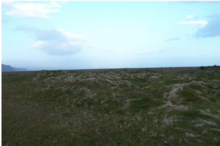
Ystabælikot eystra, mynd tekin til austurs.

(Þórður Tómasson, Sunnlenskar byggðir IV, Eyjafjöll, 70)