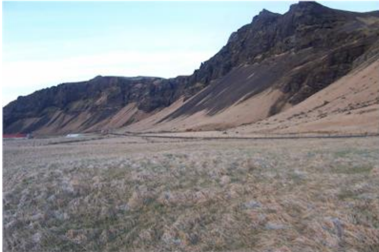
Myndin tekin til vesturs í átt að Írá.

Bærinn stóð um 20 metrum sunnan við veginn vestan Ystaskála. Bæjarhólinn er greinilegur en tættur, sléttaður út.