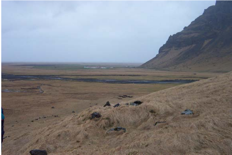
Krosshlaðið fjós, Þorvaldseyri í bakgrunni.