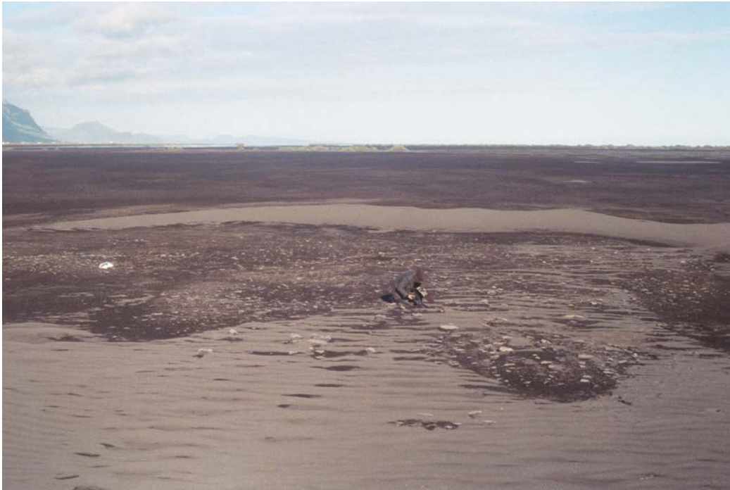
Horft til austurs.

Uppblásin bæjarrúst. Að sögn stóð hér býlið Melar sem um getur í bæjarþulu Eyjafjalla: "Melar eru famir". Bæjarstæðið er útflett í gljánni, ca. 1400 m 2 að víðáttu.