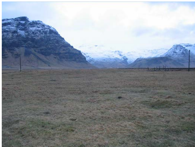
Berjaneskot II, Núpakotsnúpur í baksýn.