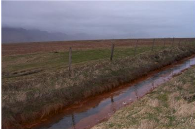
Mynd tekin til norðausturs í átt að Hvammsnúp.

Forn bæjarstæði við Sandhólsmaveg í landi Nýjabæjar. Bæjarstæðið er norðan og sunnan skurðar sem sem liggur hér meðfram Sandhólsmavegi. Við skurðgröftinn komu í ljós margvíslegar mannamínjar.