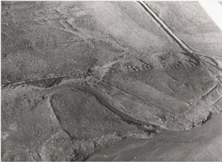
Gamla Miðbæli, óglögg mótar fyrir kirkjurúst og kirkjugarði.