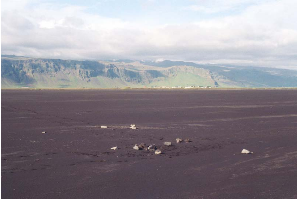
Horft til norðausturs í átt að Fornusöndum og Hvammsnúp