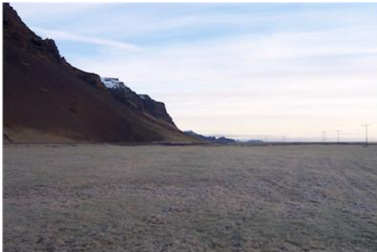
Mynd tekin til austurs í átt að Holtsnúpi og Steinafjalli.