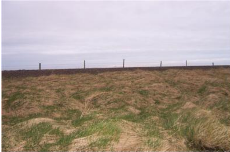
Mynd tekin til suðurs í átt til Vestmannaeyja.

Bæjarstæði á Sandhólsmavegi austan Fornusanda í landi Nýjabæjar.