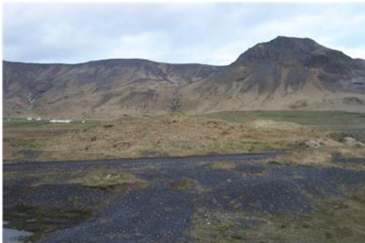
Horft til austurs í átt að Fagrafelli.

Á Markarfljótsaurum vestur frá Stóra-Dal er gróinn hóll og undirstaðan blágrýtisklöpp. Hann nefnist Lambhúshóll og þar stóð til um 1643 samnefnd hjáleiga Stóra-Dals. Munnmæli herma að Lambhúshóll hafi staðið í miðjum Dalsengjum og þarf ekkert að mæla gegn því að satt sé.