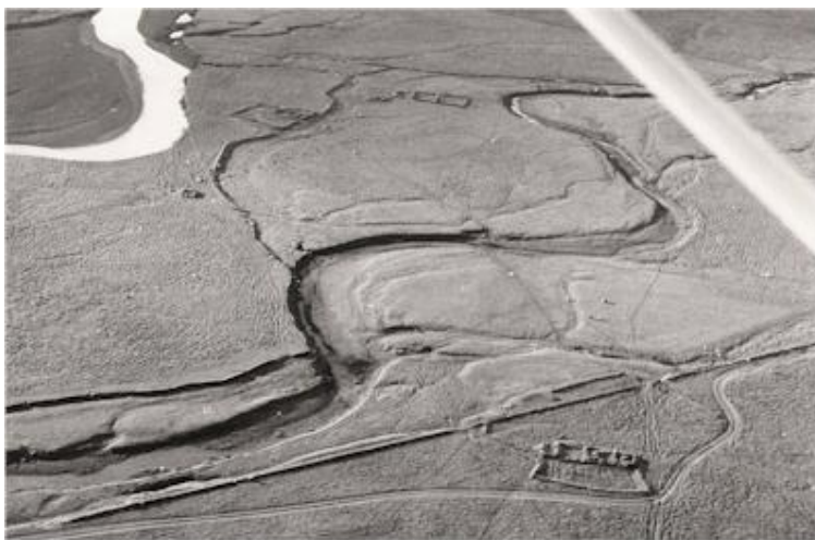
Gíslatættur neðst á mynd