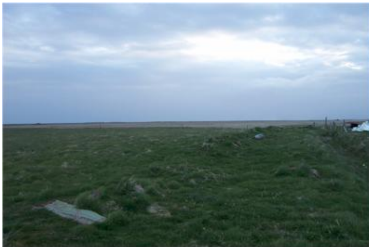
Mynd tekin til suðvesturs.

Bæjarstæðið er sunnan við skurð sem grafinn hefur verið fyrir framan norðurbæinn. Ekki er hægt að greina tóftir. Hóllinn hefur verið jafnaður út við jarðvinnslu en þó má sjá móta fyrir honum í landinu.