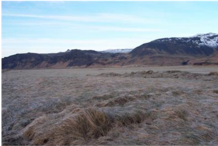
Myndin tekin til norðvesturs í átt að Miðskálaegg.

(Þórður Tómasson, Sunnlenskar byggðir IV, Eyjafjöll, 137)