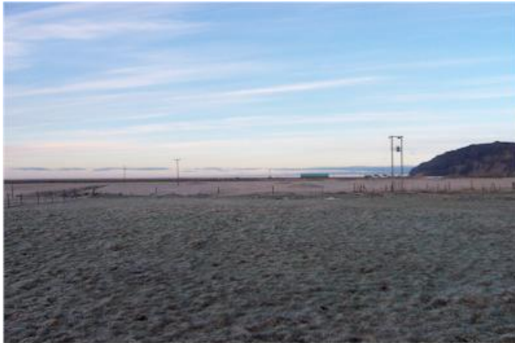
Myndin tekin til vesturs til Hvamnnúps.

Bærinn stóð litlu sunnar en Ormskot sem nú er í byggð, um það bil 30 metrum eða svo. Lítil ummerki sjást um bæjarstæðið.