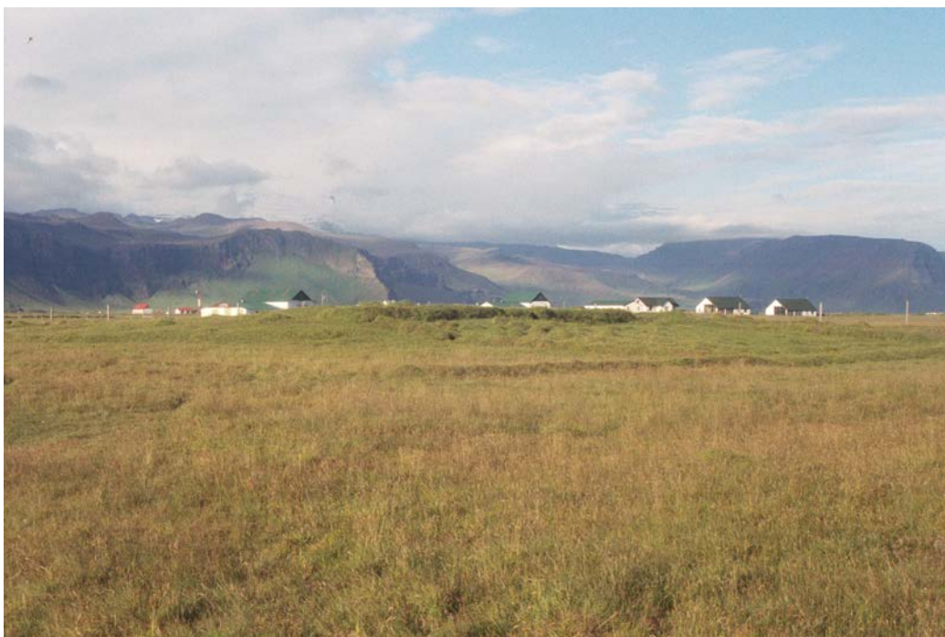
Horft til norðausturs í átt að Fornusöndum og Hvammsnúp