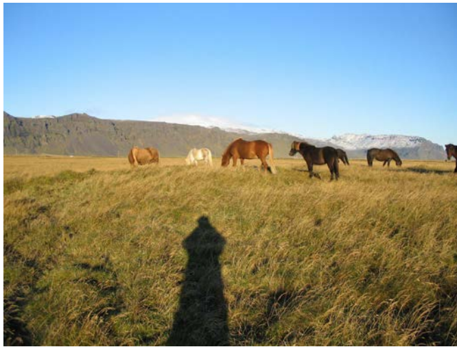
Hestar nærast á gömlu bæjarstæði. Horft til norðausturs.

Nafnlaus bæjarrúst suðsuðvestur frá Efri-Rotum og í landi Efri-Rota. Tættur mjög óskýrar.