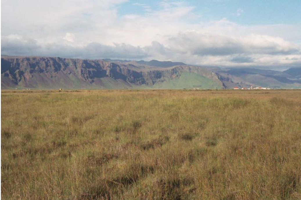
Horft í norðaustur að Hvammsnúp