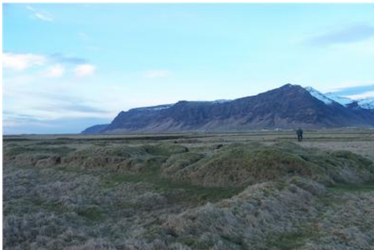
Mynd tekin til norðvesturs í átt að Steinafjalli.