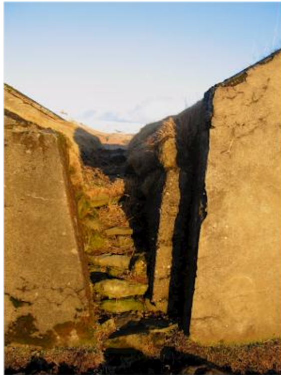
Tröppur upp í húsasund í Syðra- Hrútafellskotí. Áður algengt, nú einstakt dæmi.