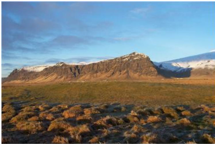
Myndin tekin til norðvesturs í átt að Steinafjalli.