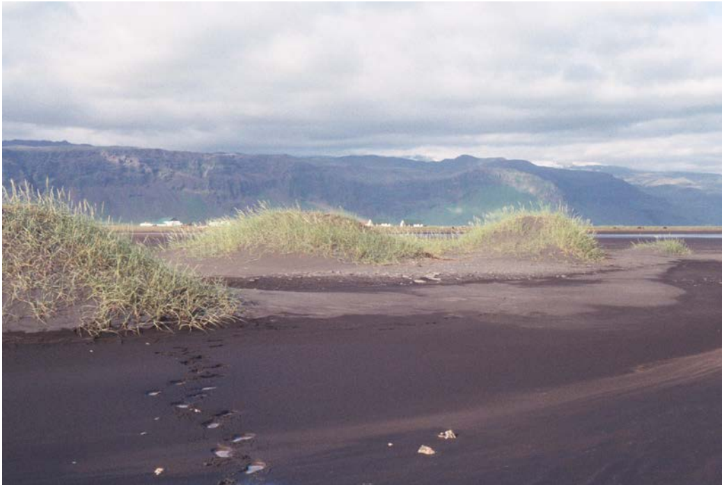
Horft til norðausturs í átt að Fornusöndum og Hvammsnúp

Nafnlaus uppblásin bæjarrúst á Sandhólmagljá. Litlar minjar byggðar, enda sóttu Sandhólmabændur hingað í rústimar byggingargrjót