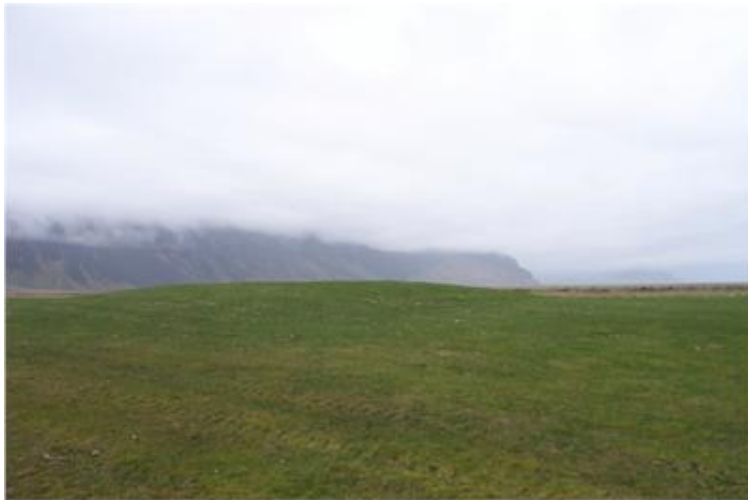
Mynd tekin til austurs í átt að Hvammsnúpi.

Forn bæjarhóll nokkru suð-austur af Fitjarmýri. Hólinn hefur verið sléttaður í tengslum við ræktun túns, en er þó greinilegur. Sitt hvoru megin við hann eru tvær holur sem líklega eru brunnholur. Á þessu svæði þar sem hólinn stendur má sjá tættur útihúsa.