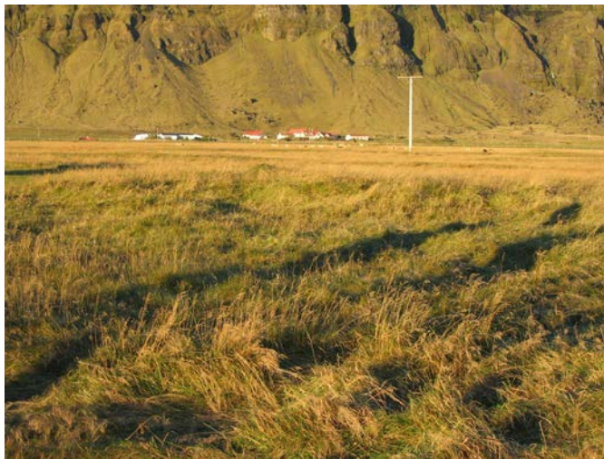
Ysta-Borg, Fit í baksýn.