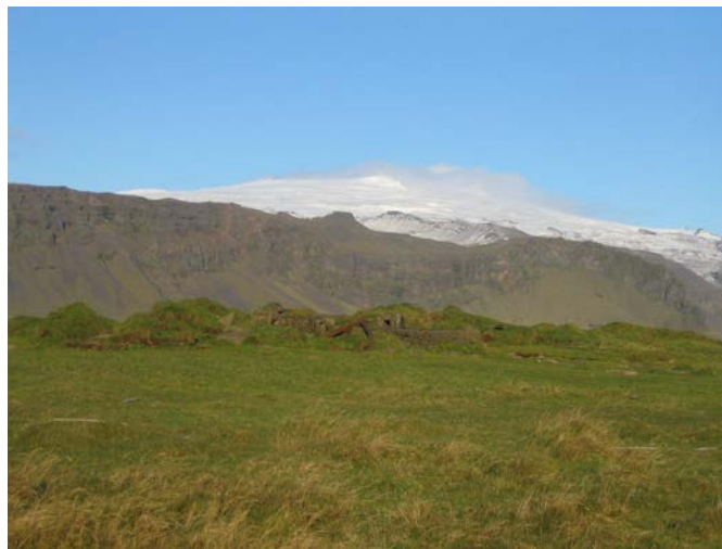
Bæjarhóll Helgusanda, Eyjafjallajökull í baksýn.