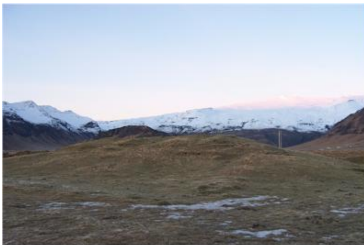
Efra-Bakkakot, mynd tekin til norðvesturs í átt að Lambafelli.

Þessi býli voru tengd Skógverjum hinum fornu og byggðinni í Ytri-Skógum og austur í Krók (Drangshlíð, Skarðshlíð). Einn vottur þess er sá að býlin voru í Skógasókn, að nokkru sem hólmi í Eyvindarhólasókn.