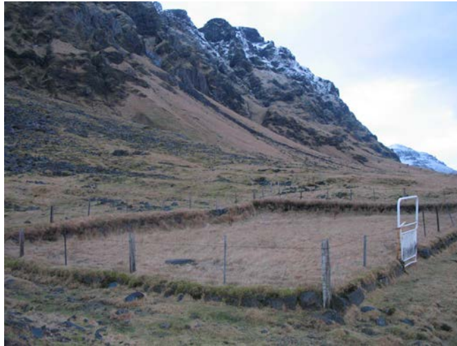
Steinakirkjugarður, fyrir neðan bæjarrústir.

(Þórður Tómasson, Sunnlenskar byggðir IV, Eyjafjöll , 76)