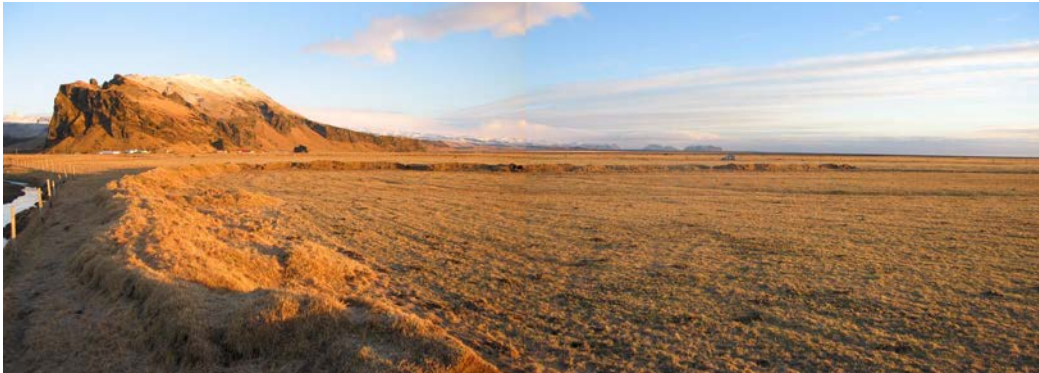
Mikill og forn túngarður norðan við Hrútafellskot syðra.

Mynd tekin til norðausturs í átt að Hrútafelli.