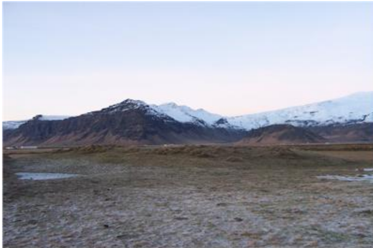
Mynd tekin til norðvesturs í átt að Steinafjalli.

Bæjarhólinn stendur á hægri hönd þegar ekið er niður að Stóru-Borg. Hólinn er áberandi og sést greinilega frá veginum skömmu áður en maður er hálfnaður niður að Stóru-Borg. Hólinn er ekki mjög hár en nokkuð mikill um sig og þýfður mjög. Ekki sjást nein greinileg merki um húsatóftir í honum. Hér var búið til 1704. Hólinn er friðlýstur.