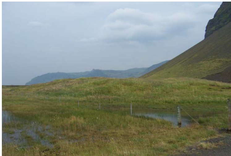
Hellnhóll, Holtsnúpur til hægri á mynd.

(Þórður Tómasson, Sunnlenskar byggðir IV, Eyjafjöll, 136 )