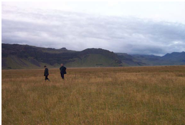
Svæði það sem Hali var, Hvammsnúpur í baksýn.

Halaleira heitir austurhlutinn af landi Fitjarmýrar, nú öll vaðandi í grasi, en áður lítt gróin sökum framburðar Markarfljóts sem flæddi hér um meira og minna um árhundruð og allt fram um aldamótin 1900. Hér stóð býlið Hali til um 1600, land þess lagðist undir Fit og Fitjarmýri. Fit átti þriðja hverja þúfu í Halaleiru sagði gamla fólkið. Þrír hæðarbalar austast í Halaleiru, raunar fleiri benda til byggðar. Þeir eru um það í beinni línu milli Hvamms og Nýjabæjar. Steinn sást í einum balanum fyrir löngu. Húsatættur hafa máðst út sökum sandfoks fyrr á árum. Rétt væri að gera hér könnun með járntei. Keldufarvegur liggur suðaustur eftir landinu. Áður var alfaraleið með honum austur til Mýrabæja og vestur frá Mýrabæjum. Grænhóll er í landi Fitjarmýrar upp frá Nýjabæ, á Engjabökkum. Þar eru rústir.