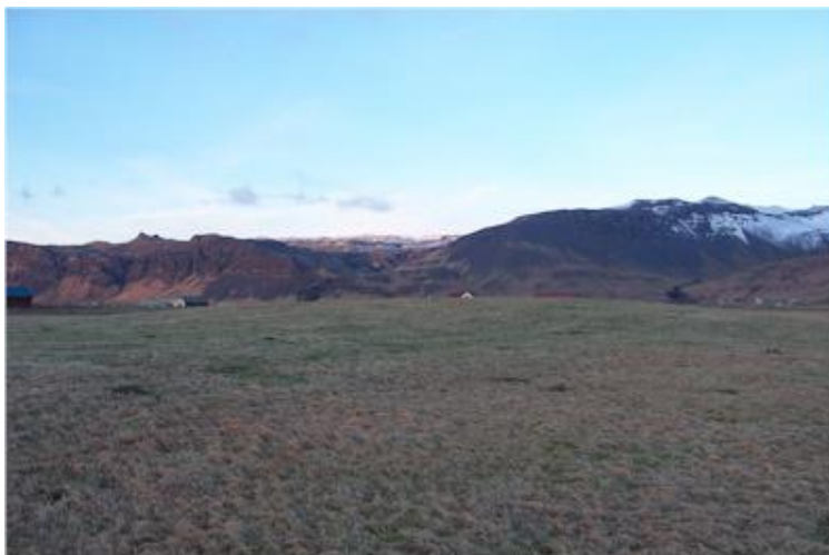
Mynd tekin til norðvestur í átt að Miðskálaegg.