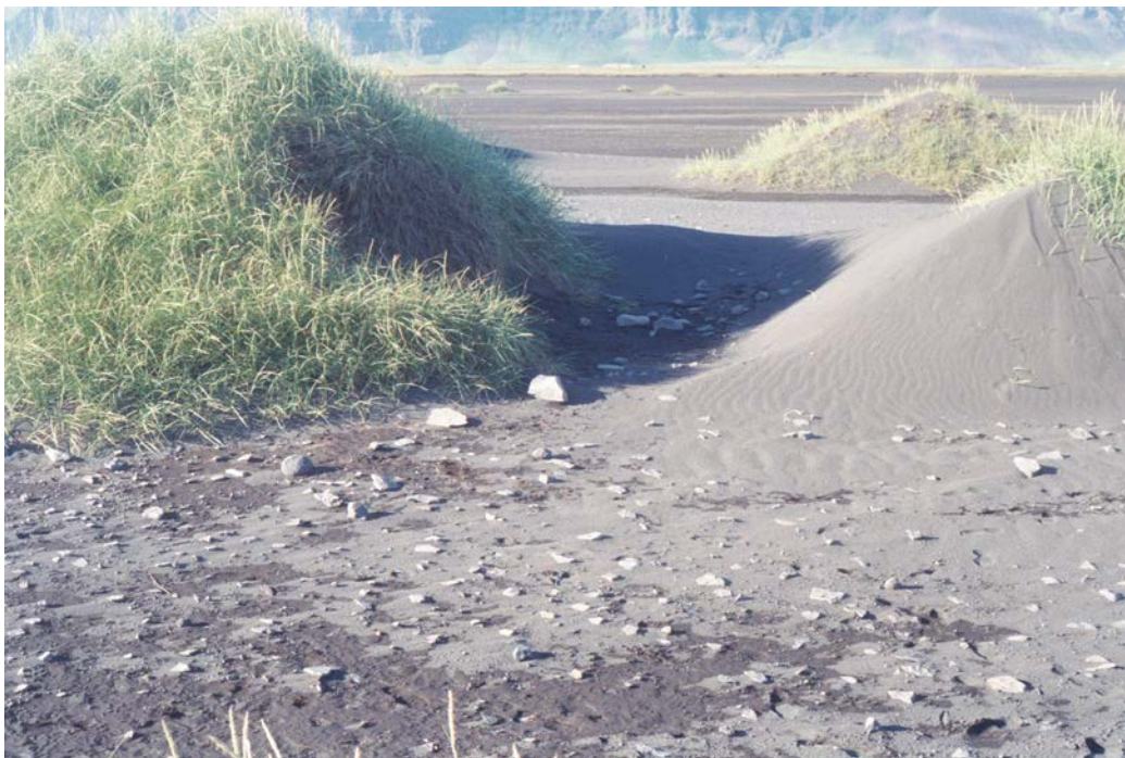
Horft til norðurs í átt að Fit

Uppblásin bæjarrúst. Hér stóð meginbýlið í Sandatorfu, Sandar, frá um 1400 til um 1640. Var þá flutt á hið forna bæjarstæði, Fornusanda ofar í landinu. Byggðarminjar glöggar en oft huldar af melkollum.