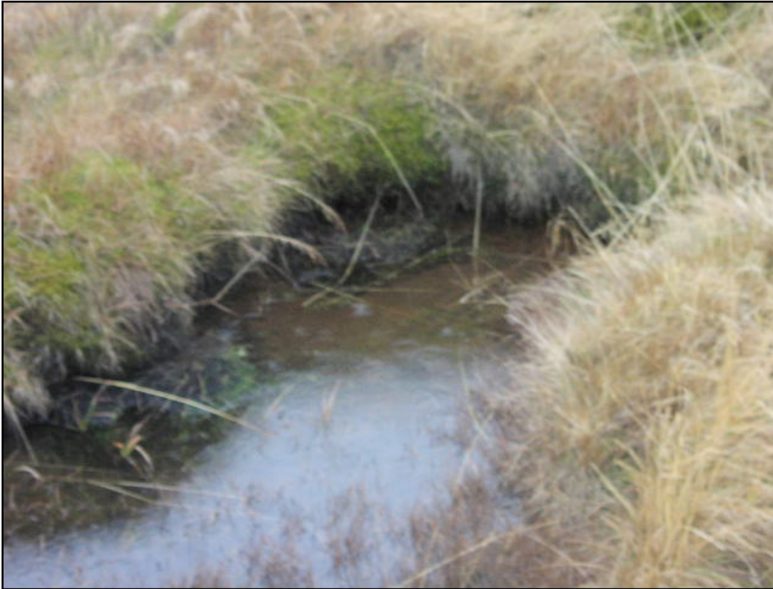
Mynd 3. Mynd af einni af þremur mógröfum (1.3) sem fundust.