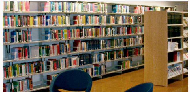
Bókasafnið tók til starfa á 80 ára afmæli félagsins árið 1991 og hættir starfsemi á breyttum tímum, nú 33 árum síðar.

Lögmenn geta nú komið á opnunartíma bókasafns Háskólans í Reykjavík og nýtt sér safnkostinn sem þar er, bækur jafnt sem rafrænar heimildir. Í byrjun október var svo haldin sérstök kynning þar sem upplýsingafræðingar skólans fóru